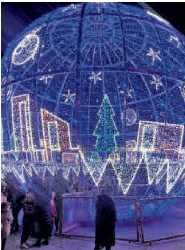
CARPA DE LA NAVIDAD: La carpa situada en la Plaza Mayor de Leganés alberga la inmensa mayoría de las actividades navideñas de la localidad. Habrá hinchables, un tren de las Tortugas Ninja y un Scalextric para los más pequeños. La plaza de la Fuente Honda cuenta con una esfera luminosa con espectáculo incluido.

LEGANÉS >> Zona Centro | Hasta el 6 de enero