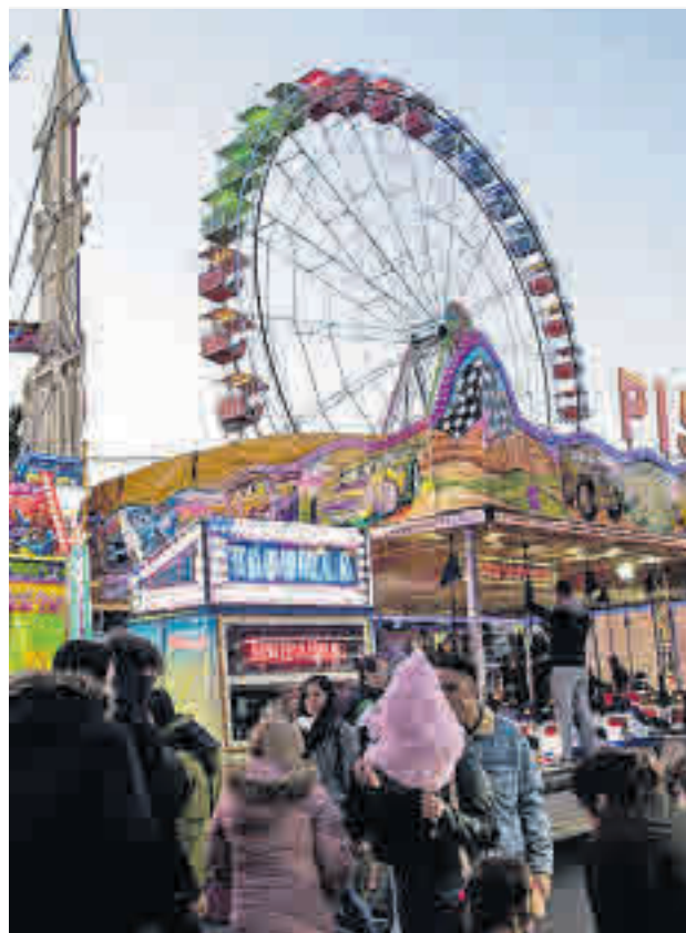
POZUELO JOY CHRISTMAS: El recinto navideño más grande de la zona Noroeste de la Comunidad se encuentra en Pozuelo, concretamente en el parking de ESIC. Pista de hielo, atracciones para todos los públicos y 'food trucks' son los principales atractivos de esta iniciativa, que celebra este año su primera edición.

LEGANÉS >> Zona Centro | Hasta el 6 de enero