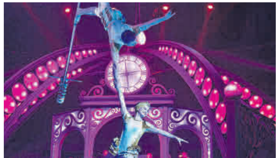
Un momento de la función en el escenario de Ronda de Atocha 35

En esta ocasión, a la estación donde vive el protagonista, Don Búho, llega un tren con los integrantes de un circo. Junto a sus fieles ayudantes ayudarán a esta insólita 'troupe' a comprender qué es lo más importante de la Navidad.