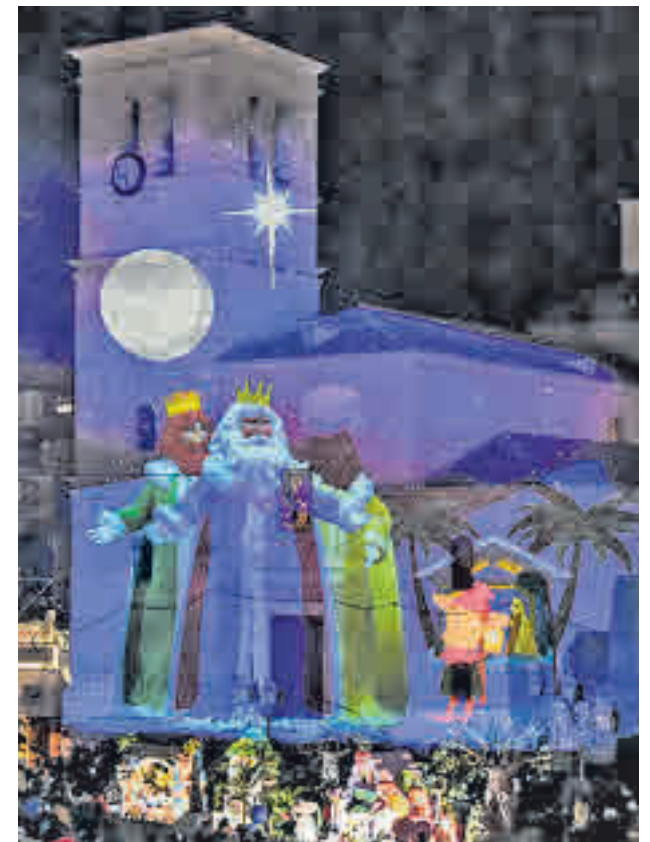
MÁGICAS NAVIDADES: Torrejón de Ardoz se ha hecho con varios reconocimientos nacionales e internacionales gracias al despliegue que cada año realiza para celebrar la Navidad. Este año se ha aumentado el espacio dedicado a las atracciones y los espectáculos que ya se han convertido en un clásico.

POZUELO DE ALARCÓN >> Avenida de Europa | Hasta el 7 de enero