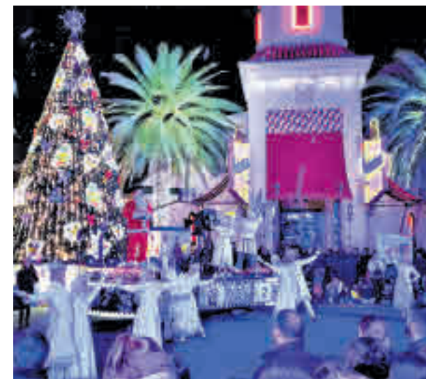
Espectáculo navideño en el Parque Warner

Justo antes del cierre, habrá un desfile navideño por las calles del Parque Warner con todos sus personajes.