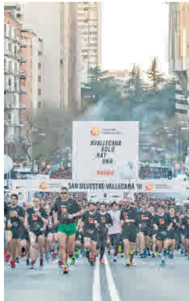
Imagen de la salida de la pasada edición en Concha Espina

La masificación de la cita vallecana o el horario (el hecho de celebrarse por la tarde hace que prácticamente se solape con las celebraciones familiares de Nochevieja) abren la puerta a otros eventos que también se disputan