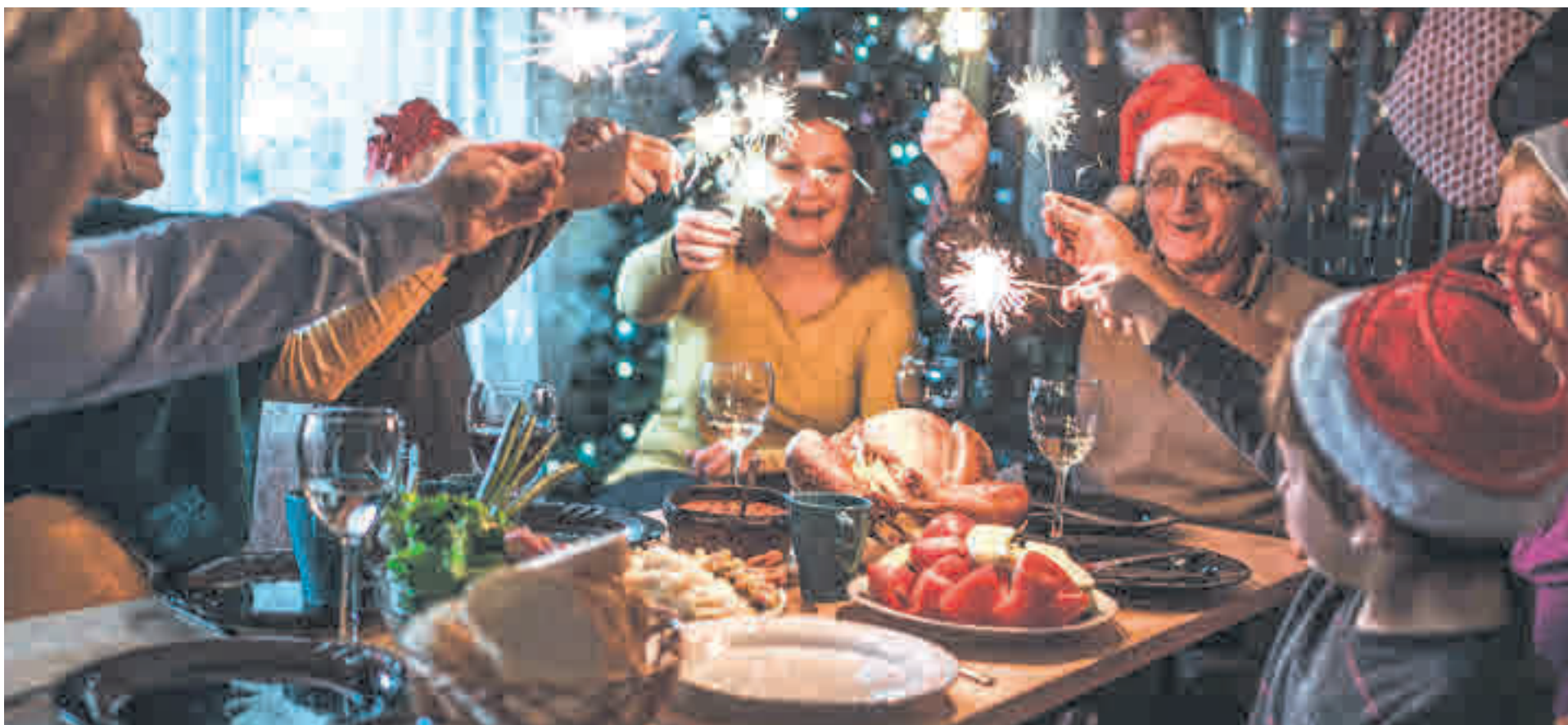
Las celebraciones en torno a mesa y mental son típicas de estas fiestas navideñas