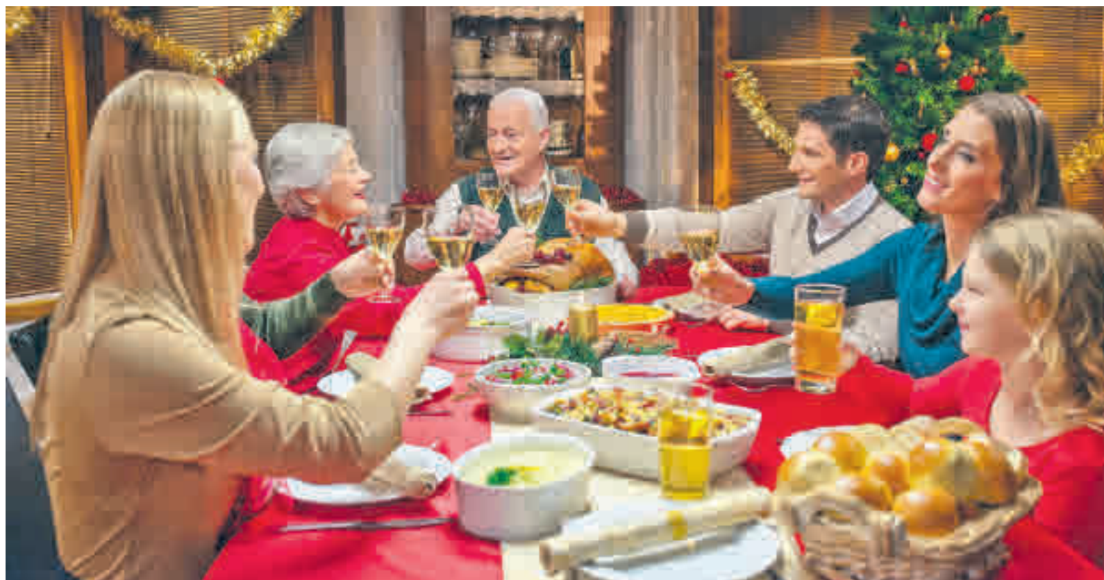
Las comidas y cenas familiares forman parte de la tradicional celebración navideña

La política, la economía, el fútbol y el trabajo, por este orden, son las cuestiones que más polémica y discusiones generan en las típicas reuniones familiares navideñas ● Los especialistas recomiendan a los comensales opinar de forma relajada y sin agresividad para evitar tensiones y estrés