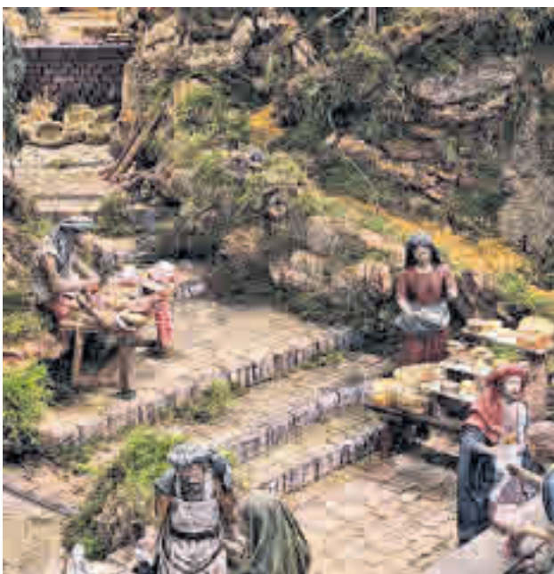
BELÉN Y ATRACCIONES: San Sebastián de los Reyes tiene el honor de contar con el Belén Monumental más grande de la Comunidad. Para completar su oferta, este viernes 20 se abre su Parque de la Navidad con diferentes zonas de temática específica dedicadas a Papá Noel, las actividades deportivas o la nieve. SAN SEBASTIÁN DE LOS REYES >> Parque de la Marina | Hasta el 6 de enero