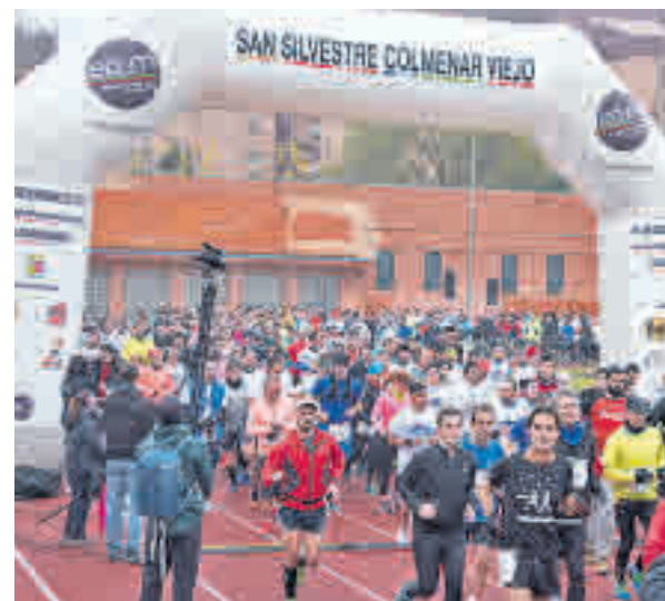
La San Silvestre de Colmenar llega a su V edición

Como era de esperar, la principal oferta se concentra el día 31. Colmenar Viejo, San Sebastián de los Reyes y Las Rozas serán las localidades más