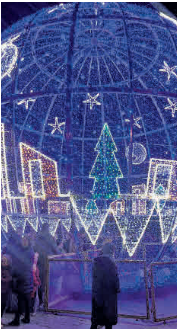
CARPA DE LA NAVIDAD: La carpa situada en la Plaza Mayor de Leganés alberga la inmensa mayoría de las actividades navideñas de la localidad. Habrá hinchables, un tren de las Tortugas Ninja y un Scalextric para los más pequeños. La plaza de la Fuente Honda cuenta con una esfera luminosa con espectáculo incluido. LEGANÉS >> Zona Centro | Hasta el 6 de enero