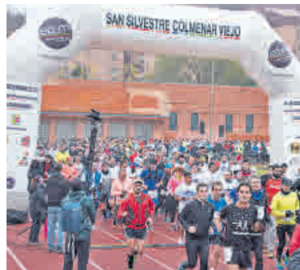
La San Silvestre de Colmenar llega a su V edición

Como era de esperar, la principal oferta se concentra el día 31. Colmenar Viejo, San Sebastián de los Reyes y Las Rozas serán las localidades más