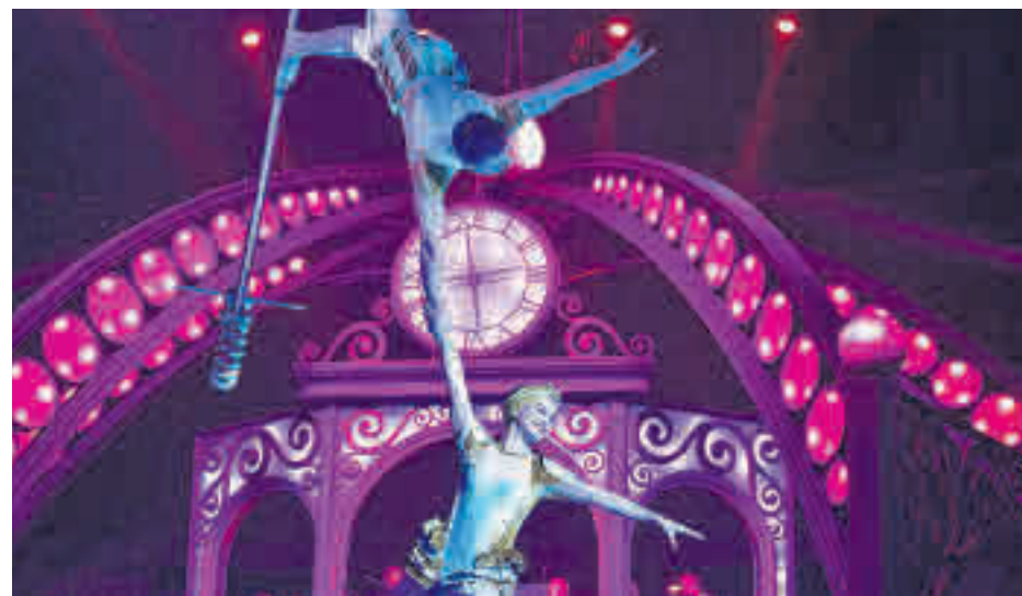
Un momento de la función en el escenario de Ronda de Atocha 35

En esta ocasión, a la estación donde vive el protagonista, Don Búho, llega un tren con los integrantes de un circo. Junto a sus fieles ayudantes ayudarán a esta insólita 'troupe' a comprender qué es lo más importante de la Navidad.