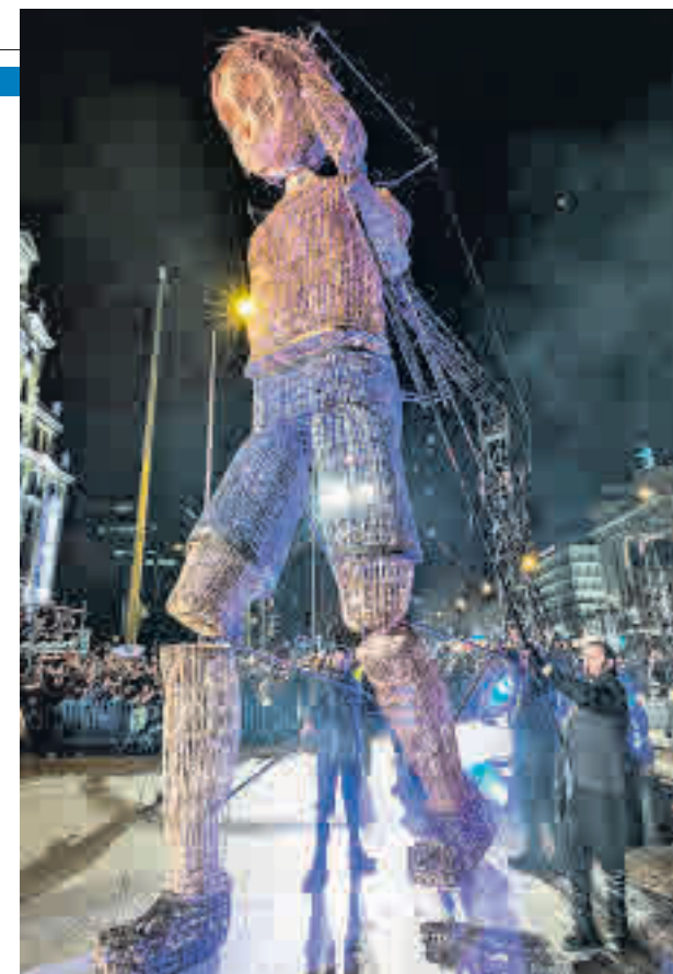
Una de las animaciones que salió a la calle el pasado enero

L a cabalgata de Reyes, el momento más mágico y más esperado por los niños y no tan niños, pondrá el colofón a una intensa programación de actividades para celebrar la Navidad en la capital. Fieles a su tradicional cita anual, Sus Majestades los Reyes Magos de Oriente llegarán a Madrid en la tarde noche del domingo 5 de enero para saludar personalmente a los miles de pequeños y pequeñas que les agasjarán en su recorrido por las calles de la ciudad. Todo antes de ponerse manos a la obra en la ingente tarea de entregar un sinfín de regalos en los hogares madrileños.