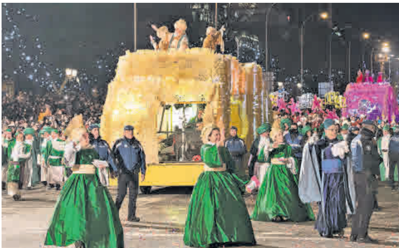
La carroza del Rey Melchor y su séquito, en su último recorrido por la capital