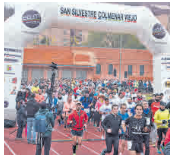
La San Silvestre de Colmenar llega a su V edición

Como era de esperar, la principal oferta se concentra el día 31. Colmenar Viejo, San Sebastián de los Reyes y Las Rozas serán las localidades más