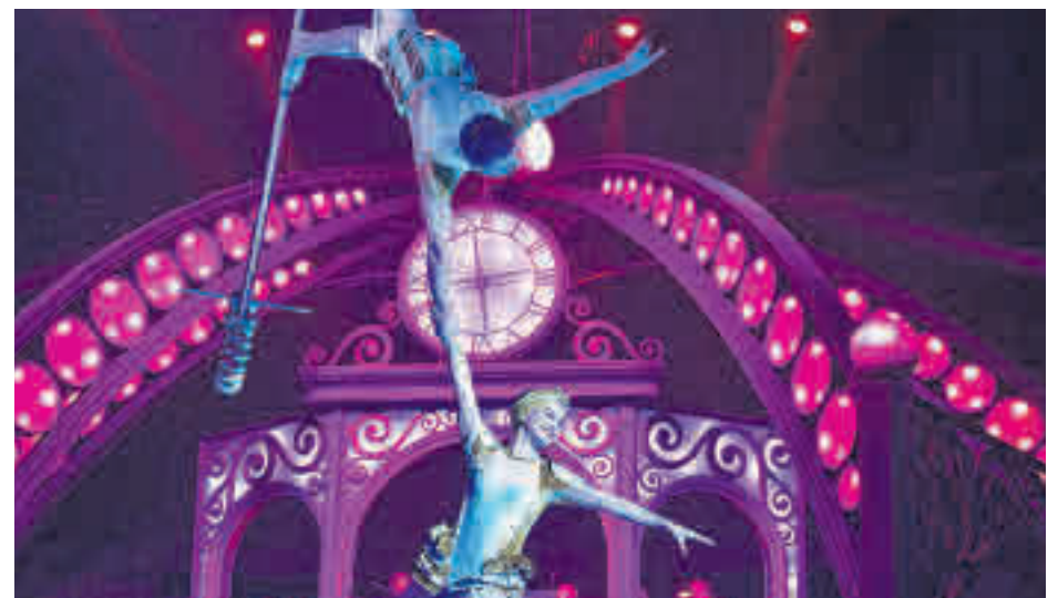
Un momento de la función en el escenario de Ronda de Atocha 35

En esta ocasión, a la estación donde vive el protagonista, Don Búho, llega un tren con los integrantes de un circo. Junto a sus fieles ayudantes ayudarán a esta insólita 'troupe' a comprender qué es lo más importante de la Navidad.