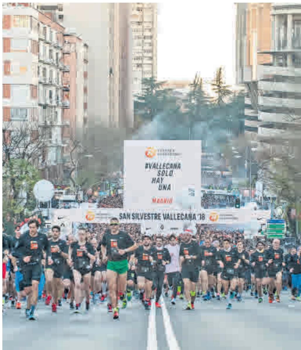
Imagen de la salida de la pasada edición en Concha Espina

EL COLORIDO DE LA PRUEBA POPULAR SIGUE TENIENDO UN GRAN ENCANTO