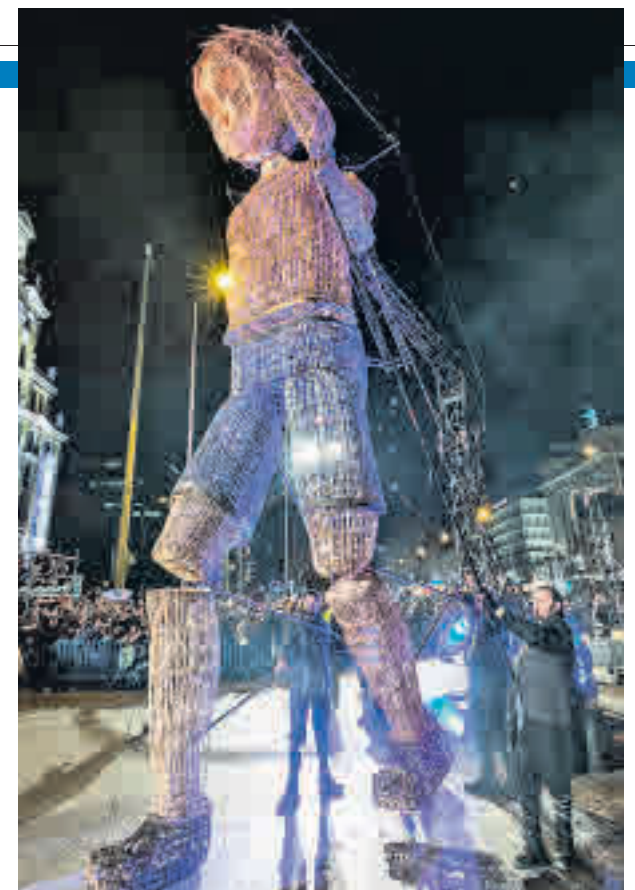
Una de las animaciones que salió a la calle el pasado enero

L a cabalgata de Reyes, el momento más mágico y más esperado por los niños y no tan niños, pondrá el colofón a una intensa programación de actividades para celebrar la Navidad en la capital. Fieles a su tradicional cita anual, Sus Majestades los Reyes Magos de Oriente llegarán a Madrid en la tarde noche del domingo 5 de enero para saludar personalmente a los miles de pequeños y pequeñas que les agasjarán en su recorrido por las calles de la ciudad. Todo antes de ponerse manos a la obra en la ingente tarea de entregar un sinfín de regalos en los hogares madrileños.