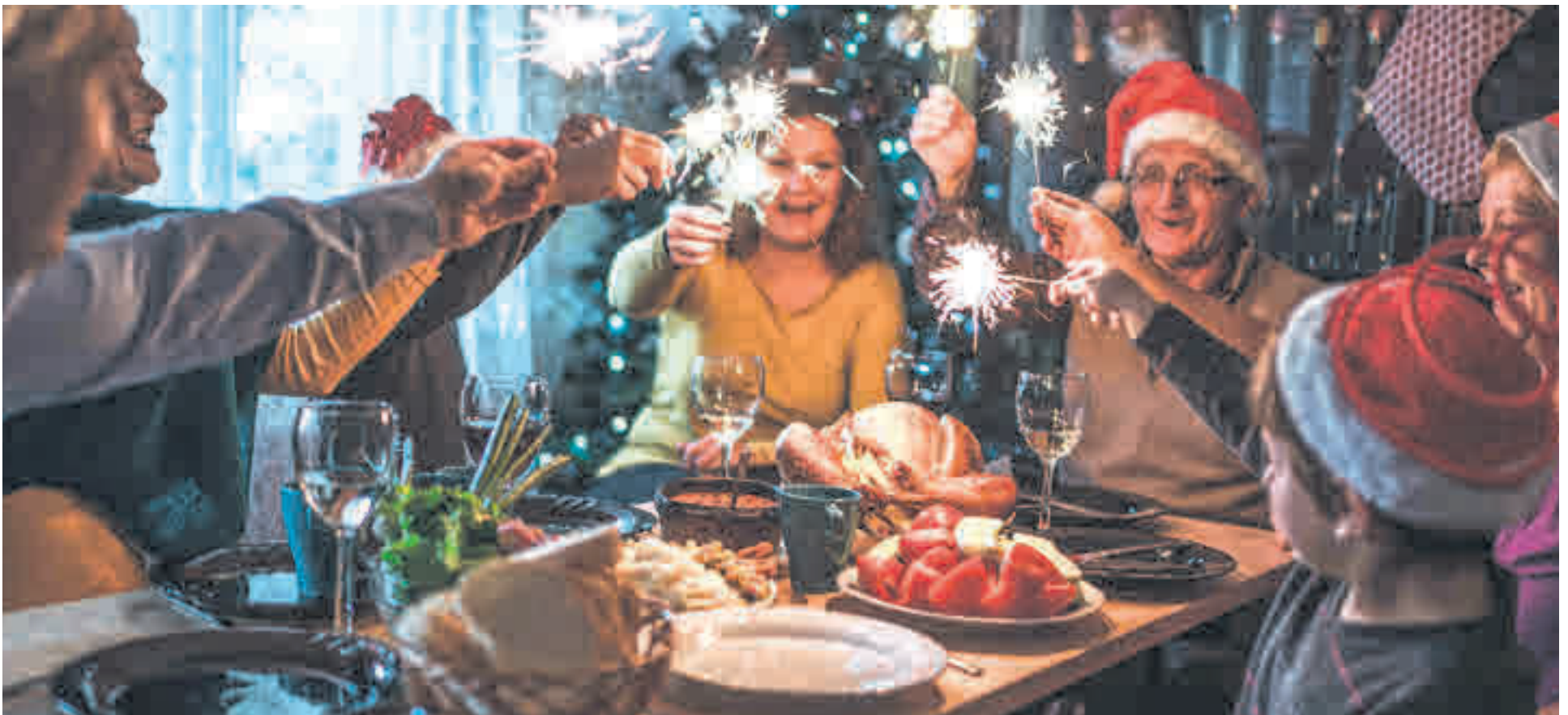
Las celebraciones en torno a mesa y mental son típicas de estas fiestas navideñas