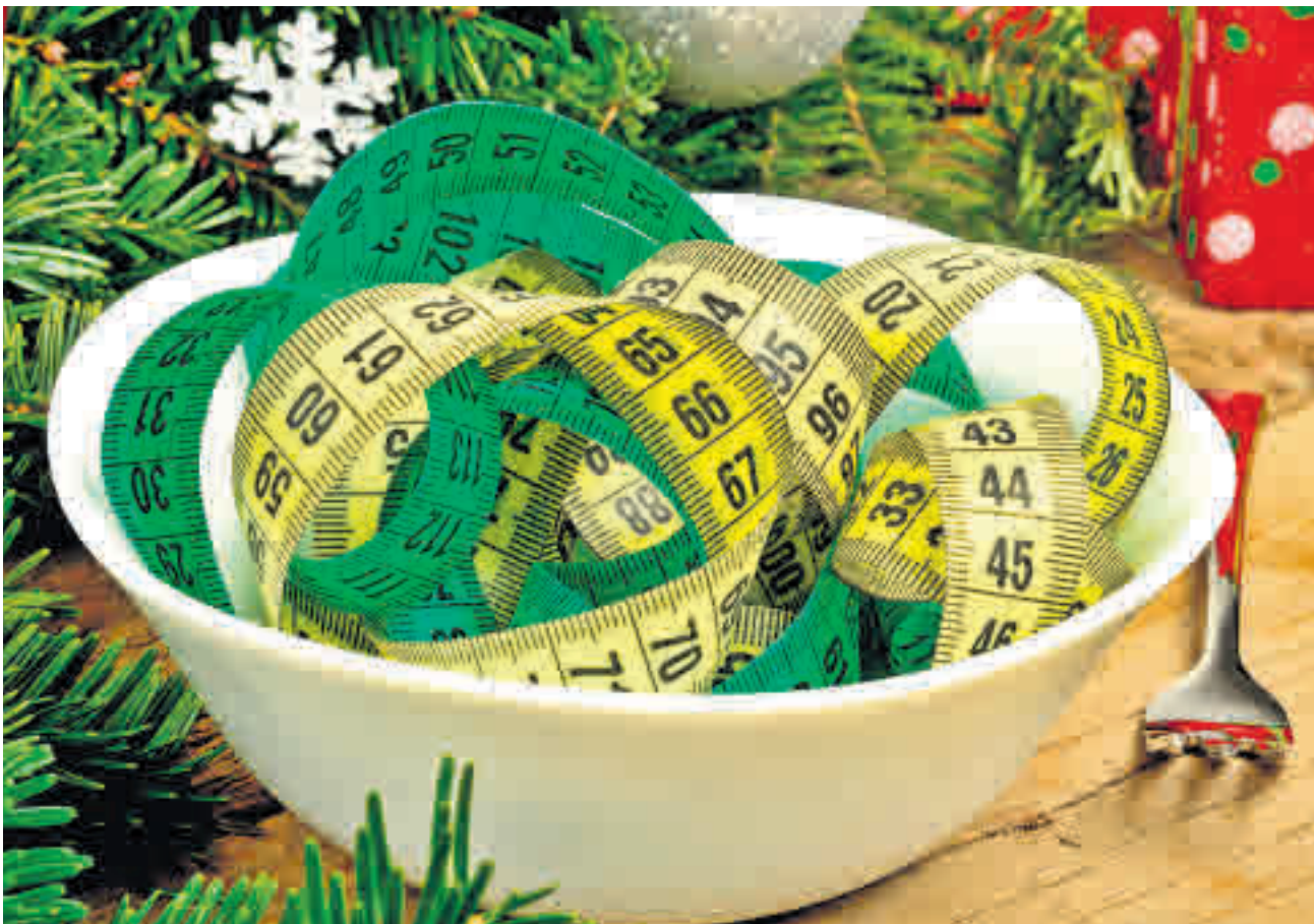
La Navidad no es una buena época para mantener la línea