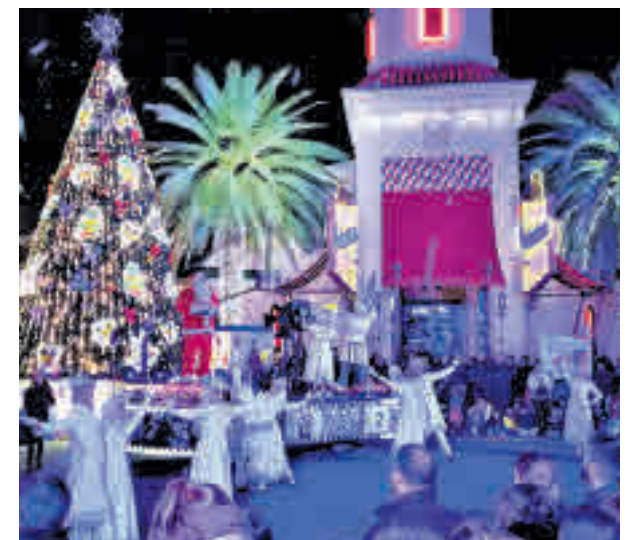
Espectáculo navideño en el Parque Warner

Justo antes del cierre, habrá un desfile navideño por las calles del Parque Warner con todos sus personajes.