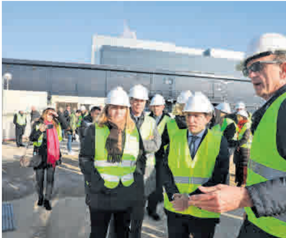
Un momento de la visita del primer edil al distrito hortelino

El sótano albergará el archivo y un vestuario para personal de servicio; la planta baja contará, entre otras dependencias, con el espacio