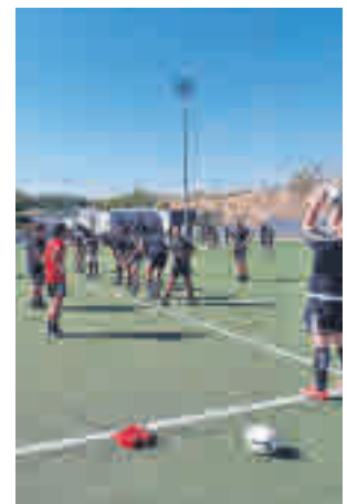
Los 'jabatos' viajan a Cáceres

Después de ese tropiezo, el Hortaleza afronta este fin de semana una nueva jornada liguera en la que le tocará actuar como visitante. Esta vez su rival será el Extremadura