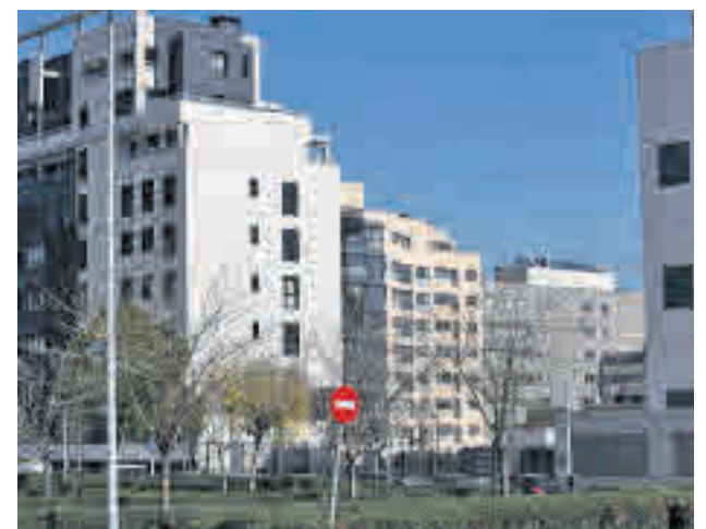
Una de las viviendas construidas por la empresa pública

El Consistorio de la capital asegura que el patrimonio inmobiliario actual de la EMVS es de 6.300 viviendas, de las que el 95% tienen ya un adjudicatario final.