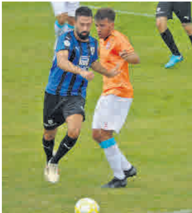
Nueva cita en el Vicente del Bosque

Después de muchas jornadas acechando el liderato del Navalcarnero, el Unión Adarve parece haberse metido en un bache de juego y resulta-