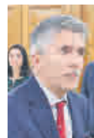
Fernando Grande Marlaska MINISTRO DE INTERIOR