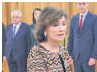
Carmen Calvo VICEPRESIDENTA PRIMERA. MINISTRA DE PRESIDENCIA Y RELACIONES CON LAS CORTES