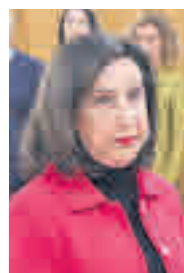
Margarita Robles MINISTRA DE DEFENSA