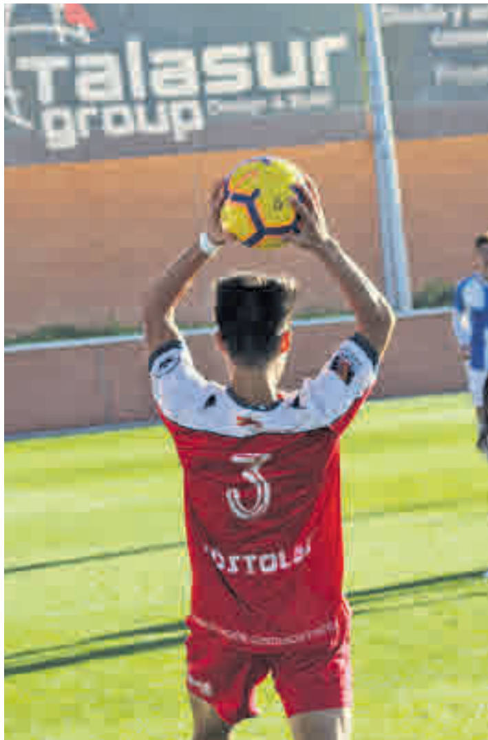
Borrón y cuenta nueva CD MÓSTOLES

Hasta tal punto era así que el cuadro del sur de Madrid