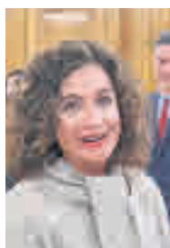
María Jesús Montero PORTAVOZ DEL GOBIERNO Y M º DE HACIENDA