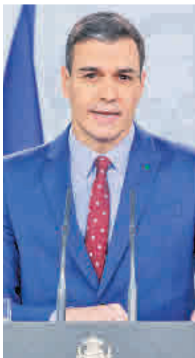
Pedro Sánchez PRESIDENTE DEL GOBIERNO