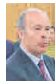
Juan Carlos Campo Moreno MINISTRO DE JUSTICIA