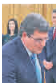
José Luis Escrivá Belmonte M º SEGURIDAD SOCIAL, INCLUSIÓN Y MIGRACIONES