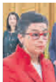
Arancha González Laya M º DE ASUNTOS EXTERIORES, UE Y COOPERACIÓN