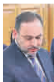
José Luis Ábalos MINISTRO DE TRANSPORTES, MOVILIDAD Y AGENDA URBANA