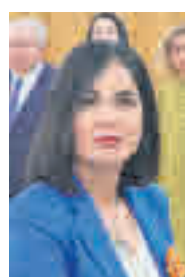
Carolina Darias MINISTRA DE POLÍTICA TERRITORIAL Y FUNCIÓN PÚBLICA