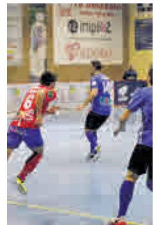
Llega el Rivas Futsal

El contrario es ahora mismo el último clasificado con tal solo seis puntos, ocho por debajo de sus más inmediatos predecesores, y únicamente le ha ganado al Bisontes Castellón el pasado mes de noviembre por 3-1.