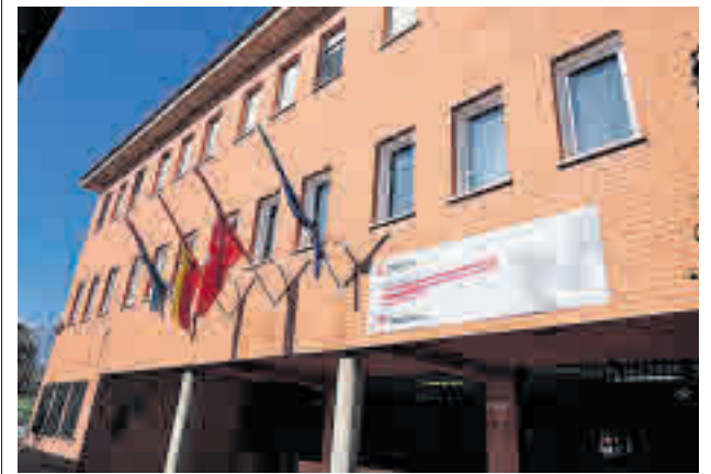
Fachada de Móstoles Desarrollo

Estos trabajos, enmarcados dentro de un plan de inversiones para mejorar las instalaciones deportivas municipales, se suman a la ampliación de los accesos del espacio deportivo, que se llevó a cabo en el último año con el objetivo de facilitar la movilidad de los tenistas en silla de ruedas, nivelando y solventando problemas.