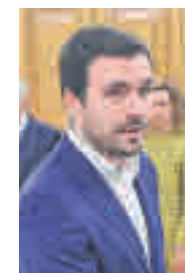
Alberto Garzón MINISTRO DE CONSUMO