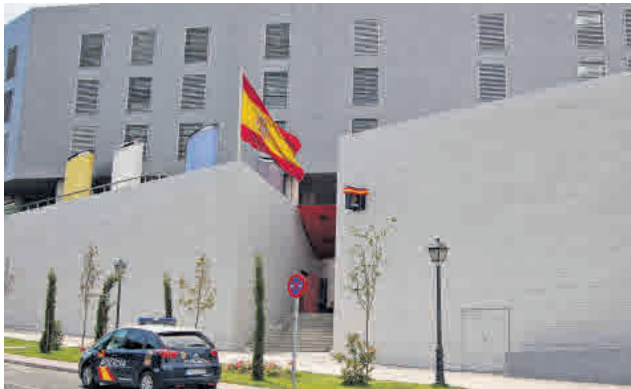
Fachada de la Comisaría de Móstoles

Una anciana también fue la víctima en otro suceso ocurrido el pasado 7 de enero, en este caso por declararse un incendio en su vivienda situada en el sexto piso de un edificio de la avenida de la ONU. Se encontró a la mujer inconsciente, con quemaduras en la parte anterior de su cuerpo. Fue trasladada hasta el Hospital de Getafe en estado muy grave.