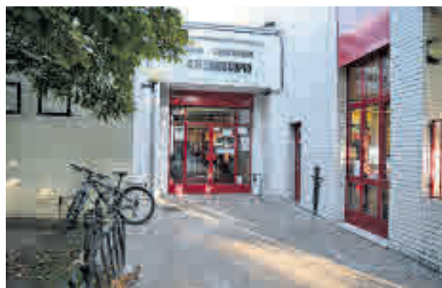
Centro Sociocultural Caleidoscopio

Según han argumentado, estaba previsto que las reformas estructurales, ya adjudicadas, “se llevasen a cabo entre 2008 y 2011”, pero “hoy ni siquiera se han iniciado”. Por