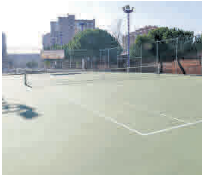
Una de las pistas que están siendo arregladas

El Ayuntamiento de Móstoles está ultimando las obras de remodelación y reparación de varias zonas del Polideportivo Municipal de Villafontana. Una vez concluida la actuación, que arrancó en octubre y que cuenta con una inversión de 292.669 euros, se habrá arreglado el pavimento de las ocho pistas de tenis que tiene el centro, hechas con base de hormigón poroso, que se encontraban "muy deterioradas" y presentaban grandes fisuras. A esto