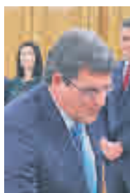
José Luis Escrivá Belmonte Mº SEGURIDAD SOCIAL, INCLUSIÓN Y MIGRACIONES