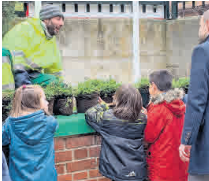
Visita del alcalde al colegio El Tejar

El Ayuntamiento prepara un plan para los ocho colegios públicos y las escuelas infantiles • La primera fase comienza este mes con las mejoras más urgentes en las cubiertas