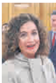
María Jesús Montero PORTAVOZ DEL GOBIERNO Y Mª DE HACIENDA