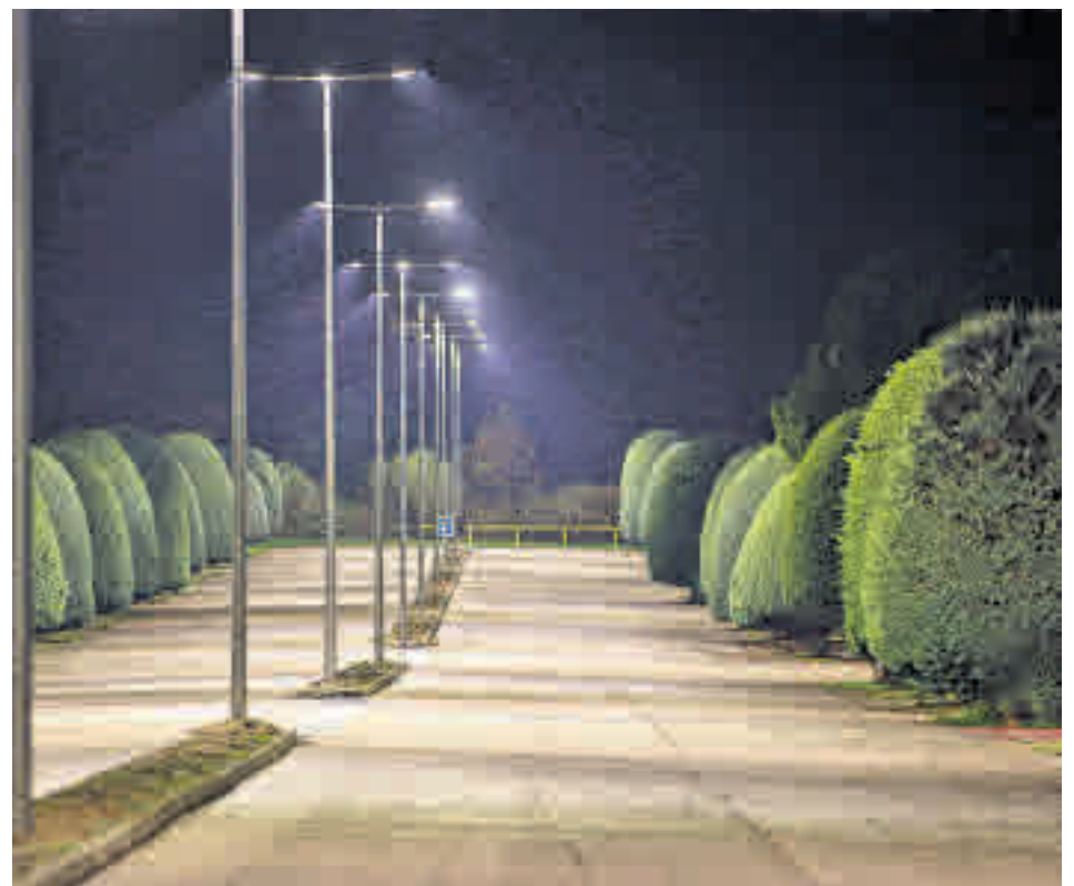
Toda la luminación será eficiente

Las obras del nuevo polideportivo y zona cultural en La Marazuela podrían comen-