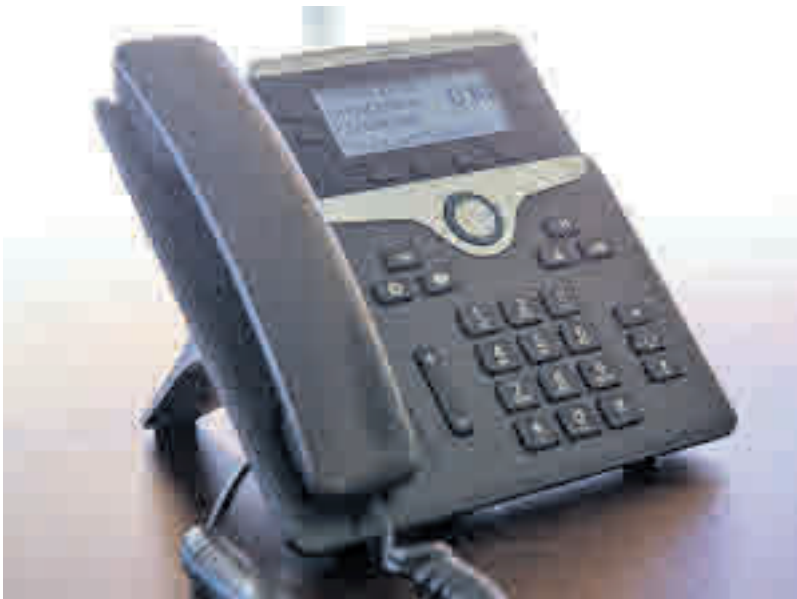
Un nuevo número telefónico para los vecinos