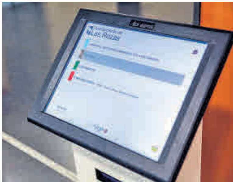
Habrá más gestiones telemáticas