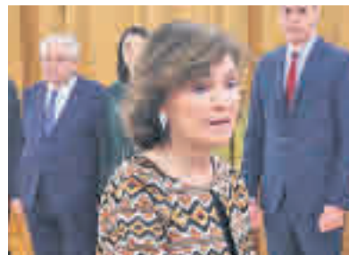
Carmen Calvo VICEPRESIDENTA PRIMERA. MINISTRA DE PRESIDENCIA Y RELACIONES CON LAS CORTES