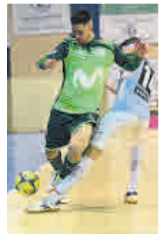
El Talavera dio la sorpresa

Tras ese golpe moral, el Movistar Inter tiene este sába-