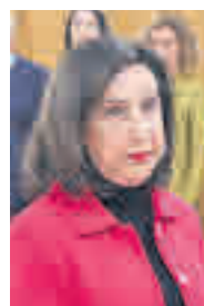
Margarita Robles MINISTRA DE DEFENSA