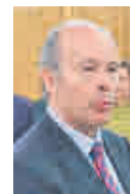
Juan Carlos Campo Moreno MINISTRO DE JUSTICIA