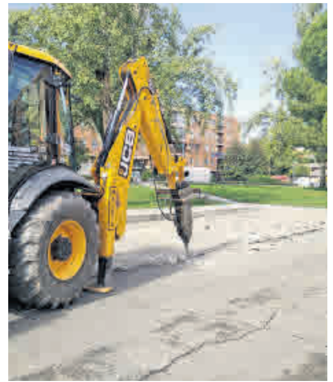
Se trabajará en el asfaltado de numerosas zonas