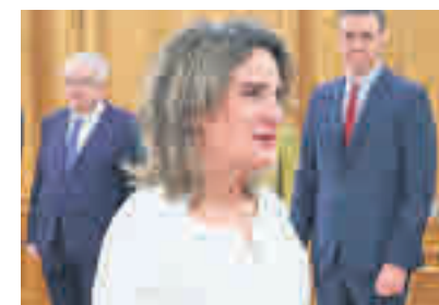
Teresa Ribera VICEPRESIDENCIA DE TRANSICIÓN ECOLÓGICA Y EL RETO DEMOGRÁFICO