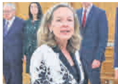
Nadia Calviño VICEPRESIDENCIA DE ASUNTOS ECONÓMICOS Y TRANSFORMACIÓN DIGITAL