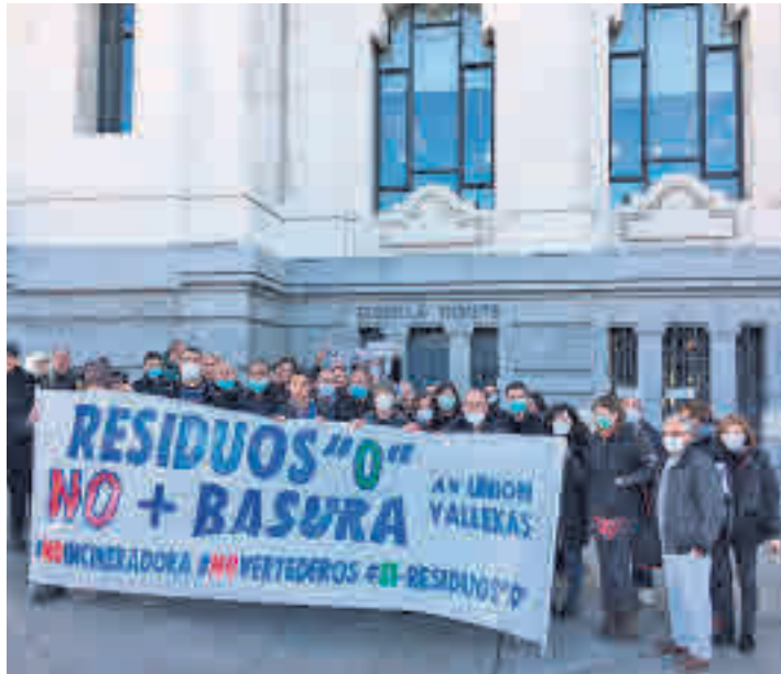
Las asociaciones de vecinos han pedido el cese ASOCIACIÓN VECINOS LA UNIÓN

La recogida y posterior traslado de la basura que gestiona la Mancomunidad del Este sigue levantando recelos. El pasado viernes 10 de enero el Pleno del Ayuntamiento de Madrid, con el apoyo de Ciudadanos, ratificó por tercera vez la negativa a que Valdeingómez reciba las 220.000 toneladas de residuos procedentes de los 31 municipios que forman parte de esta agrupación. En este sentido, el delegado de Medio Ambiente y Movilidad, Borja Ca-