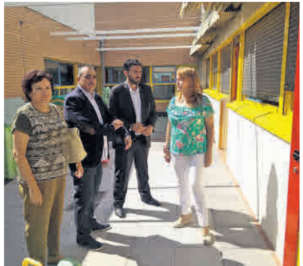
La inversión en los centros educativos será notable

Tendrá continuidad de manera periódica a lo largo de la presente legislatura a fin de llegar al mayor número de calles y vías públicas de la ciudad, incluidas entre ellas zonas industriales y barrios como Parque Henares y Fuencasa.