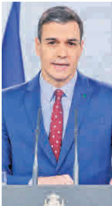
Pedro Sánchez PRESIDENTE DEL GOBIERNO