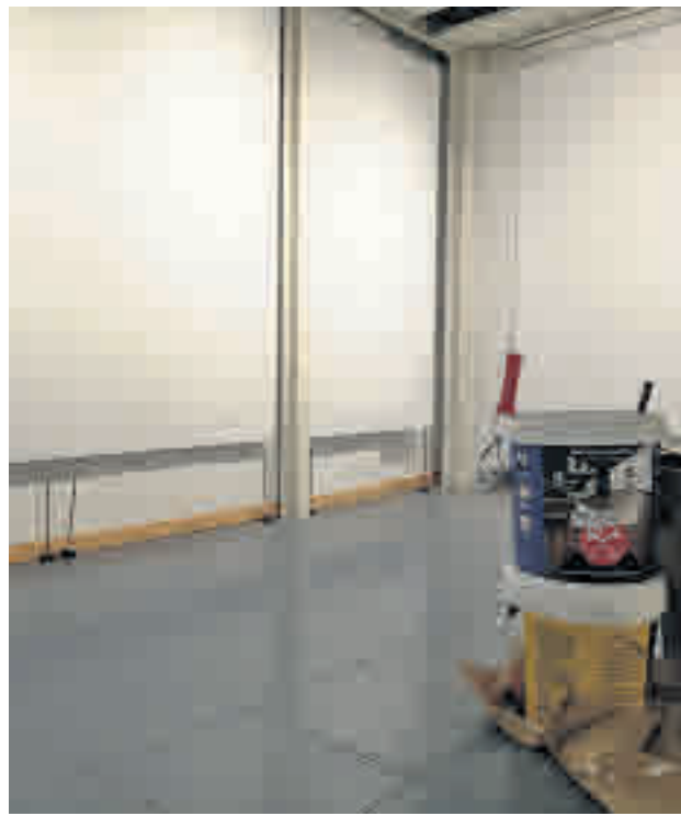
Obras en las dotaciones