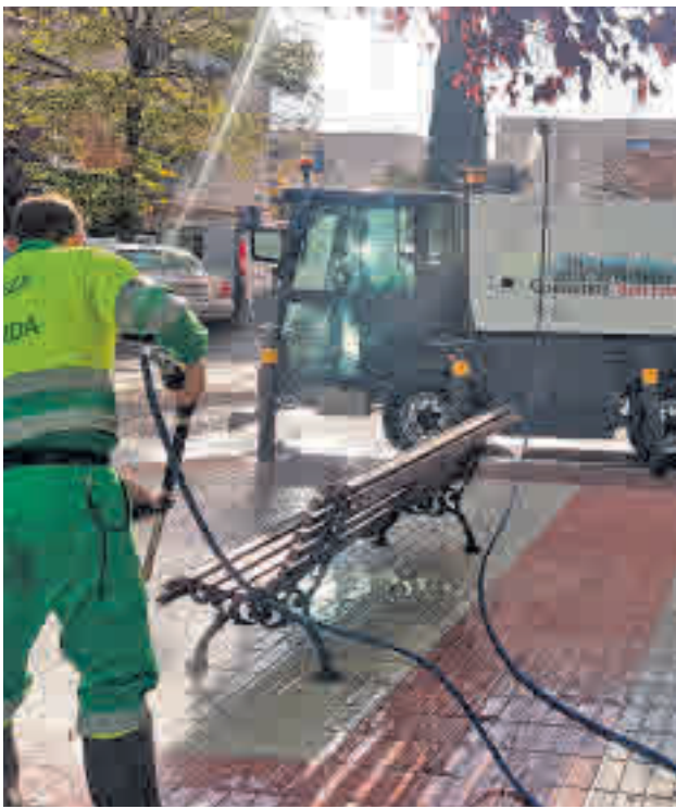
Operarios de los servicios de limpieza