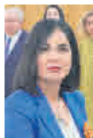
Carolina Darias MINISTRA DE POLÍTICA TERRITORIAL Y FUNCIÓN PÚBLICA