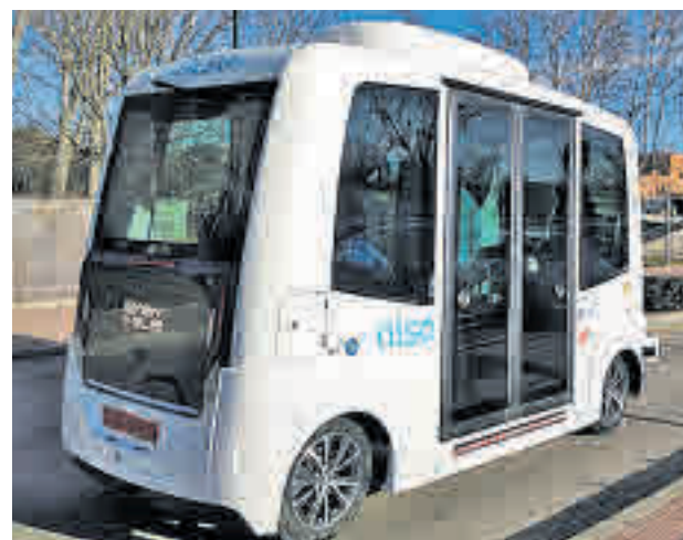
Bus autónomo de la Universidad Autónoma

Aguado se refirió también a la celebración de Fitur, que comenzará el próximo 23 de enero, señalando que se buscarán las alternativas "más viables y más útiles" para que no se vea afectada la actividad de la feria.