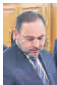
José Luis Ábalos MINISTRO DE TRANSPORTES, MOVILIDAD Y AGENDA URBANA