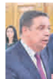
Luis Planas MINISTRO DE AGRICULTURA, PESCA Y ALIMENTACIÓN