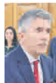
Fernando Grande Marlaska MINISTRO DE INTERIOR