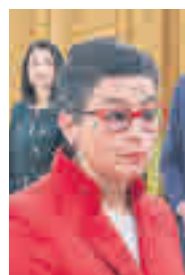
Arancha González Laya Mª DE ASUNTOS EXTERIORES, UE Y COOPERACIÓN