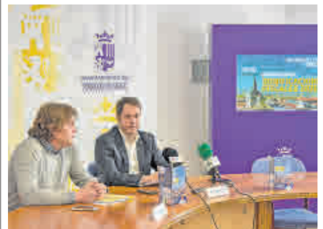
El Gobierno seguirá apoyando a las familias más necesitadas

Así, ante la razonable duda de que el Ayuntamiento madrileño esté actuando saltándose la actual normativa en materia de medio ambiente, la Federación Regional de Asociaciones Vecinales de Madrid ha solicitado mediante un escrito en el registro municipal el cese inmediato de esta recogida.