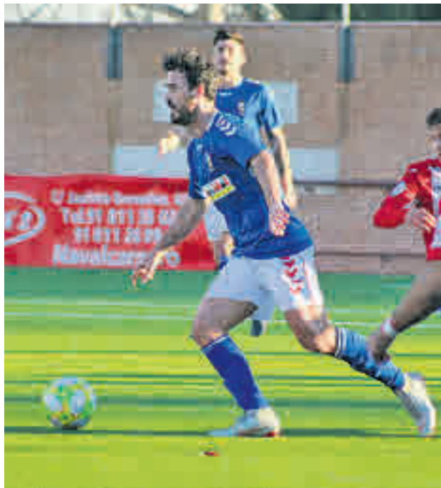
El Alcalá dio la sorpresa ganando en Navalcarnero al líder

La incertidumbre que acompañó a la RSD Alcalá en el tramo inicial del campeonato parece haber pasado a la historia, dejando hueco para