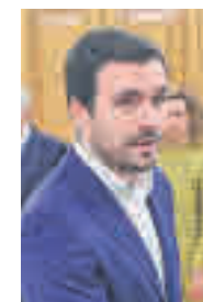
Alberto Garzón MINISTRO DE CONSUMO