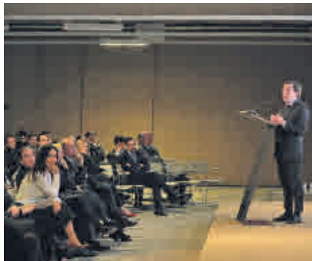
Presentación: "Queremos que este espacio significativo se convierta en un ágora, en un punto de encuentro, que será el comienzo de la transformación que queremos hacer en Madrid", resaltó el alcalde de la capital, José Luis Martínez-Almeida.