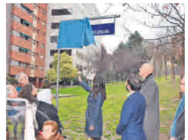
Villacís descubrió la placa con la nueva denominación

Recientemente se ha instalado un sistema de telegestión de la red de riego que fomenta el ahorro y la eficiencia en el uso de agua, además de reducir los costes de mantenimiento y que se corta en condiciones meteorológicas adversas.