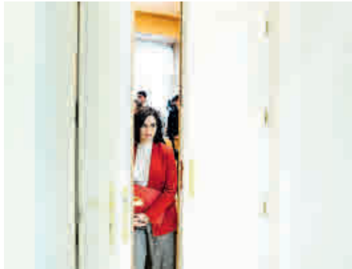
Isabel Díaz Ayuso, tras el Consejo de Gobierno

La presidenta de la Comunidad de Madrid, Isabel Díaz Ayuso, rechazó esta semana el 'pin parental' propuesto por Vox porque considera que es "innecesario", dado que en la autonomía "no se adoctrina a los niños". "No está en el acuerdo de investidura con el que se creó este Gobierno. Nosotros vamos a cumplir lo que hemos acordado. Los problemas de la educación no están en eso. No están por aquí", señaló tras la reunión de su Ejecutivo.