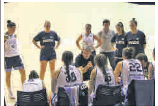
Cita de altura en el Circular

Por su parte, los franjirrojos son duodécimos y no pueden ceder más terreno respecto a la sexta posición, ahora en poder de un Numancia que cuenta en su casillero con cuatro puntos más.