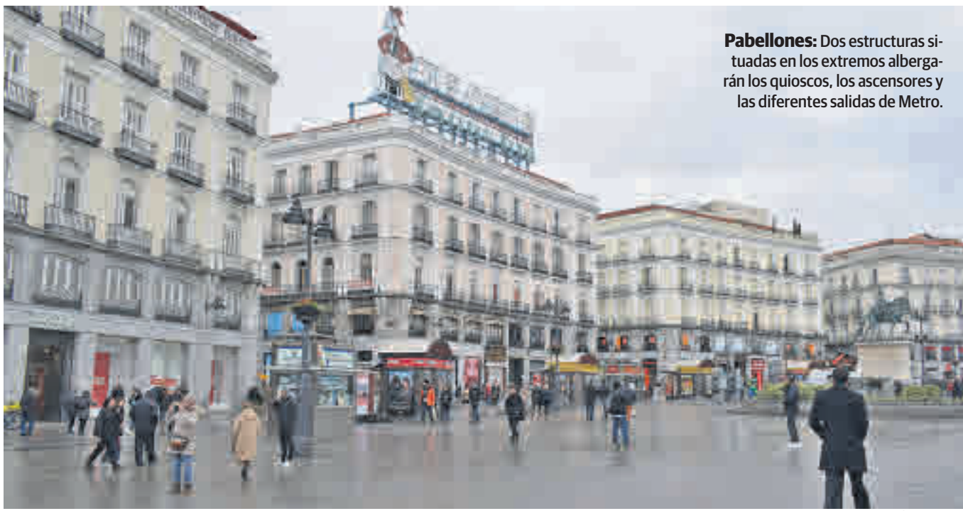
Pabellones: Dos estructuras situadas en los extremos albergarán los quioscos, los ascensores y las diferentes salidas de Metro.

tu de la actuación de Lucio del Valle del siglo XIX, es decir, reagrupar y despejar el espacio y poner "orden" retirando elementos "antiestéticos".