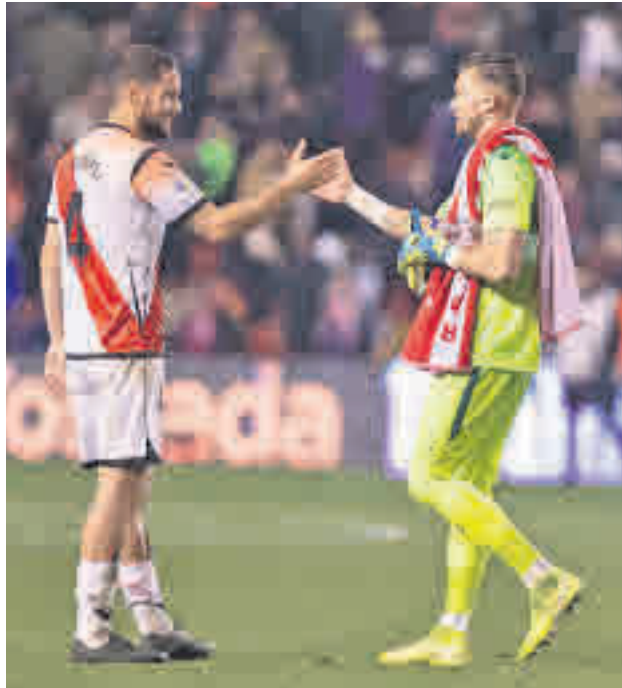
El último partido en Vallecas acabó 1-0 frente al Lugo

El Rayo regresa a la Liga para recibir al penúltimo de la tabla ● El futuro de Embarba, en el aire