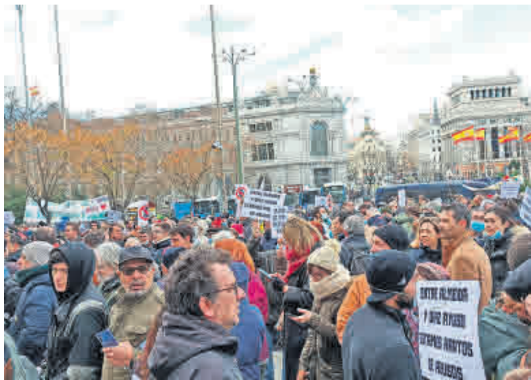
La protesta vecinal a las puertas de Cibeles del pasado 19 de enero

El Ayuntamiento de Madrid no contempla, de momento, esta posibilidad, pero avisa ya por si la Justicia le obliga a dar marcha atrás. El alcalde, José Luis Martínez-Almeida, asegura que los desperdicios de Arganda del Rey