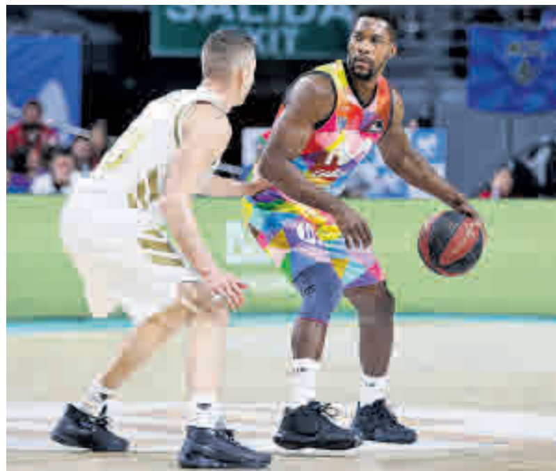
Una de las propuestas habituales: Desde hace varias temporadas, tanto el Real Madrid como el Movistar Estudiantes fijaron su sede como locales en el WiZink Center. Esto asegura un mínimo de 34 encuentros por temporada de la Liga Endesa y otros 15 de la Euroliga, sin contar con algunas ediciones de la Copa del Rey.

Ese volumen de venta de entradas se traduce en una jugosa facturación: se encuentra en tercera posición mundial