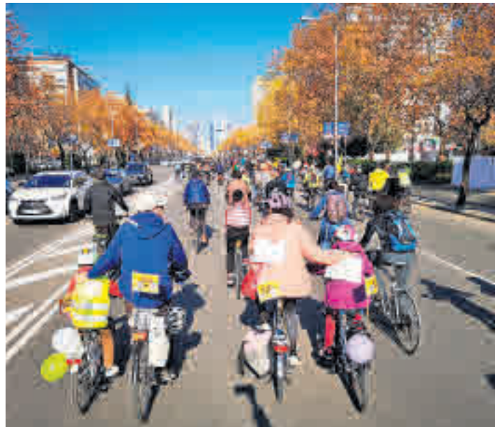
La 'bicicletada' de la Cumbre del Clima del pasado mes de diciembre

Las obras podrían comenzar en el segundo semestre ● Ya se ha iniciado el estudio de movilidad y de calidad del aire ● La adjudicación del proyecto se producirá a finales de 2020