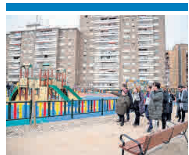
Las autoridades municipales visitaron la zona

El proyecto se encuentra en su fase final, dado que Sol ya analiza el expediente completo de cara a su aprobación definitiva, para lo cual tiene de plazo hasta marzo.