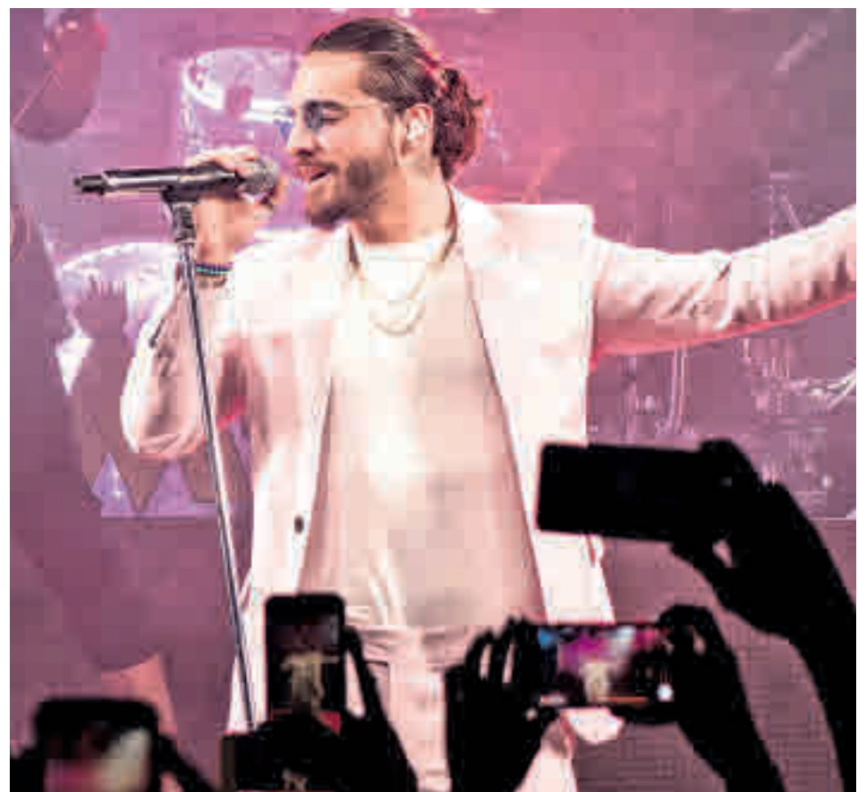
El colombiano Maluma pisará la capital el 29 de marzo