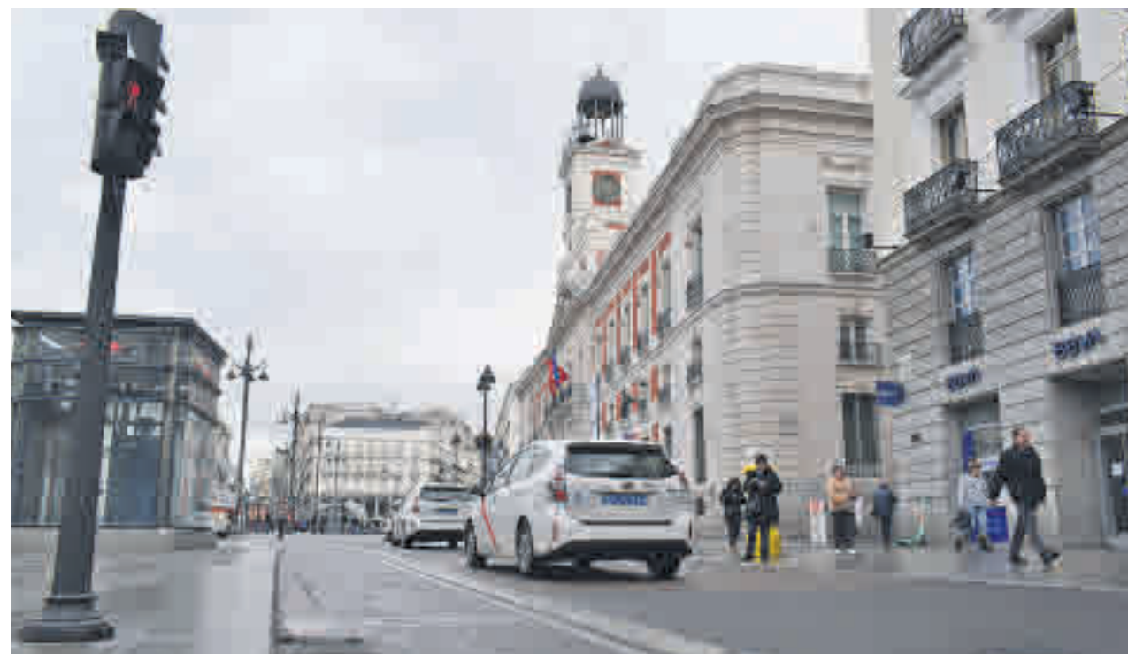
CHEMA MARTÍNEZ/ GENTE

La previsión de Cibeles es que los trabajos comiencen en el segundo semestre del año • Ya se ha iniciado el estudio de movilidad y de calidad del aire