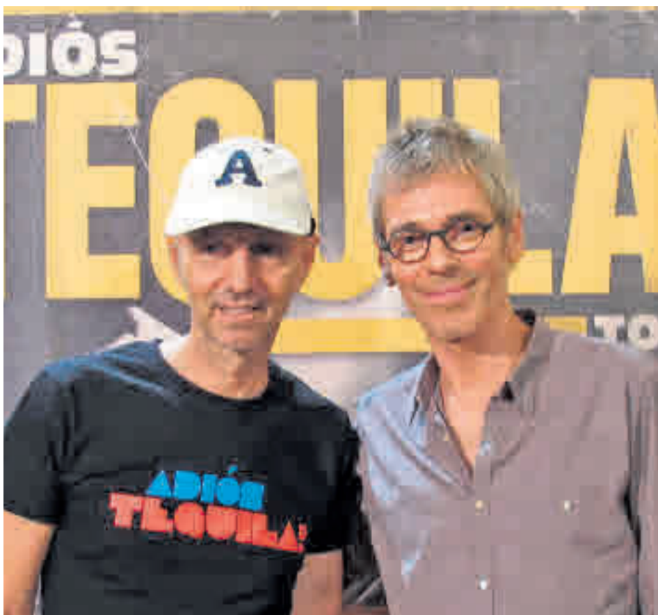
Los veteranos Tequila han incluido Madrid en su gira de despedida