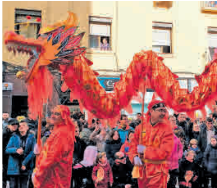
El desfile del año pasado

El Gran Pasacalles Multicultural recorrerá las calles de Marcelo Usera, Dolores Barranco y Rafaela Ybarra este domingo 26 de enero a las 11 horas ● Se cumplen 10 años de las celebraciones