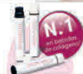
¿Conoce ya este truco de belleza? Beber en lugar de usar cremas

en la mayoría de los casos poco o nada, ya que sus moléculas de colágeno a menudo son demasiado grandes para llegar desde el exterior hasta el interior de la piel. Sin embargo, expertos dermatológicos han logrado dividir las moléculas de colágeno de tal forma que el cuerpo las puede absorber bien desde el interior.