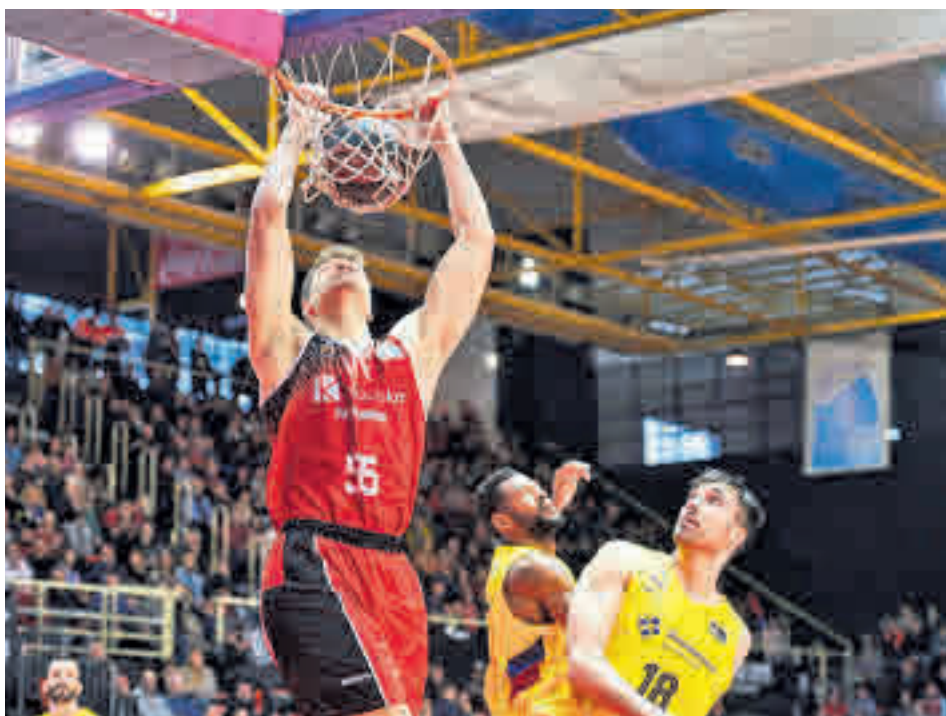
El Montakit Fuenlabrada se la juega