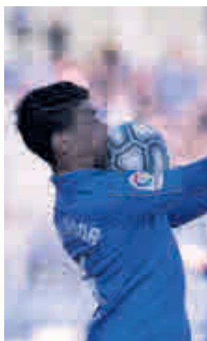
Racha de empates

que sigue firmando una excelente temporada durante su debut en la categoría de plata del fútbol español pero que últimamente ha perdido un