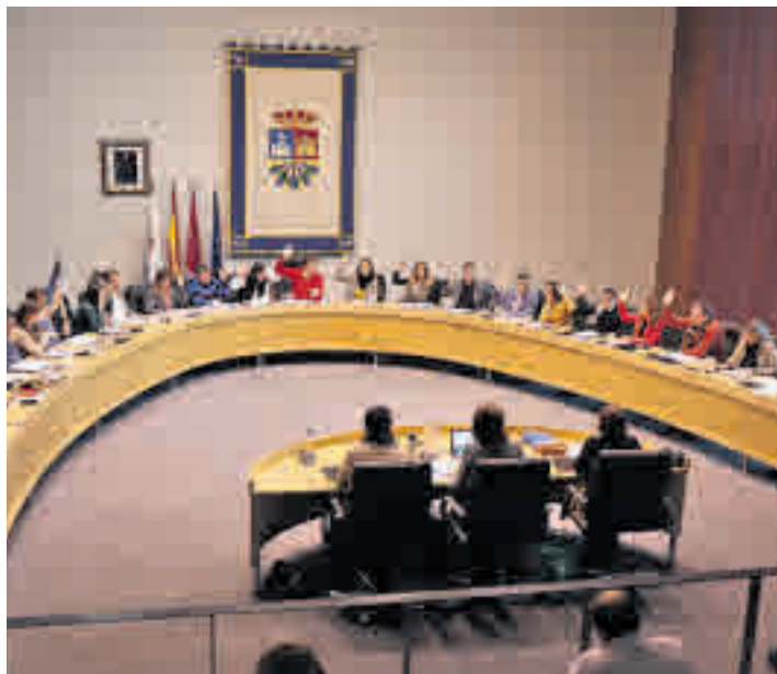
Pleno Extraordinario celebrado este pasado martes 21 de enero

Los vecinos de Fuenlabrada están de enhorabuena. El municipio recibirá en 2020 un total de 23 millones de euros en inversiones sostenibles, un 27% más que en 2019. Según las cuentas, un total de 15,3 millones se destinarán al desarrollo de proyectos estratégicos. Entre ellos está la construcción del Pulmón Verde de la ciudad (un gran parque que incluirá el nuevo recinto ferial) con 5 millones y la regeneración urbana del Distrito Centro con diferentes