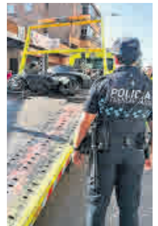
Se retiraron 106 coches

Del total de coches incautados, 73 estaban en las vías públicas urbanas y 33 en áreas industriales. La efectividad progresiva de esta campaña, además de constatar la conciencia cívica, contribuye al mantenimiento y conservación del medio ambiente, ya que estos autos son considerados como residuos sólidos, y permiten que exis-