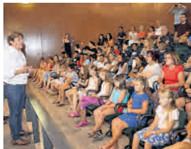
Este plan se incluye dentro de los presupuestos municipales

Este programa se suma a las ayudas existente en la locali-