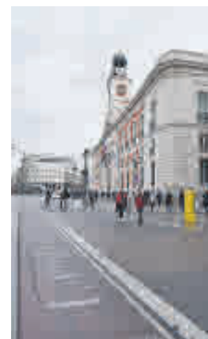
Puerta del Sol

En cualquier caso, el diseño definitivo de la nueva Puerta del Sol será objeto de una posterior elaboración en