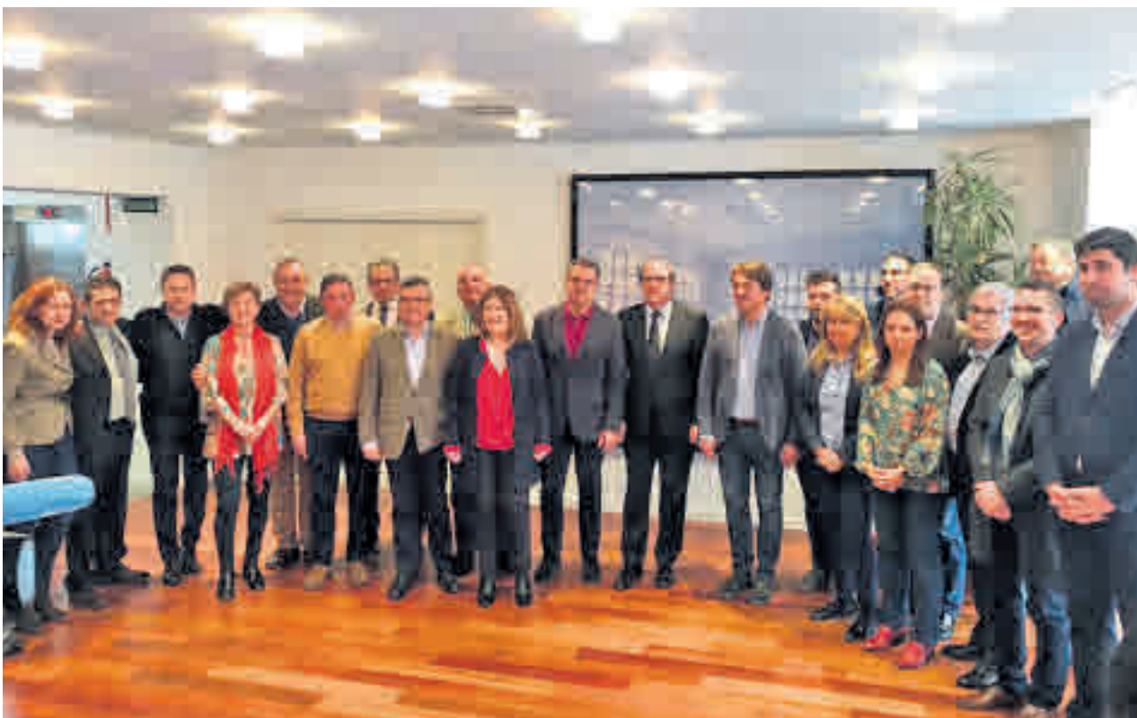
Reunión de los alcaldes socialistas del sur en Alcorcón