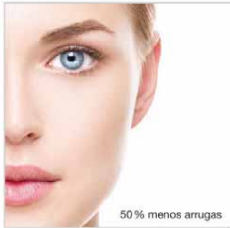
50% menos arrugas

Es el sueño de toda mujer: una piel firme y bella, sin arrugas ni celulitis. Es algo que fortalece la autoestima y hace sentirse guapa y atractiva. Una exclusiva bebida de colágeno (Signasol, disponible en farmacias) puede reafirmar la piel y volverla radiante desde el interior.