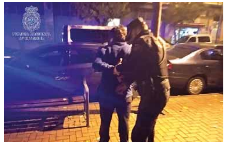
Los dos arrestados cuentan con un amplio historial delictivo.

CON ANTECEDENTES | Al menor le constan 11 arrestos