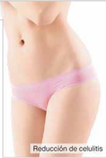
Reducción de celulitis

Con la edad, la piel produce menos colágeno y pierde su elasticidad. Las cremas de colágeno ayudan en la mayoría de los casos poco o nada, ya que sus moléculas de colágeno a menudo son demasiado grandes para llegar desde el exterior hasta el interior de la piel. Sin embargo, expertos dermatológicos han logrado dividir las moléculas de colágeno