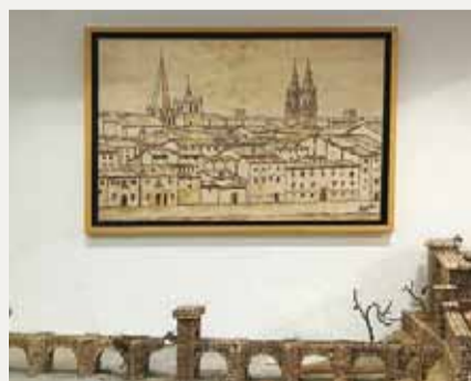
Mi cuadro en la Vermeer.