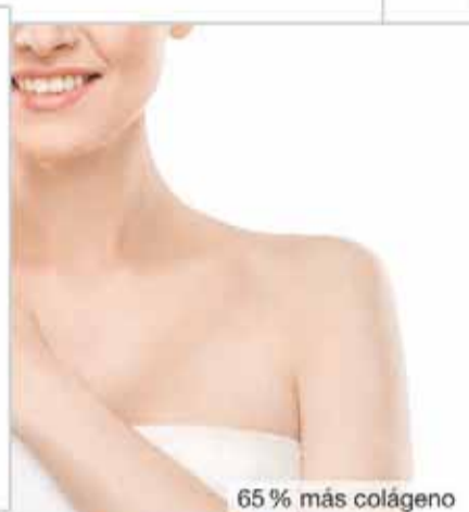
65% más colágeno