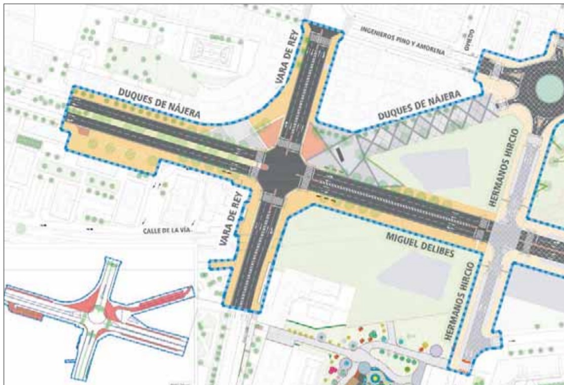
Proyecto planteado por el equipo de Gobierno municipal para actuar sobre el conocido como 'Nudo de Vara de Rey'.

El cruce, según el concejal de Desarrollo Urbano, ofrecerá más ventajas ya que "aumenta la superficie de espacio público disponible para las personas y acorta los recorridos peatonales". Y recordó que esta solución ya está funcionando en el cruce de Vara