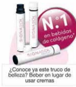
¿Conoce ya este truco de belleza? Beber en lugar de usar cremas

Con la edad, la piel produce menos colágeno y pierde su elasticidad. Las cremas de colágeno ayudan en la mayoría de los casos poco o nada, ya que sus moléculas de colágeno a menudo son demasiado grandes para llegar desde el exterior hasta el interior de la piel. Sin embargo, expertos dermatológicos han logrado dividir las moléculas de colágeno