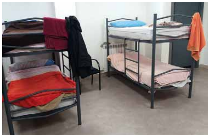
Logroño dispone de 75 plazas para alojar a personas sin hogar en los meses más fríos.