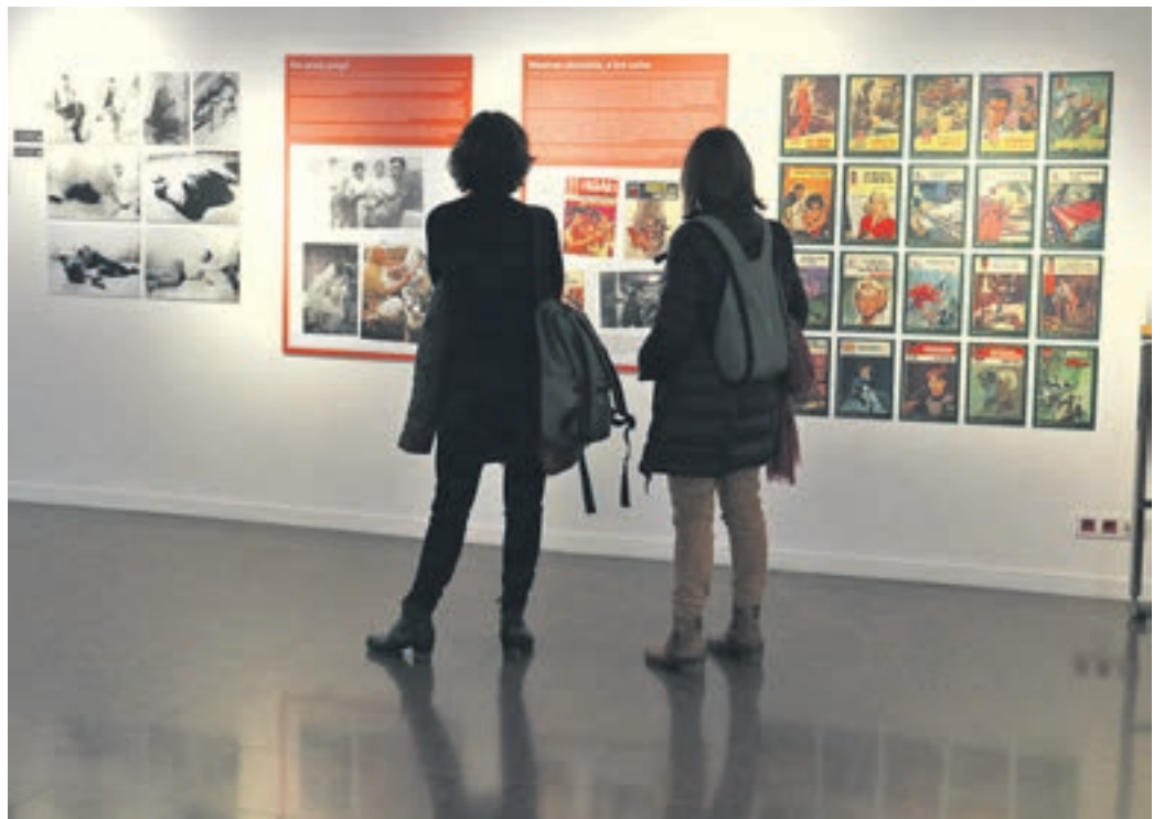
El programa compta amb 60 activitats i 35 taules rodones.

James Crumley, amb un expert del gènere, Benoit Tadié i el personatge de ficció Maigret. També es projectarà la pel·lícula 'Las marismas', de Baltasar Kormákur, un dels films més exitosos del cinema al país.