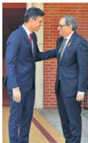
El presidente Sánchez

Ese pacto establecía que este foro de reunión para buscar una solución al "conflicto