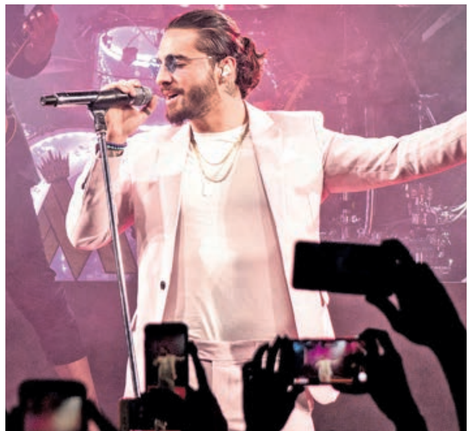
El colombiano Maluma pisará la capital el 29 de marzo