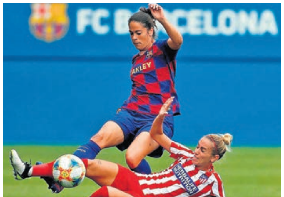
En la ida el Barça ya dio muestras de su poderío (6-1)

Además, el azar ha querido que si las rojiblancas quieren llevar algún título este curso a sus vitrinas tengan que verse las caras en repetidas ocasiones con el poderoso Barcelona. Los cuartos de final de la Champions League depararon un doble enfrentamiento (ida el 25 de marzo en Madrid y la vuelta el 1 de abril en la ciudad condal) entre ambos conjuntos, mientras que las semifinales de la Supercopa de España, que tendrá como sede a Salamanca, se disputarán el 6 de febrero en el estadio Helmántico de la localidad charra.