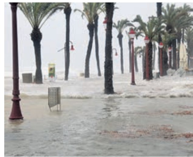
Es parla ja d'un temporal sense precedents.

La soprano Ainhoa Arteta empieza un año con grandes proyectos, entre otros, una actuación en Torre del Lago