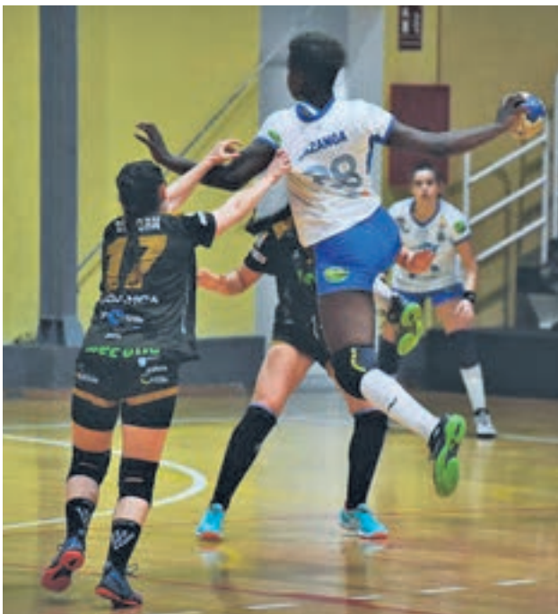
El Guardés se examina ante el líder