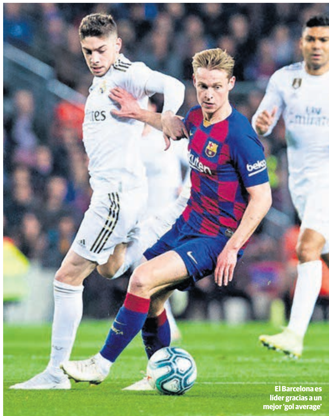
El Barcelona es líder gracias a un mejor 'gol average'

cado territorio cuando apenas acaba de arrancar la segunda vuelta del torneo de la regularidad. Por ejemplo, de los cuatro conjuntos que viajaron a Arabia Saudí para disputar la Supercopa de España, solo Barça y Real Madrid