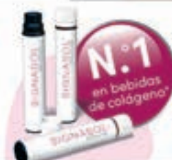
¿Conoce ya este truco de belleza? Beber en lugar de usar cremas

en la mayoría de los casos poco o nada, ya que sus moléculas de colágeno a menudo son demasiado grandes para llegar desde el exterior hasta el interior de la piel. Sin embargo, expertos dermatológicos han logrado dividir las moléculas de colágeno de tal forma que el cuerpo las puede absorber bien desde el interior.