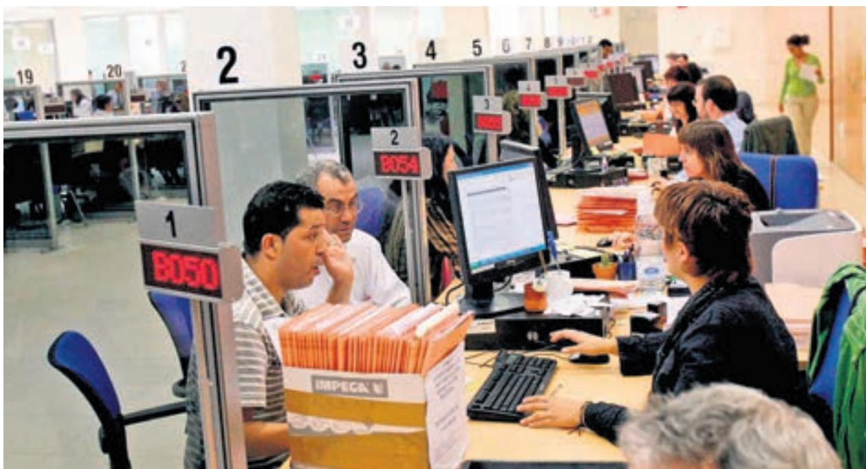
La mejora de las retribuciones podría alcanzar hasta el 3,85% en función del crecimiento económico