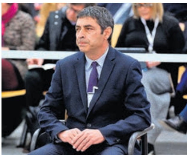
El exmayor de los Mossos, José Luis Trapero