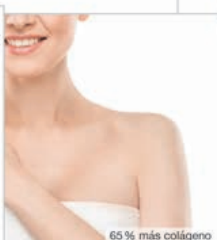
65 % más colágeno