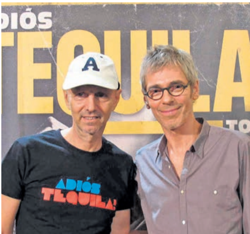
Los veteranos Tequila han incluido Madrid en su gira de despedida