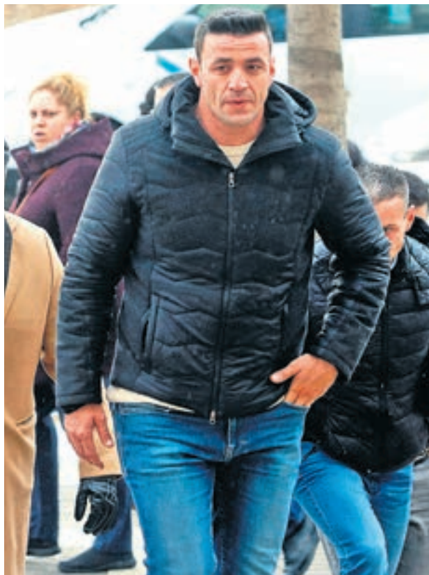
Las dos partes se entendieron antes de celebrarse el juicio

Asimismo, se confirmó el pago de una indemnización de 89.500 euros para cada uno de los padres de Julen, de los que 25.000 ya se han abo-