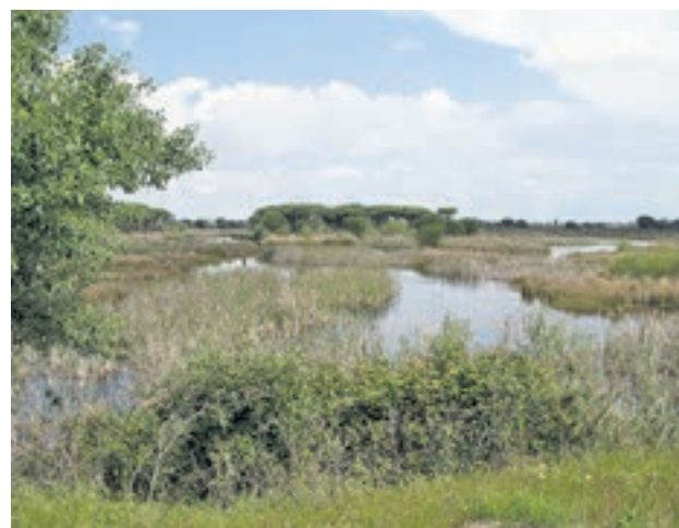
El Parque Nacional de Doñana no se ha librado de esta práctica

En esta actuación, que ha tenido una duración de cinco meses, se han realizado un total de 1.800 inspecciones para la localización de pozos