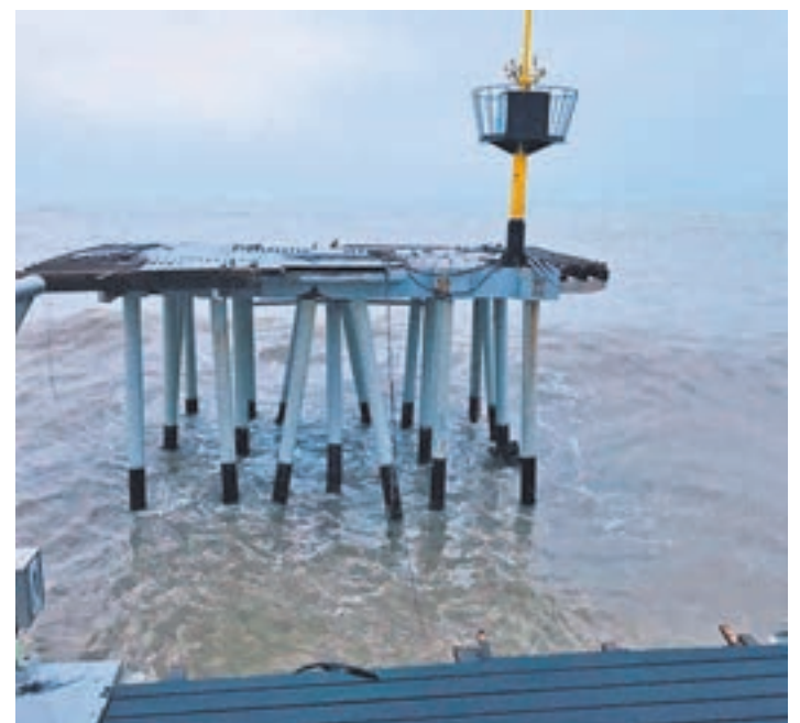
El temporal ha partit la part final del pont del Petrolí de Badalona.