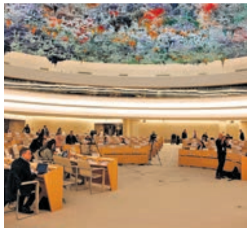
Seu del Consell de Drets Humans de l'ONU.

EL PERIÓDICO GENTE NO SE RESPONSABILIZA NI SE IDENTIFICA CON LAS OPINIONES QUE SUS LECTORES Y COLABORADORES EXPONGAN EN SUS CARTAS Y ARTÍCULOS