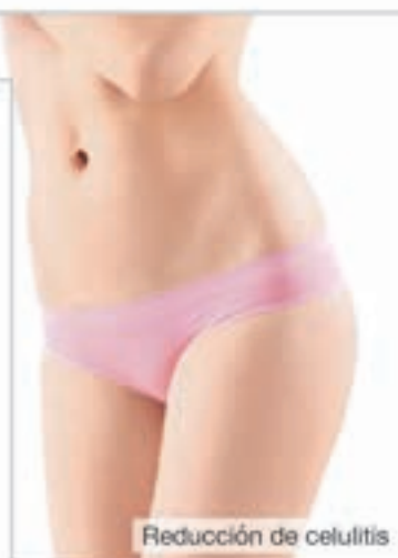
Reducción de celulitis

en la mayoría de los casos poco o nada, ya que sus moléculas de colágeno a menudo son demasiado grandes para llegar desde el exterior hasta el interior de la piel. Sin embargo, expertos dermatológicos han logrado dividir las moléculas de colágeno de tal forma que el cuerpo las puede absorber bien desde el interior.