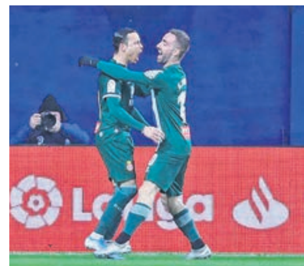
RDT marcó en el campo del Villarreal