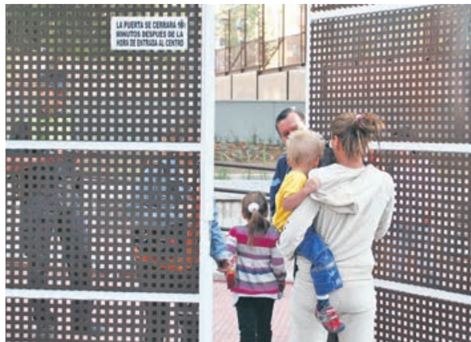
Escolares, a la entrada de un colegio de Murcia

Una de las voces más enconadas parte del propio Gobierno de Pedro Sánchez. La nueva delegada del Gobierno para la Violencia de Género, Victoria Rosell, defiende la posibilidad de aplicar el artículo 155 en Murcia si no se aviene a retirar el veto paren-