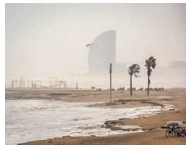
El temporal ha hecho desaparecer muchas playas

Por la tarde, otro individuo, de 63 años y vecino de Madrid, murió en Pedro Bernardo (Ávila) por la caída de una teja de su vivienda a causa del viento. Durante la madrugada, una mujer de 54 años falleció en Gandía como consecuencia de una hipotermia. También en la Comunidad Valenciana, un hombre de unos 70 años perdió la vida en Moixent (Valencia) y la causa está pendiente de los resultados de la autopsia.