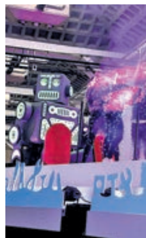
Carrossa de joguines. ACN

En aquest tipus de continguts, les nenes juguen a nines, tenen rols de maternitat i tenen cura del seu aspecte físic, mentre que els nens juguen amb cotxes o representacions d'armes i simulen la lluita, descriu el CAC.