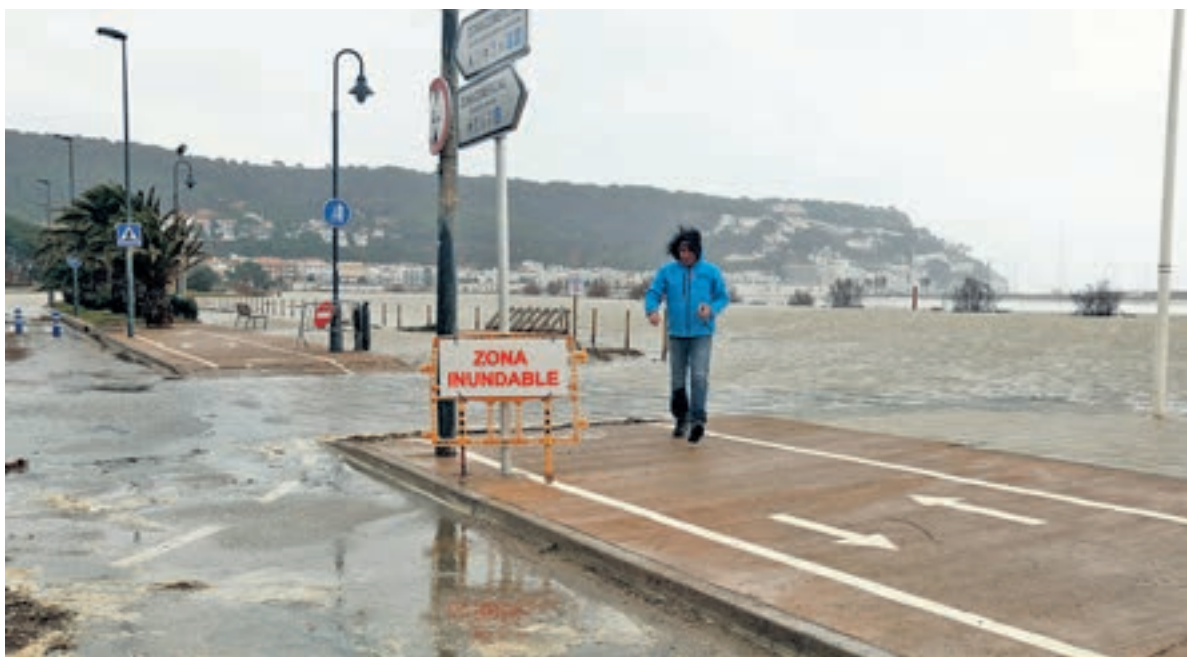
La llevantada ha deixat platges i passeigs marítims malmesos. ACN