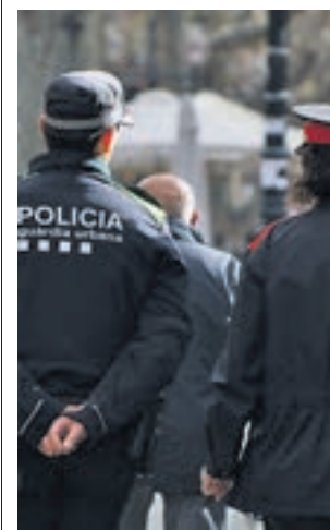
Hi ha més presència policial.

Com a mesures preventives, el consistori ha anunciat la col·locació de 20 nous punts de radars fixes dins la ciutat en indrets com la Gran Via o Aragó i incrementar els carrers de la ciutat on els vehicles hagin de circular a un màxim de 30 km/h, fins arribar al 75% del total.