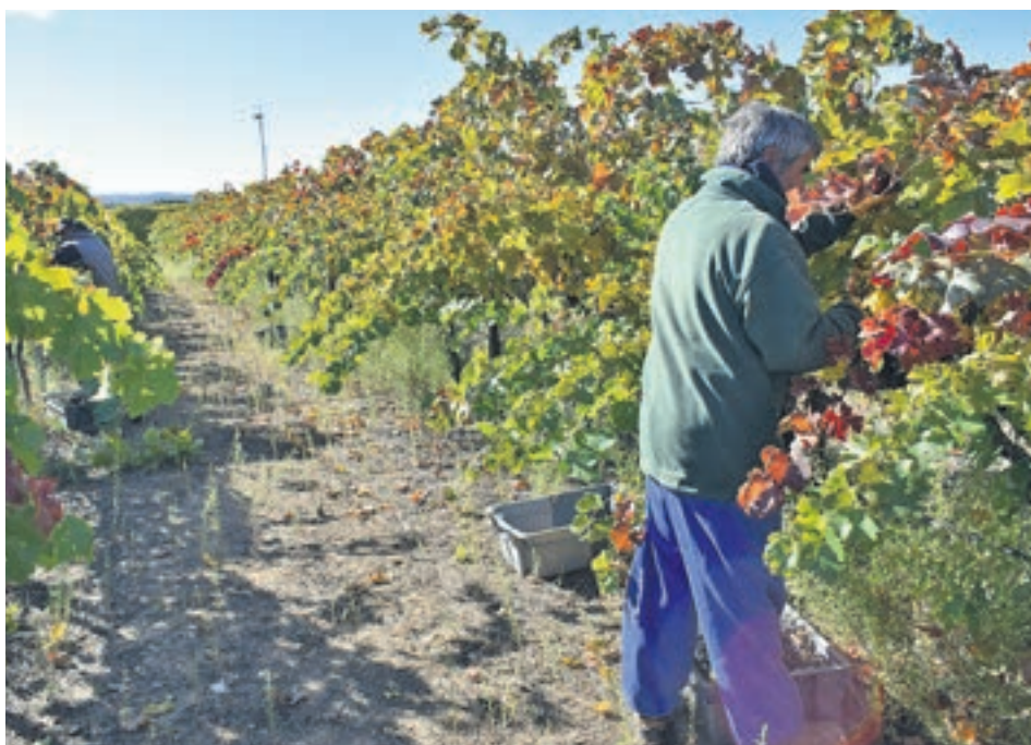
La medida incidirá en todo el régimen general y también en empleados del hogar y agrarios