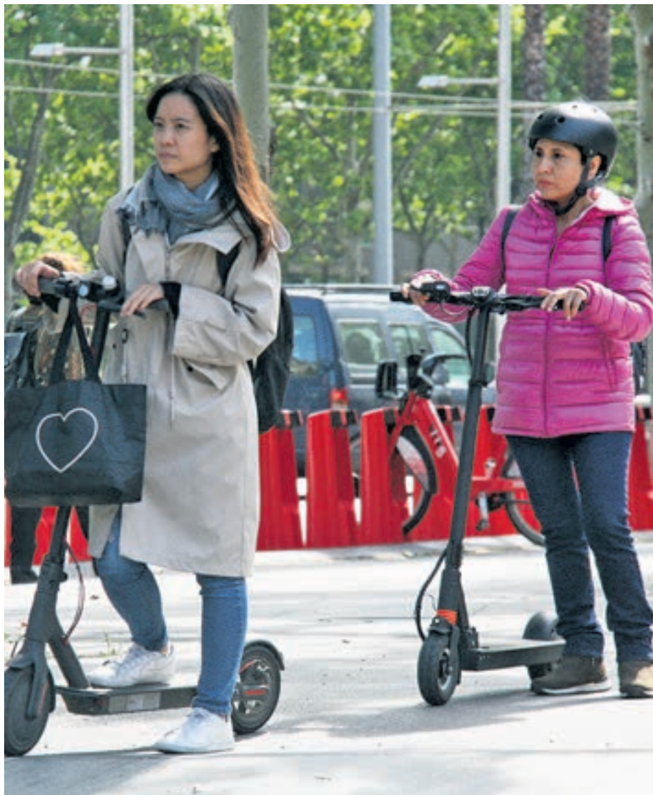
Les multes als conductors de patinets també s'han multiplicat per deu.

Segons el balanç de la sinistralitat a la ciutat, el 2019 es va tancar amb 22 morts, un més que l'any anterior. Els ferits van passar d'11.839 a 11.832, una xifra molt similar. No obstant, els ferits greus es van reduir, passant dels 238 als 202, el que significa un descens del 15,13%. Es van registrar 9.251 sinistres, un