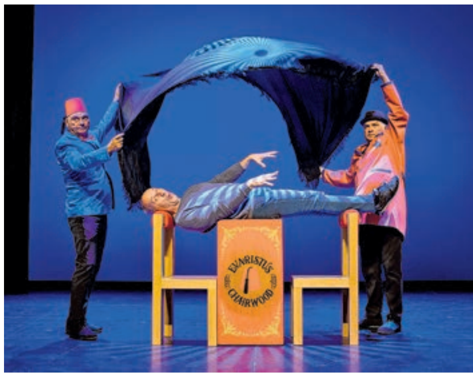
Els tres integrants del grup, durant una de les seves actuacions.

L'espectacle 'Hits', amb el qual la companyia resumeix l'acrònim d'Humor Intel·ligent Trepidant i Sorprenent, reuneix dotze esquetxos reduïts i un ampli resum compost per gags curts que tan-