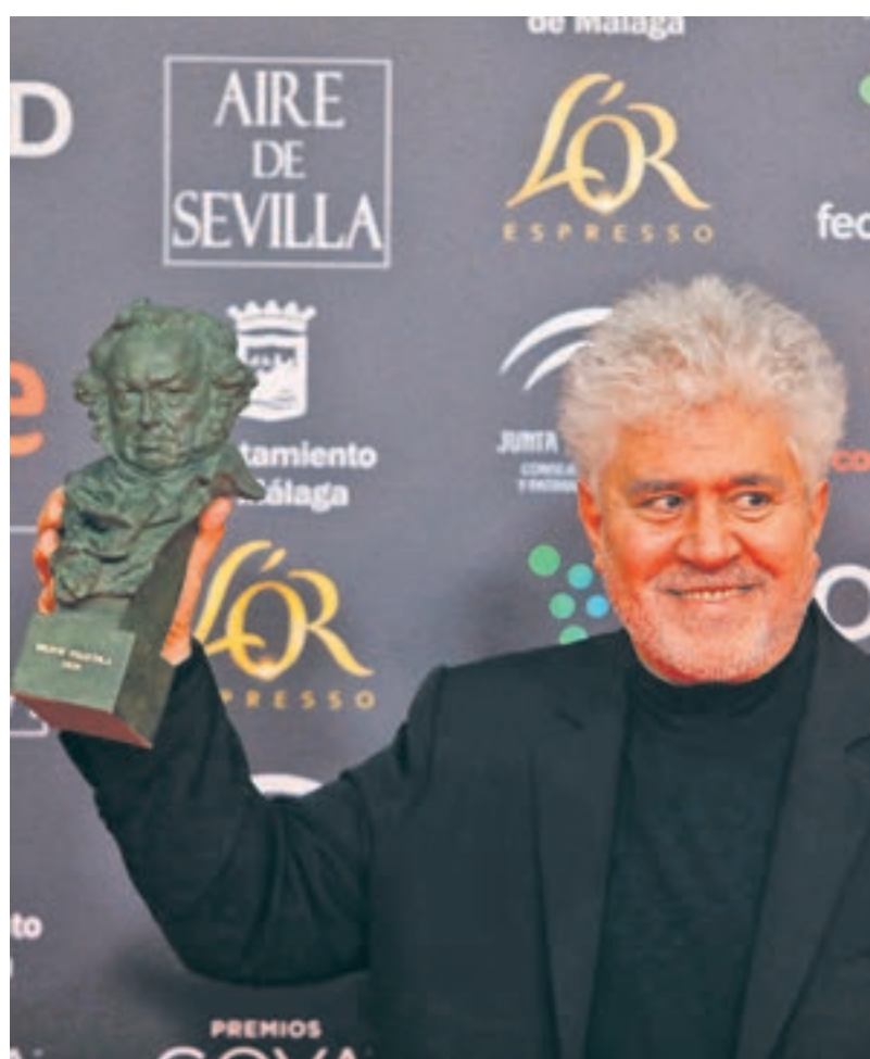
Profeta en su tierra: Después de unos años en los que su relación con la Academia no parecía atravesar su mejor momento, Pedro Almodóvar no solo estuvo presente en esta gala de los Goya, sino que además salió triunfal con seis premios (Dirección, Actor Protagonista, Música Original, Actriz de Reparto, Guion y Mejor Película).

EDUARD FERNÁNDEZ FUE PREMIADO POR 'MIENTRAS DURE LA GUERRA'