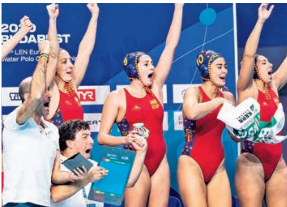
Hungría se ha convertido en el país fetiche de la selección de waterpolo