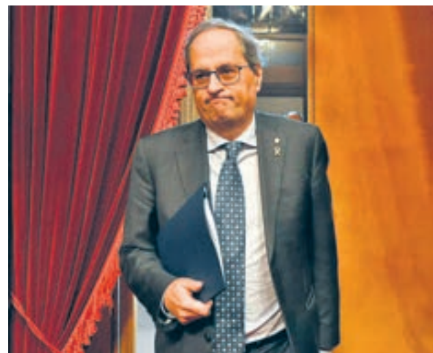
Torra en el Parlament