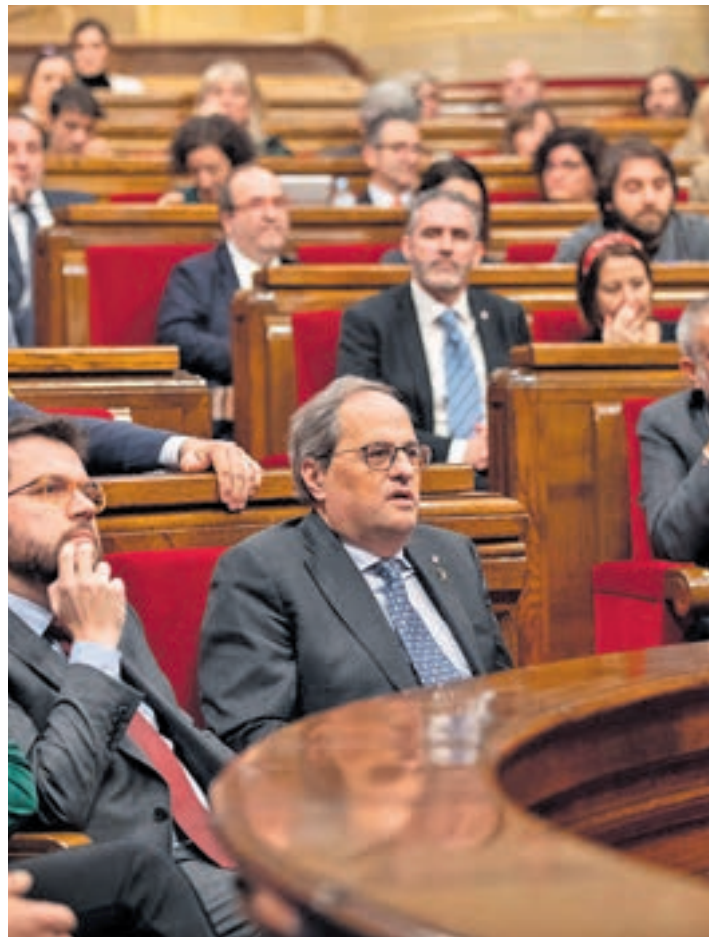
Quim Torra, en su escaño del Parlament

Pese a constatar que no hay más margen para seguir con la legislatura, expresó que, por responsabilidad, la mantiene para que Cataluña tenga unos presupuestos, que sigan prorrogados desde 2017. Al cierre de esta edición, las cuentas se estaban debatiendo en el Parlament con muchas posibilidades de ser aprobadas. A partir de este momento, serán necesarios, al menos, dos meses de comparecencias y votaciones. Fuentes de JxCat creen que el trámite podría estar finalizado a mediados de marzo.