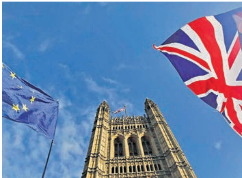
La fecha límite del Brexit ha llegado

GIBRALTAR DEBERÁ ADAPTARSE A LO QUE DECIDA EL REINO UNIDO