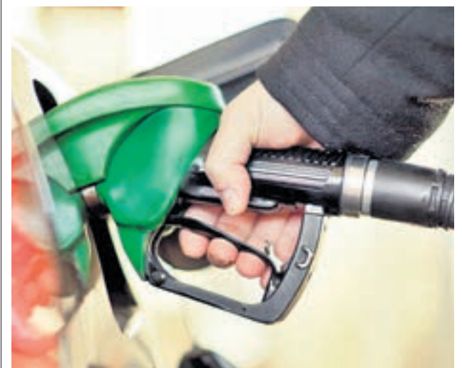
Fin a un periodo de subidas

Además, de manera reciente, su primer ministro, Fabián Picardo, mostró el deseo de seguir perteneciendo al espacio Schengen. Pese a ello, desde el Gobierno central ya se le ha dejado claro que no podrán negociar por su cuenta.