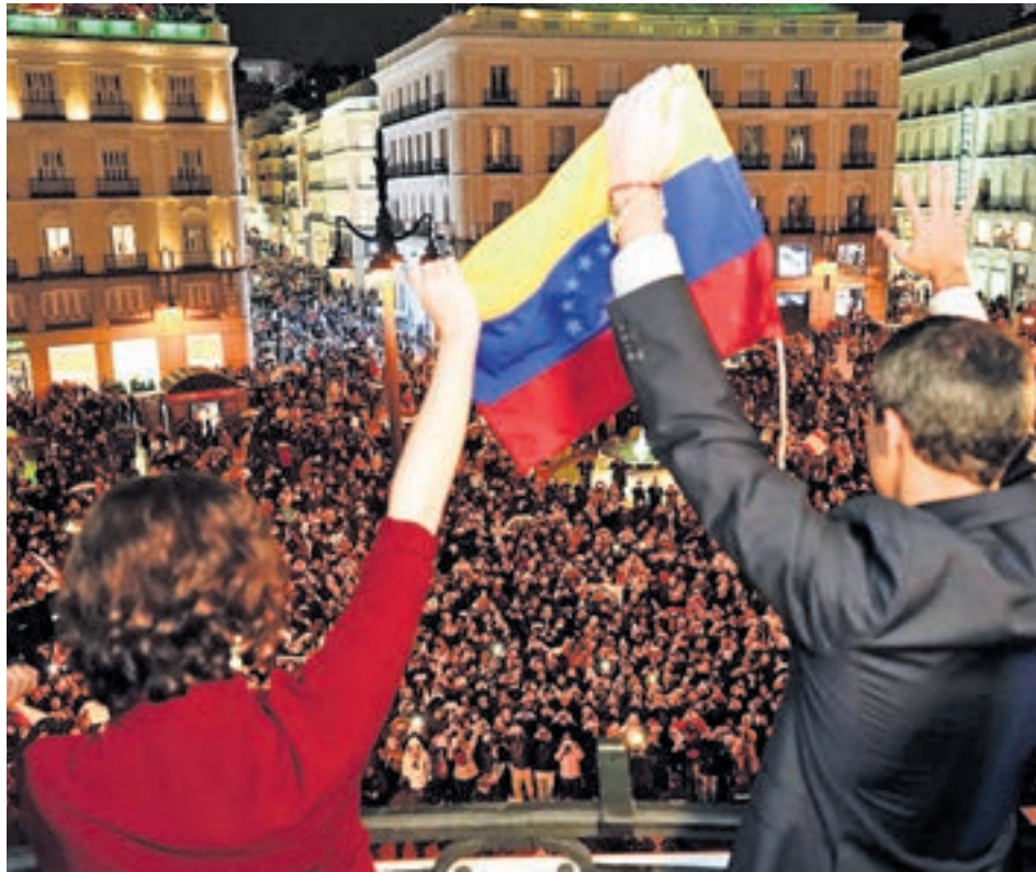
Díaz Ayuso y Guaidó se dirigen al público

"Compartimos con Venezuela historia, cultura, pero también futuro a través de los más de 66.000 venezolanos que están con nosotros hu-