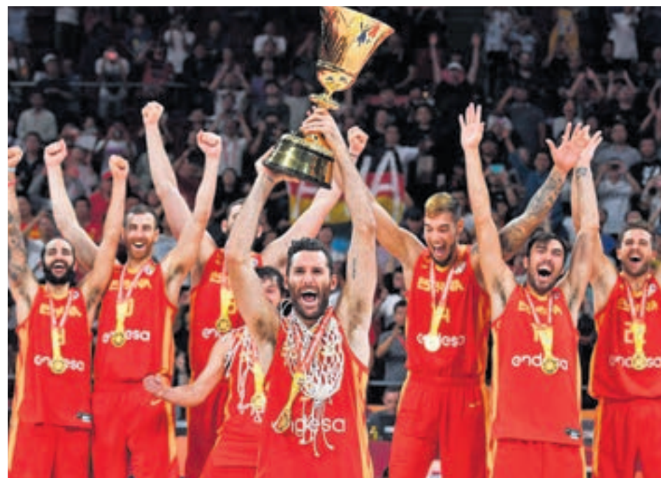
En septiembre el combinado de masculino ganaba el Mundial en China