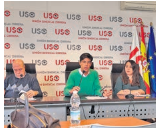
Un momento de la presentación del estudio

El año pasado, los contratos eventuales por circunstancias de la producción alcanzaron casi el 50% de los contratos realizados, mientras que se redujo la contratación indefinida inicial un 8,5% en comparación con 2018.