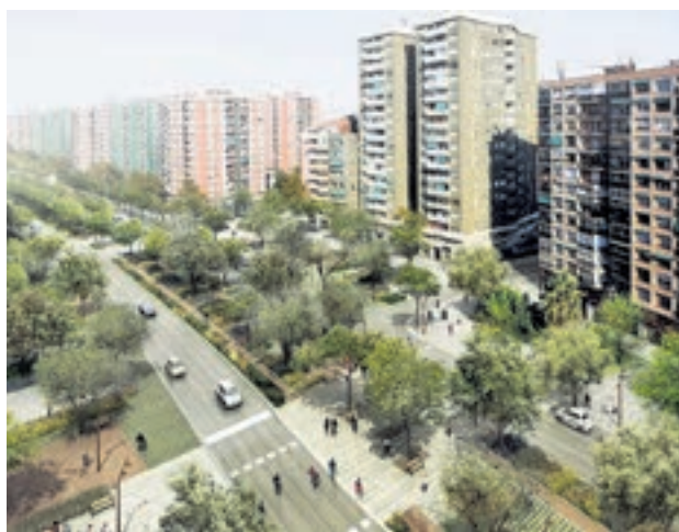
Així quedaria l'avinguda Meridiana després de les obres.

al tram Mallorca0-Navas de Tolosa/Josep Estivill, que tindrà un carril d'entrada i un de sortida menys, o sigui que es passarà dels vuit actuals a sis, i una mitjana central amb un carril bici segregat, arbrat i zones d'estada. Entre aquest any i el vinent s'elaboraran els projectes de Navas de Tolosa/Josep Estivill - Fabra i Puig per poder iniciar les obres a principis del 2022.