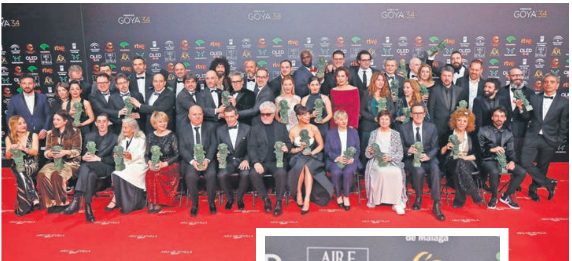
Foto de familia de los premiados