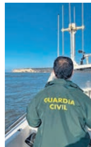
El dispositivo de rastreo

El naufragio se sitúa como principal hipótesis, tras localizarse dos bidones de aceite y dos balsas del navío. El pesquero ‘Rúa Mar’, con sede en el Puerto de Algeciras, desapareció en aguas de Marruecos en la madrugada del miércoles día 22. Desde entonces, se configuró un dispositivo de búsqueda compues-