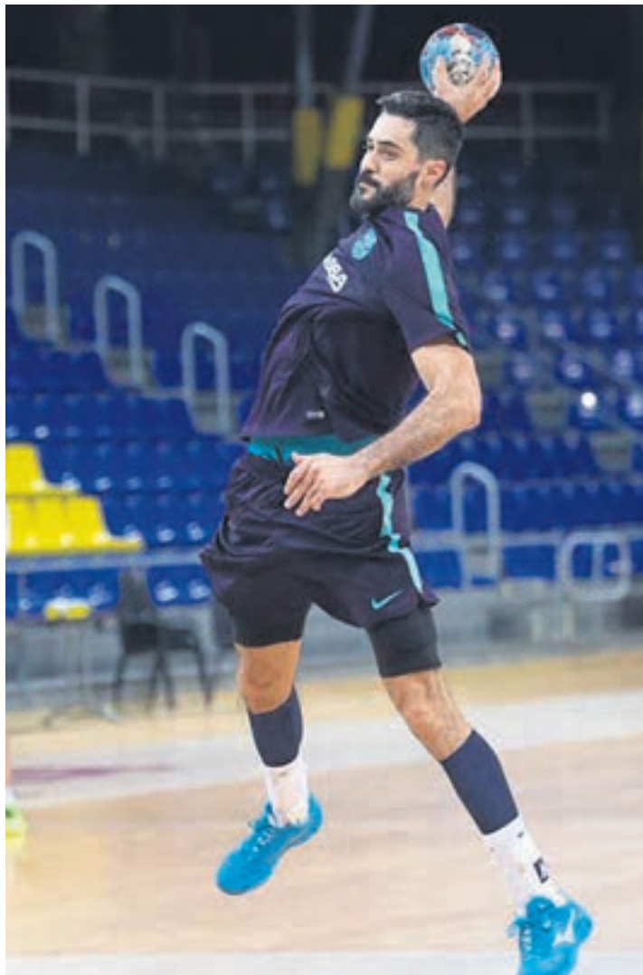
Raúl Entrerriós, capitán del Barça y de la selección

El próximo miércoles 5 regresa la Liga Asobal tras el parón pertinente por el reciente Europeo y lo hará con la duda de saber en qué fecha se proclamará campeón el Barcelona. Desde la desaparición del BM Atlético de Madrid, el cuadro azulgrana domina con mano de hierro todas las competiciones nacio-