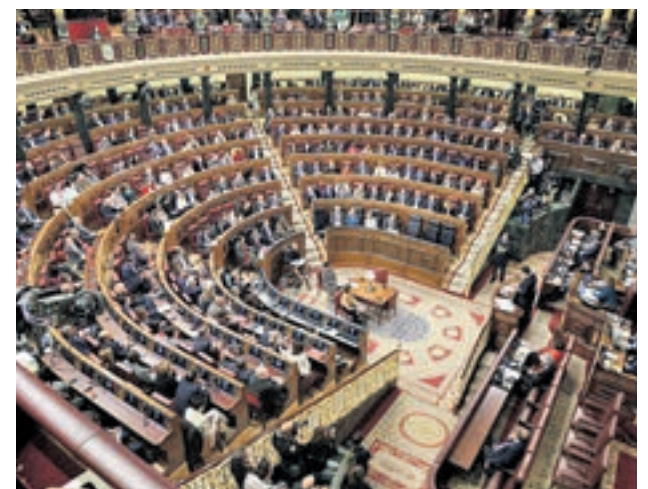
El Congreso de los Diputados

También será el debut parlamentario de Carolina Darias al frente del Ministerio de Política Territorial y Función Pública, para defender el decreto ley con la subida de los sueldos en el sector público, en línea con el compromiso asumido por el Ejecutivo del PP de Mariano Rajoy con los sindicatos de la Administración: un incremento fijo del 2% más uno variable hasta el 1% adicional en función del crecimiento del PIB de 2019.