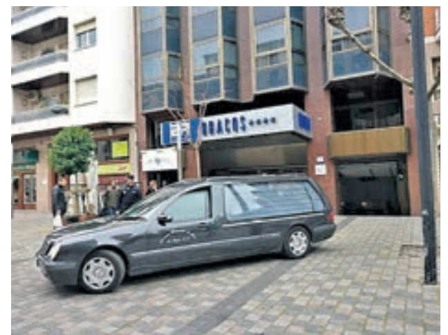
El coche fúnebre, en la entrada del hotel

La madre había escrito unas cartas de despedida que fueron entregadas por un familiar a la Guardia Civil de Haro. El suceso está siendo investigado por el juzgado número 3 de Logroño y ya se han abierto diligencias para esclarecer la sucesión de los hechos.