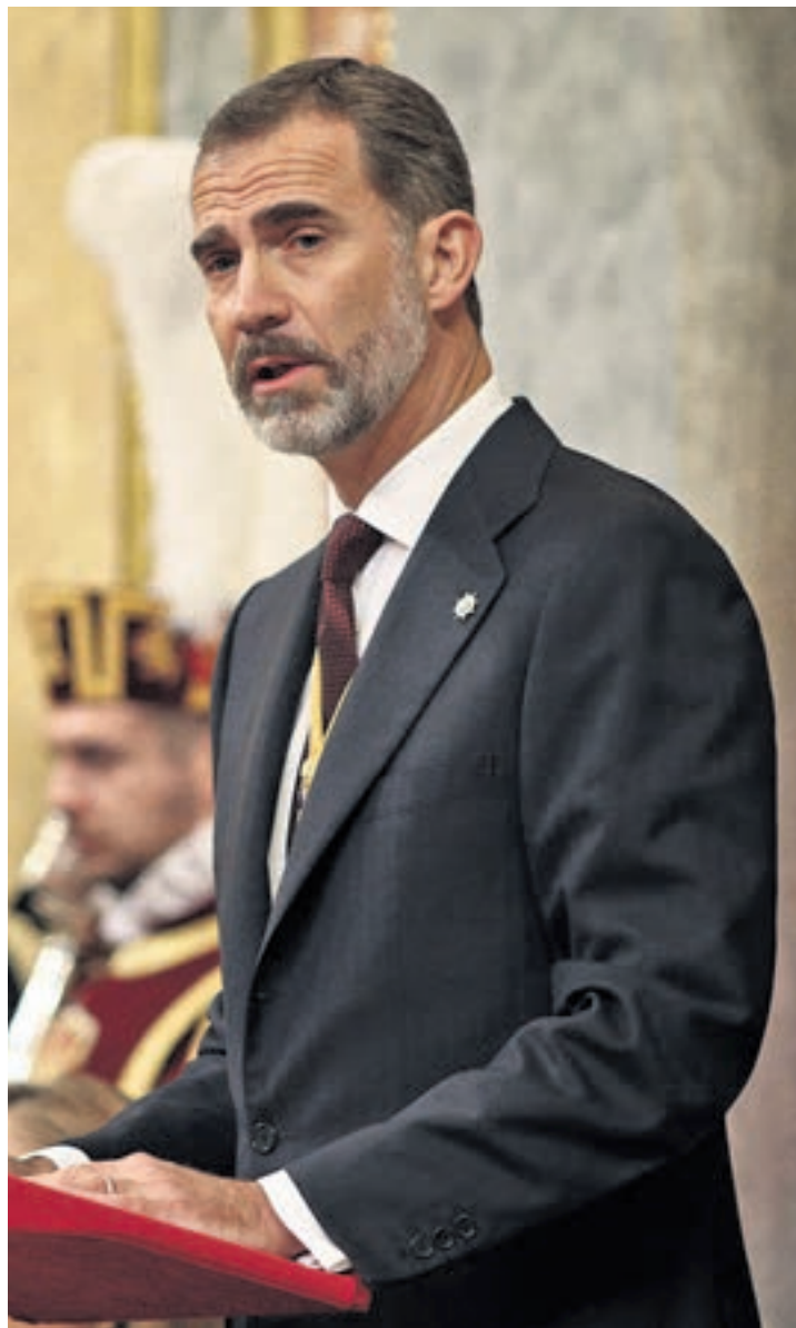
La intervención del monarca, el 17 de noviembre de 2016

Una vez que el presidente del Gobierno y las Mesas de Congreso y Senado hayan ocupado sus posiciones en el hemiciclo, los miembros de la mesa presidencial entrarán en el Salón de Sesiones por la escalera principal, que se coloca expresamente para estas ocasiones. Con los Reyes ya dentro, se interpretará el