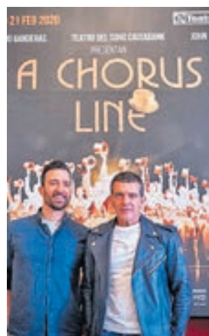
Banderas i Puyol. ACN

censurat, ara és un humor més unipersonal", reflexiona Gràcia. Destaquen que la seva evolució no ha sigut tant en l'humor, sinó en el fet que hagin guanyat saviesa escènica: "Ens hem acostumat als ritmes cinematogràfic".