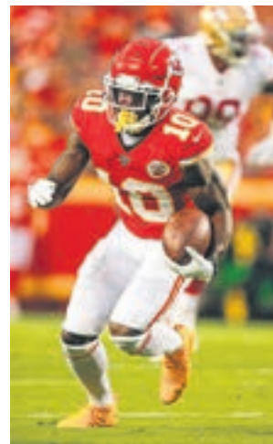
El partido arranca a las 0:30

La importancia del partido, el show que lo acompaña y la certeza de que cada vez hay un público más familiarizado con el fútbol americano hará que muchos españoles trasnochen este domingo para seguir el evento. De hecho, un estudio reciente revela que la venta de entradas para la NFL se ha incrementado un 81% en España en los últimos tres años.