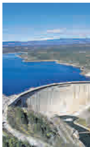
Embalse de El Atazar

Según explicó el Canal de Isabel II en un comunicado, el