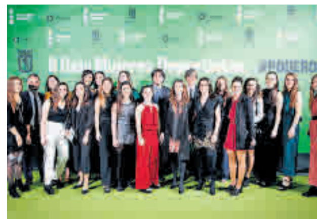
El CD Tacón, uno de los clubes galardonados

do que visita Vallecas este domingo (18:15 horas) empatado con el Albacete, equipo que abre la zona de descenso en Segunda B.