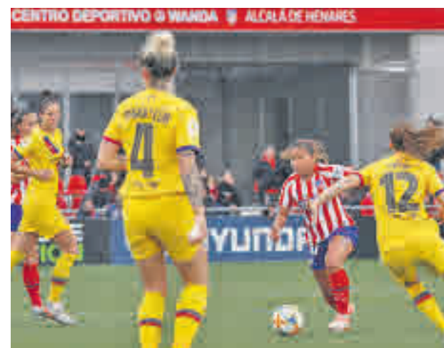
Atlético y Barça, dos de los aspirantes

La idea es convertir este torneo en una referencia a nivel nacional, aunque hay un par de aspectos que pueden afectar notablemente a este propósito. Para empezar, la