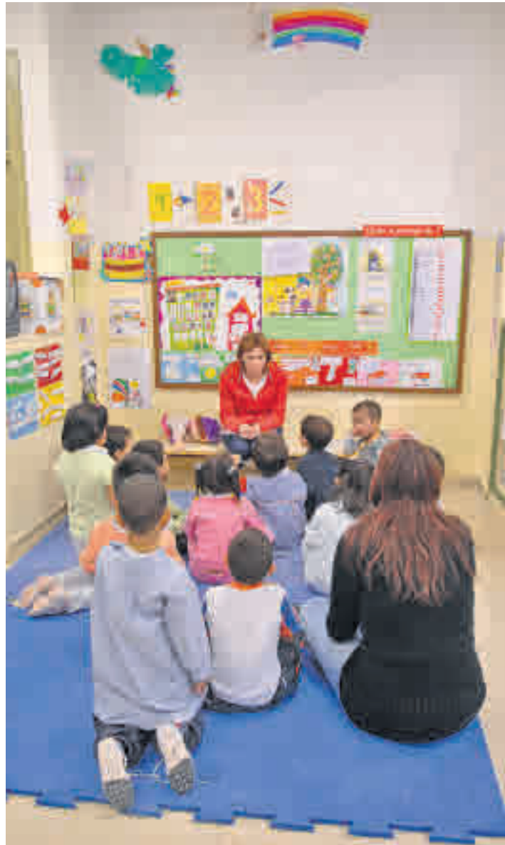
La polémica por el pin parental sigue en las aulas

co antes del inicio del proceso de admisión para el curso que viene las actividades complementarias y extraescolares que se van a realizar para que los padres puedan estar al corriente de las mismas. Sin embargo, esta medi-