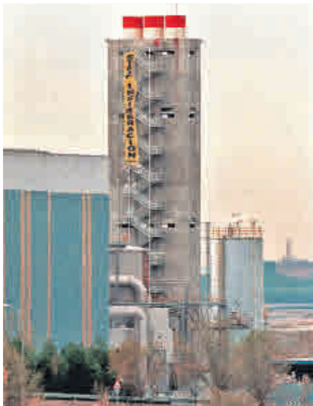
La torre de incineración de Valdemingómez

Primero fue la polémica y protestada aceptación de la llegada de la basura del Este a finales de diciembre; casi a renglón seguido, la anulación del contrato para reducir los malos olores de la planta de gestión de residuos; y recientemente el anuncio de que Madrid no continuará con la tramitación de la Estrategia de Residuos que aprobó la anterior Corporación al entender que es “nula de pleno derecho”. Esta última medida deja en el aire el plan de reducir a la mitad la incinera-