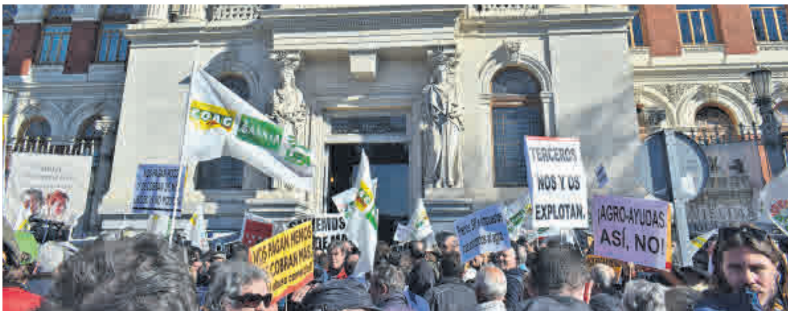
Agricultores y ganaderos se concentraron el miércoles a las puertas del Ministerio de Agricultura