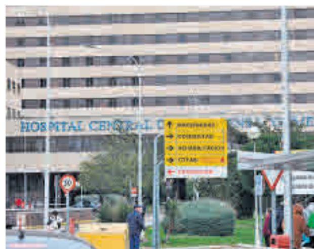
Hospital Gómez Ulla

Precisamente en el Gómez Ulla están ingresados los 21 españoles que llegaron el pasado viernes 31 de enero procedentes de Wuhan y que estarán aislados un total de 14 días, hasta que se confirme que no tienen síntomas de haberse contagiado.