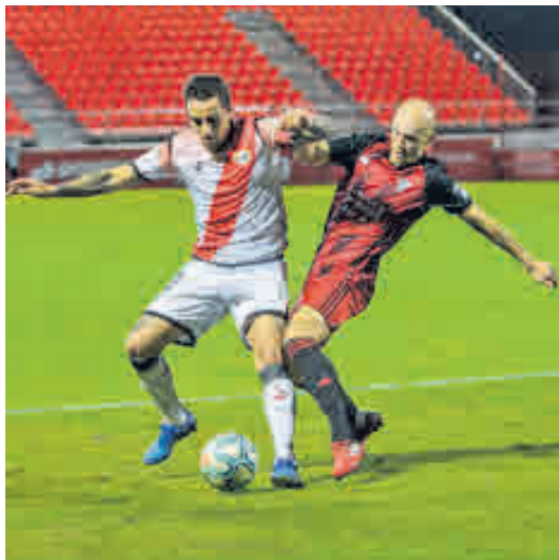
El Rayo no pasó del empate en Miranda

El Rayo recibe este domingo a un necesitado Real Oviedo con la baja del fichaje Yacine