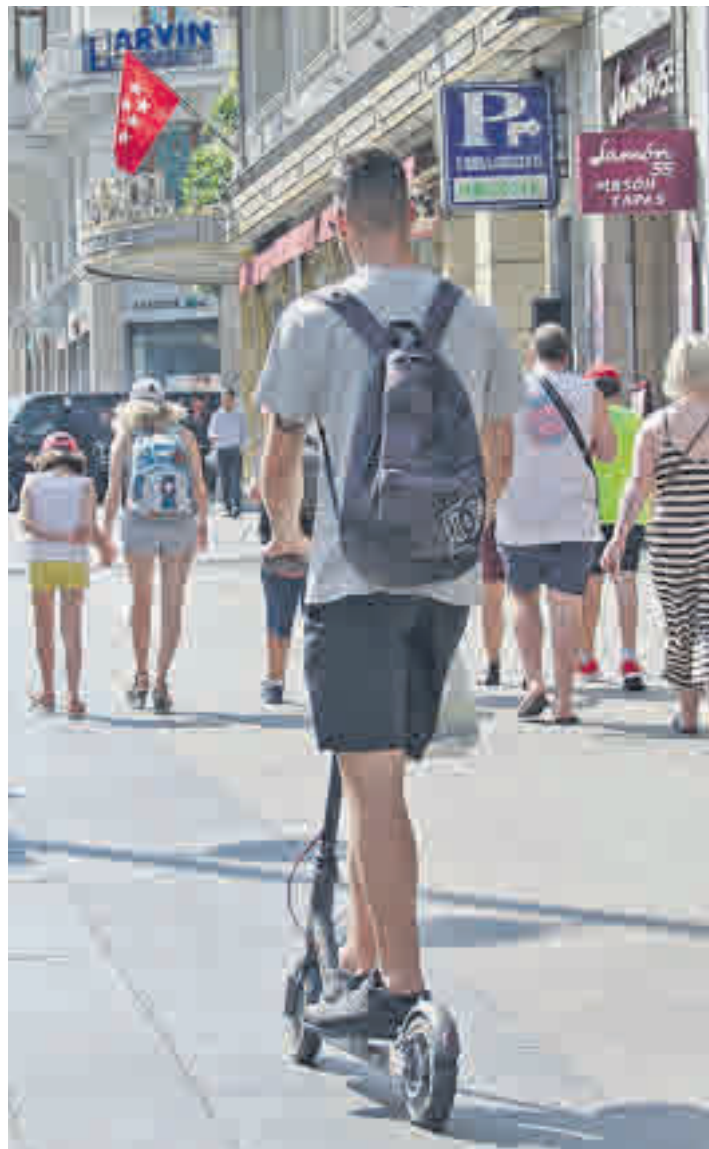
Un conductor de patinete eléctrico, por una acera

funcionado” ya que en un año se han reducido las empresas de patinetes en la ciudad, de 23 a 16, y los dispositivos, de 10.000 a 4.500.