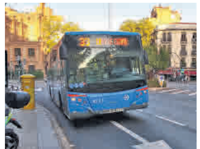
La línea 33 de la EMT

Por otro lado, a través del mismo estudio, se identificaron seis rutas donde consideran necesaria disminuir su dotación, debido a una menor demanda. El recorte afectará a las líneas 22, 27, 33, 59, 66 y 107. La acción sobre el bus 33, que da servicio a los equipamientos de la Casa de Campo, no se aplicará en los meses de mayo a septiembre, cuando se registra una mayor utilización de los mismos.