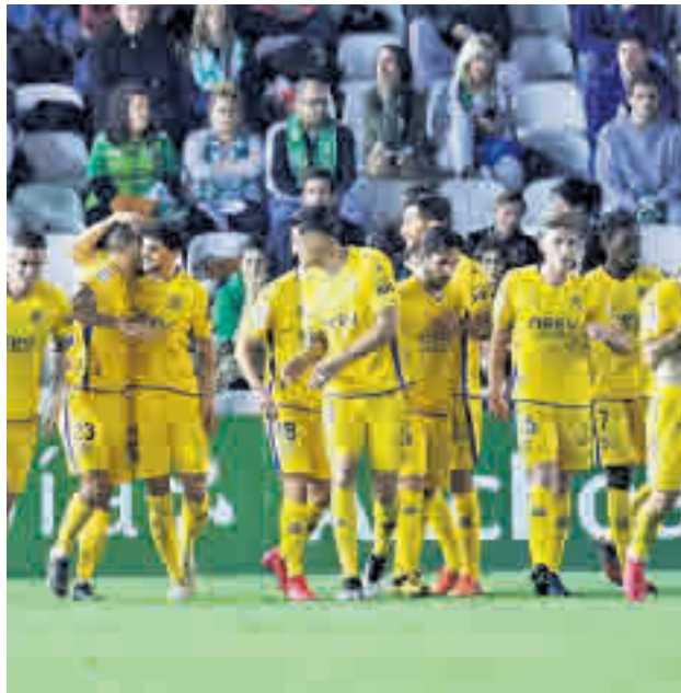
El Alcorcón no pierde comba LALIGA