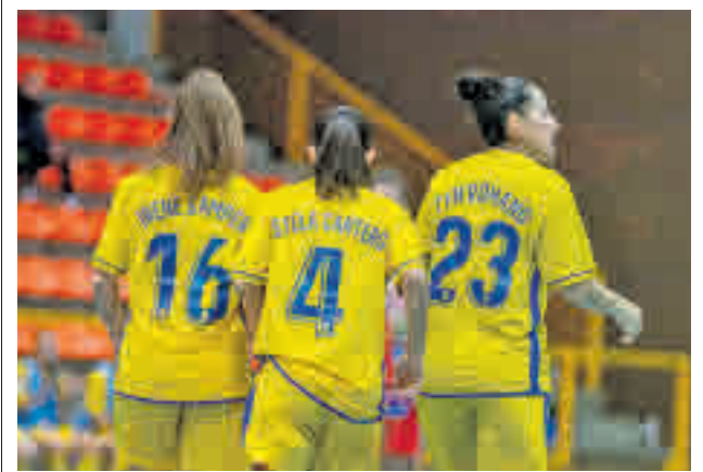
A por la Copa, sin complejos FSF ALCORCÓN

Liga y le ha cambiado la cara. Vencer a un histórico y cortar su racha puede ser el impulso que necesitan los amarillos para creer.