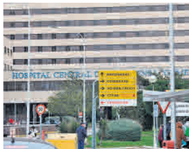
Hospital Gómez Ulla

Precisamente en el Gómez Ulla están ingresados los 21 españoles que llegaron el pasado viernes 31 de enero procedentes de Wuhan y que estarán aislados un total de 14 días, hasta que se confirme que no tienen síntomas de haberse contagiado.