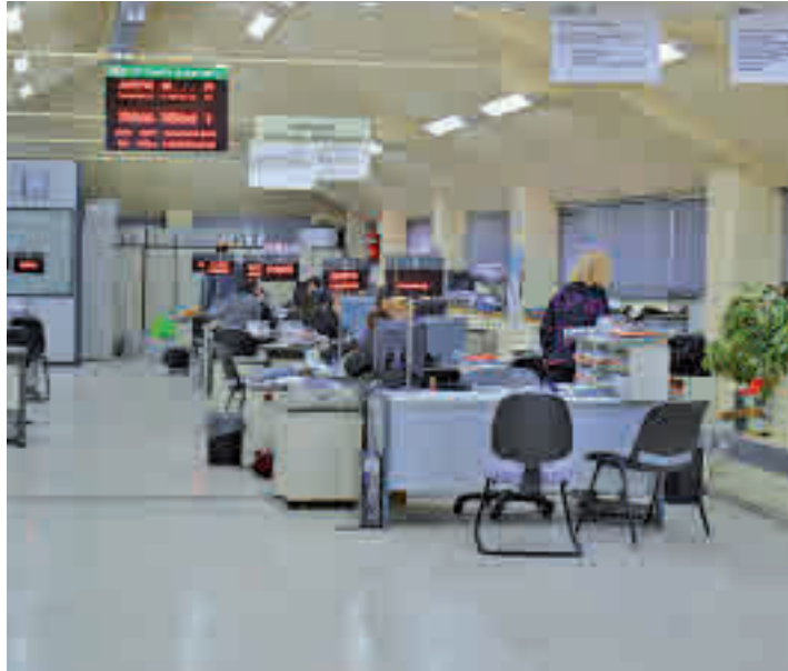
Una oficina del paro en el Sur de Madrid

El mes de enero no ha sido bueno para el empleo a nivel nacional, regional y local. Algo que también se ha dejado notar en municipios como Alcorcón donde el paro subió un 3,69% con respecto a diciembre de 2019, lo que supone un total de 328 desempleados más, según se desprende del último informe registrado por municipios sobre este concepto que ha pu-