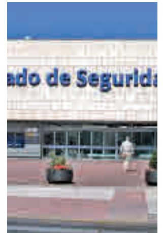
Centro Unificado de Alcorcón

Según detalles de la investigación, en todos los casos había habido previamente una sustracción de llaves. Los arrestados se apoderaban de ellas