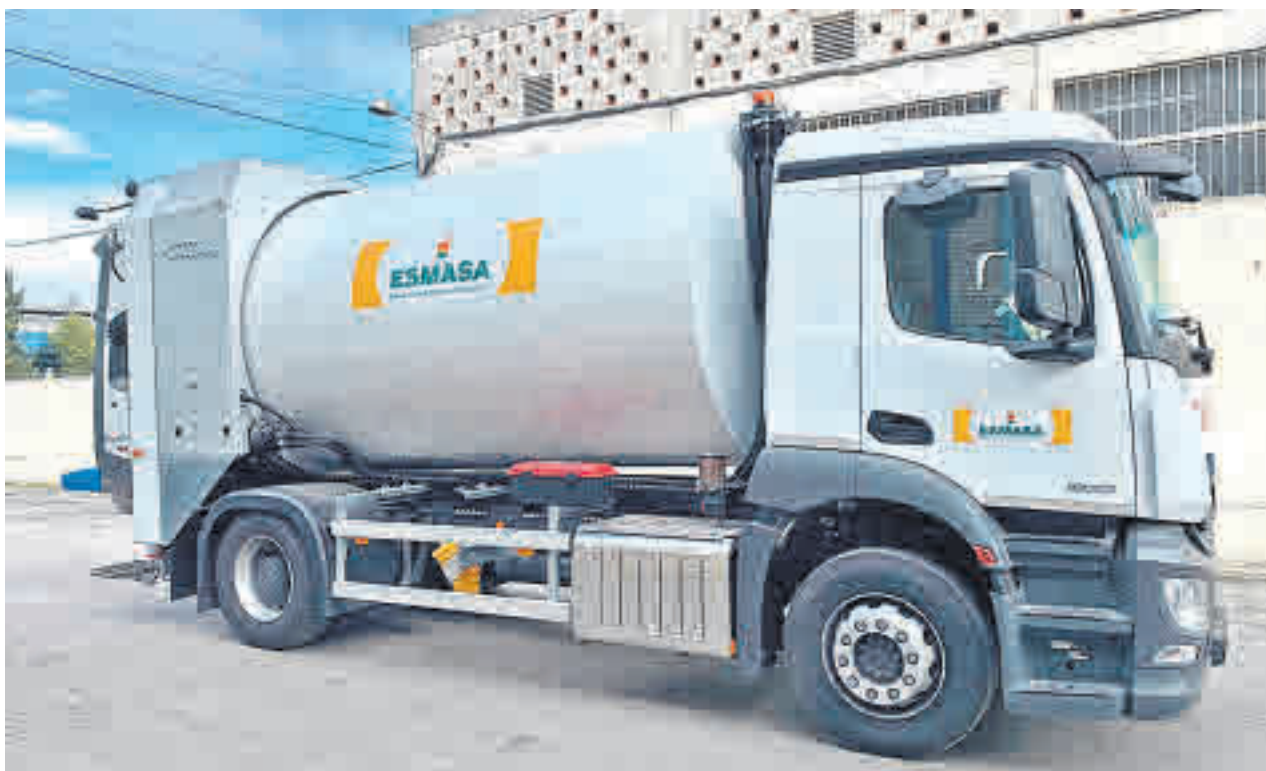
Nueva maquinaria de Esmasa