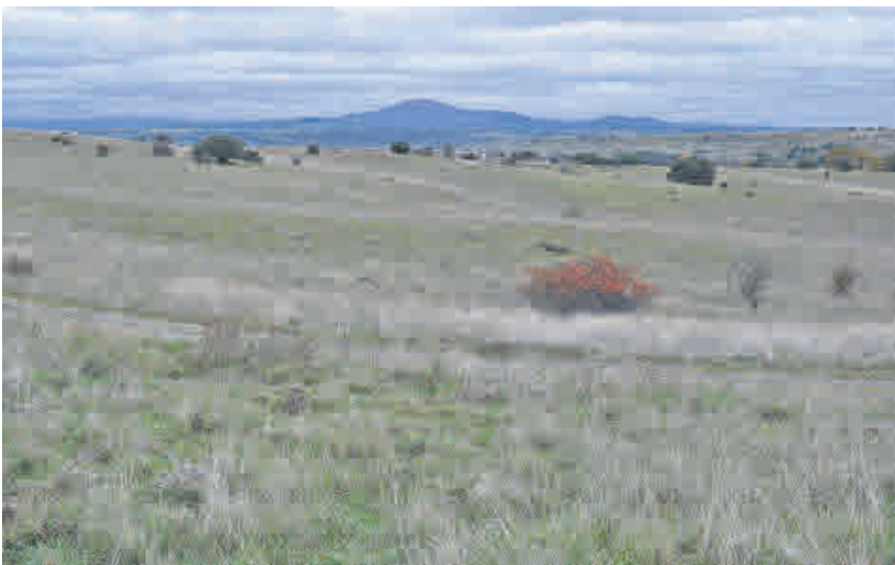
Terrenos de El Tagarral