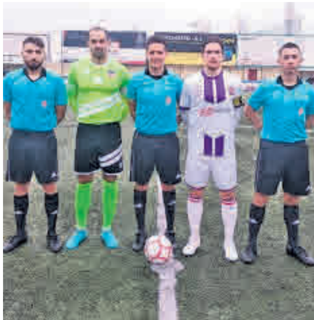
Inicio del partido del Tres Cantos con el Villalba

El Tres Cantos se prepara para competir este domingo 9, a las 16 horas, contra el Alcobendas Levitt, en un encuentro en el que jugará como visitante después de haber perdido 1-3 contra el Atlético Villalba el pasado fin de semana. Aunque estaban