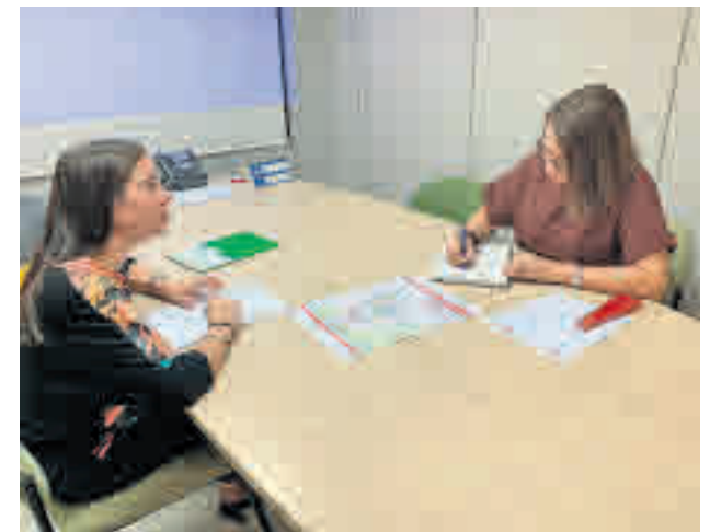
Encuentro con la delegada de Transporte Interurbano