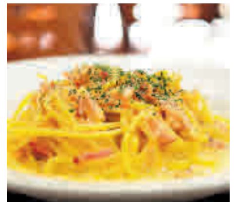
8. Pasta carbonara