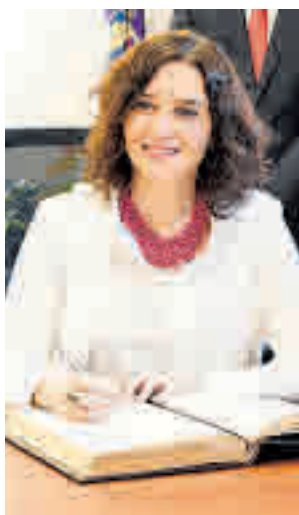
Díaz Ayuso en Pozuelo