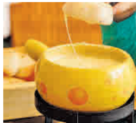
9. Fondue suiza