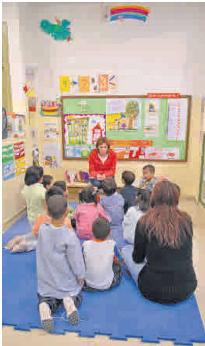
La polémica por el pin parental sigue en las aulas

co antes del inicio del proceso de admisión para el curso que viene las actividades complementarias y extraescolares que se van a realizar para que los padres puedan estar al corriente de las mismas. Sin embargo, esta medi-