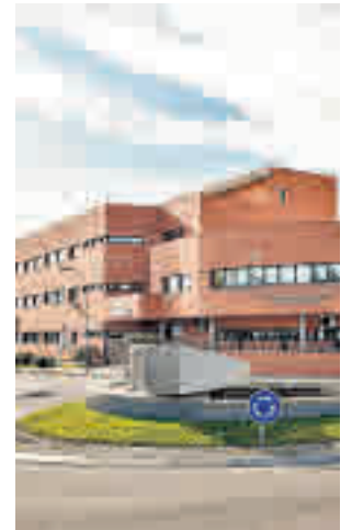
Centro de salud Sur

Fuentes del Summa, que gestiona el servicio, han ase-