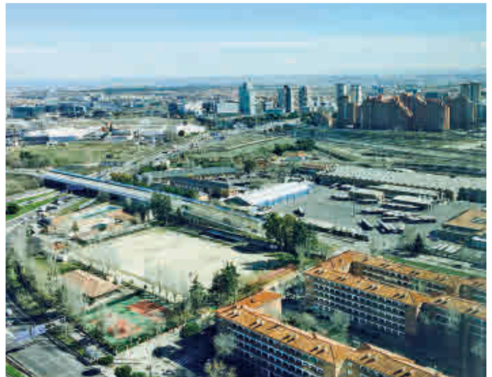
La zona de actuación del futuro proyecto urbanístico

Al respecto, comentó que este ámbito contará con