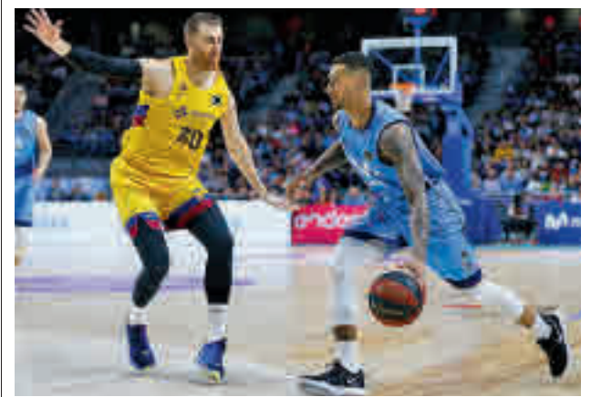
El Estudiantes tenía que visitar Murcia

profesional de ámbito estatal dos semanas". De este modo, los campos de fútbol de la región se quedarán sin actividad estos días.