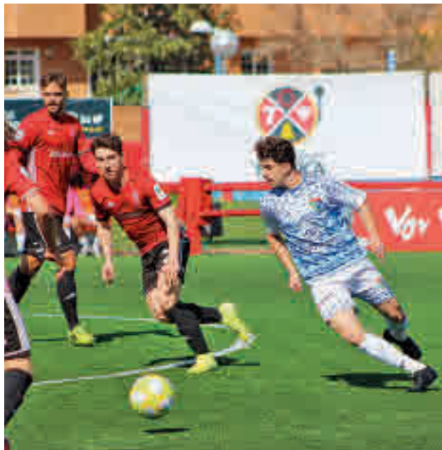
El Pinto, en el partido de la última jornada

En un primer momento, la Real Federación Española