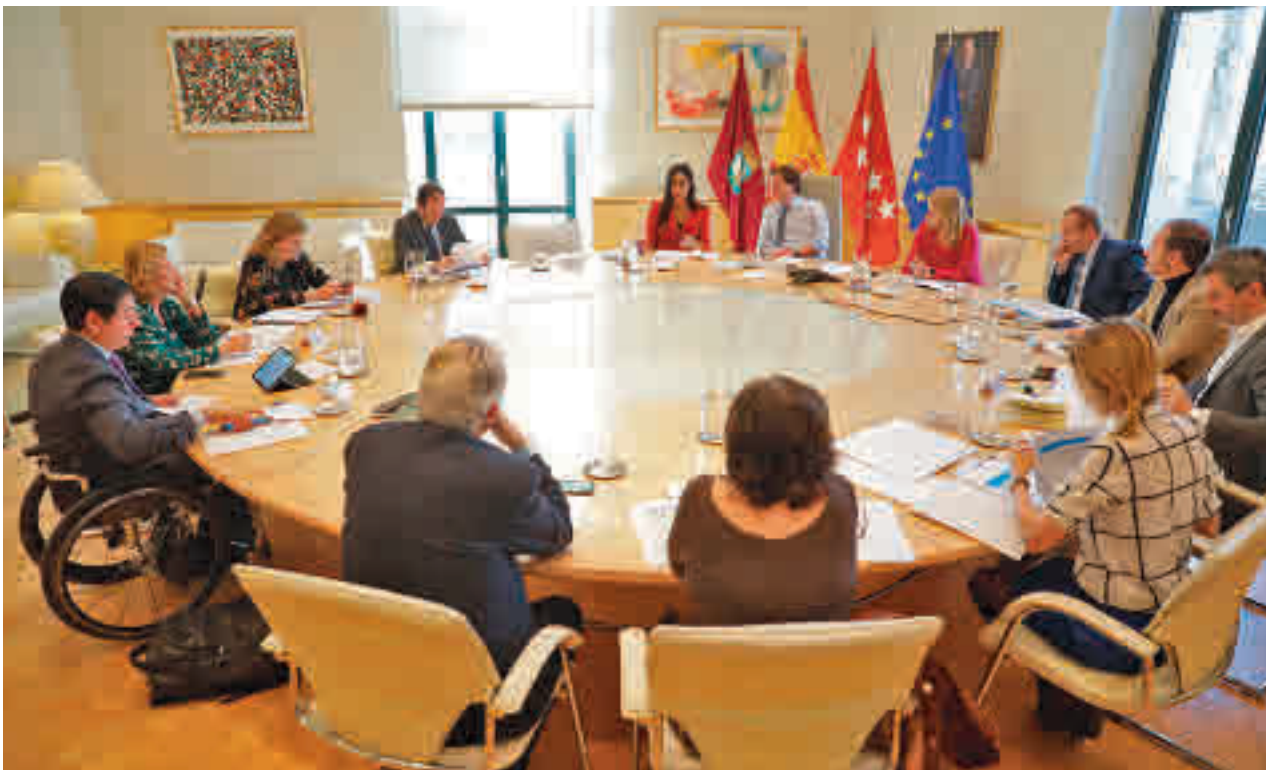
La reunión de la Junta de Gobierno extraordinaria del martes 10 de marzo