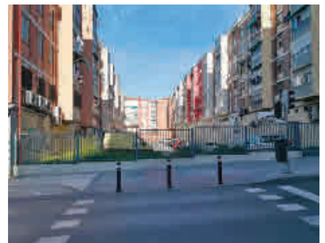
El solar donde se pretenden levantar las viviendas

De Dios explica a GENTE que en la reunión mantenida el 10 de marzo acordaron contratar a un abogado y a un arquitecto para que haga un informe. Mientras, reclamarán conocer el proyecto.