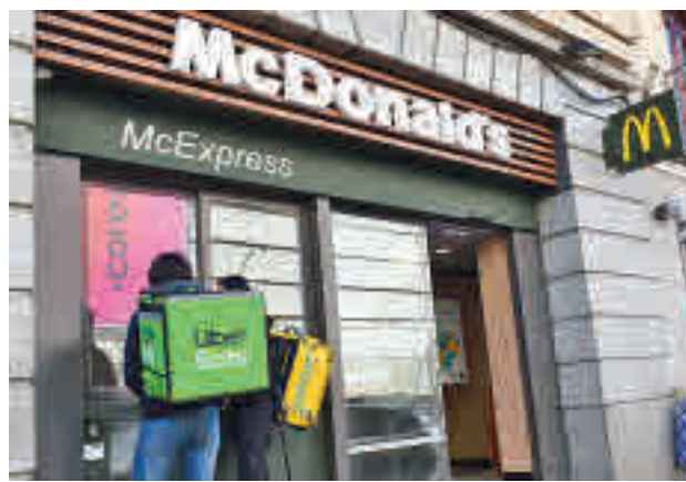
McDonald's, referencia en la comida a domicilio C. MARTÍNEZ

Ese liderazgo de las empresas que, preferentemente, producen hamburguesas demuestra que la comida rápida tiene gran tirón entre los usuarios de las 'apps' englobadas en el grupo denominado 'Restaurantes&Delivery'. Estos datos contrastan con la creencia popular de que se