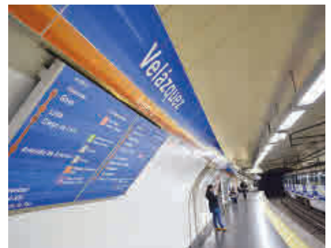
Uno de los andenes de la Línea 4 de Metro

El intervalo de paso en hora punta fue de entre 3 y 4 minutos para ajustarse a la demanda de viajeros.