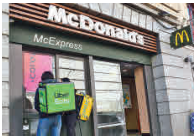
McDonald's, referencia en la comida a domicilio C. MARTÍNEZ

Ese liderazgo de las empresas que, preferentemente, producen hamburguesas demuestra que la comida rápida tiene gran tirón entre los usuarios de las 'apps' englobadas en el grupo denominado 'Restaurantes&Delivery'. Estos datos contrastan con la creencia popular de que se