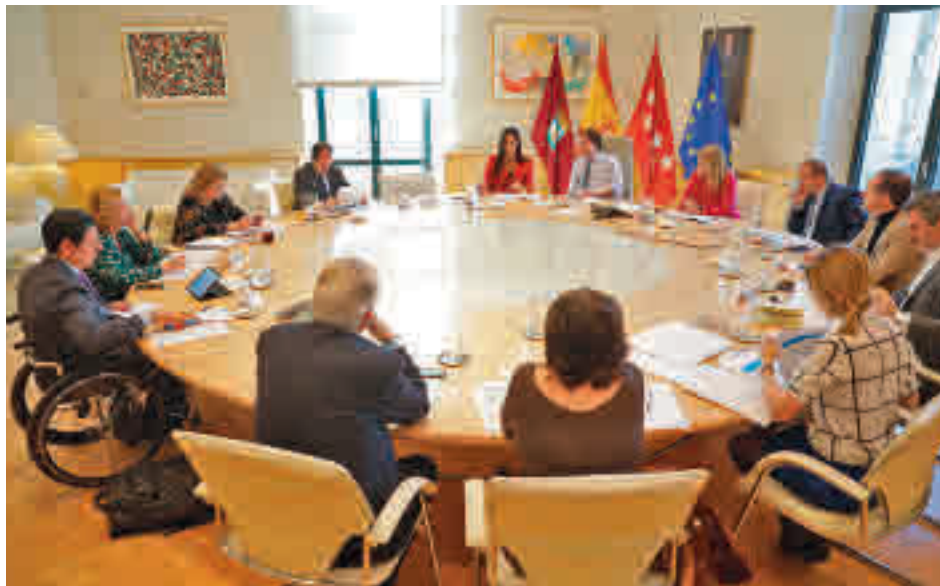
La reunión de la Junta de Gobierno extraordinaria del martes 10 de marzo

La Organización Mundial de la Salud (OMS) consideró a última hora de este miércoles al coronavirus como pandemia debido a su extensión a lo largo del planeta. Dos días antes, España entró en el escenario de contención reforzada con la adopción de medidas más agresivas que las puestas hasta el momento para frenar una enfermedad que tiene especial virulencia en la región madrileña.