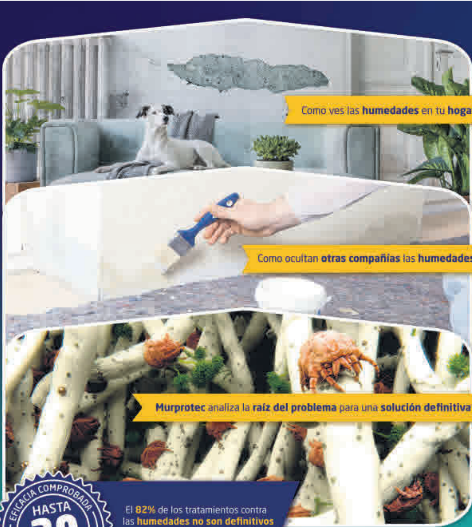
Como ves las humedades en tu hogar