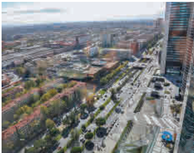
Una de las zonas de la futura actuación urbanística

● Las obras podrían empezar a finales de 2020 o a comienzos de 2021