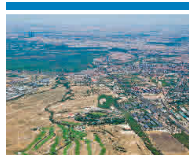
Una vista aérea de la futura operación urbanística

Mientras, la Comunidad de Madrid reitera su compromiso de levantar el nuevo centro educativo en este barrio, cuya construcción se hará en una única fase y estará listo para 2022.