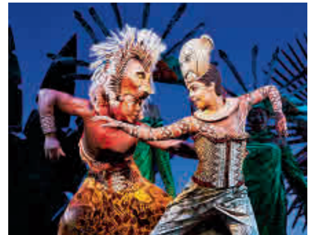
'El rey león' ha echado el cierre temporalmente

Al cierre de estas líneas aún no se había decretado ninguna orden