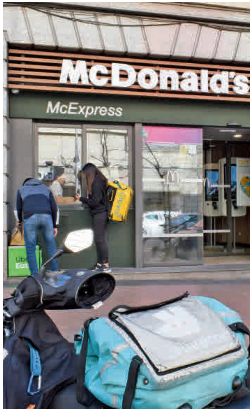
Los establecimientos de McDonald's, referencia en la comida a domicilio

Ese liderazgo de las empresas que, preferentemente, producen hamburguesas demuestra que la comida rápida tiene gran tirón entre los usuarios de las 'apps' englobadas en el grupo denominado 'Restaurantes&Delivery'. Estos datos contrastan con la creencia popular de que se opta en este caso por 'apps' genéricas, es decir, por aquellas que aglutinan varias marcas de comida. Nada más lejos de la realidad. Just Eat mantiene su tercera posición-