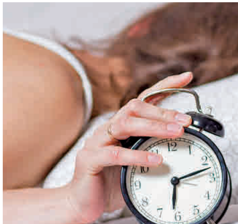
El sueño es un problema para la mayoría de españoles

El insomnio es otro de los problemas fundamentales que saca a la luz el informe. "El 75% de los entrevistados se despierta al menos una vez por la noche, y tres de cada diez afirman directamente que padecen insomnio", reconoce la directora de Marca,