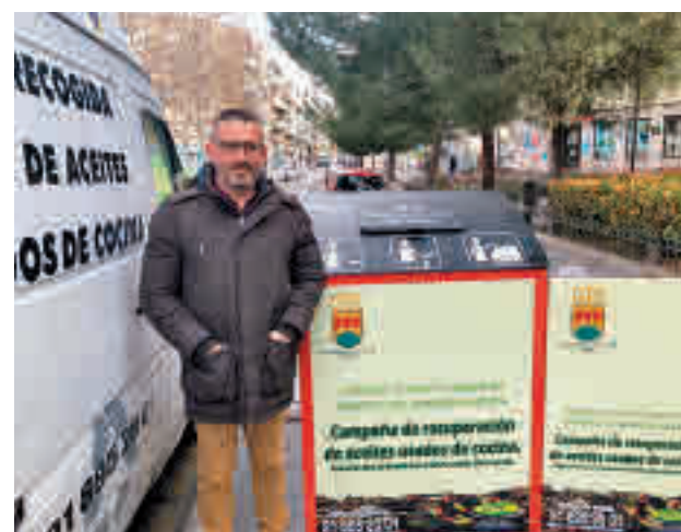
El concejal junto a los nuevos contenedores

Estos se suman a los otros seis depósitos ya desplegados en diferentes puntos de la ciudad: en la avenida Retamas, junto a la calle Juan Ramón Jiménez; en la avenida Los Cantos con calle Mayor; en la calle Mediterráneo con Pablo Picasso; en Pablo Neruda; en Fábricas, próximo a Olímpico Francisco Fernán-