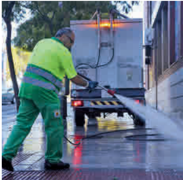
Un trabajador limpiando las calles

La Empresa de Servicios Municipales de Alcorcón (Esmasa) ha puesto en marcha una campaña para el baldeo de las calles del municipio, que se extenderá a lo largo de las próximas semanas en la localidad. "Queremos que este año llegue a todos los barrios", ha explicado el concejal de Servicios a la Ciudad, y presidente de Esmasa, Jesús Santos. Este tipo de actuaciones suelen acometerse a partir del mes de abril, pero el Consistorio ha decidido ade-