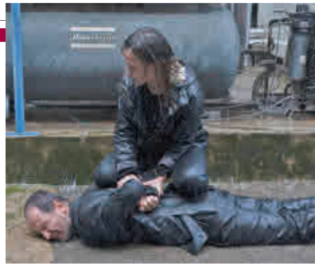
'Ofrenda a la tormenta', una de las producciones destacadas

Aunque la fiesta de Halloween queda ya lejos, los amantes del cine de terror se encontrarán con varios motivos para asistir a las salas de