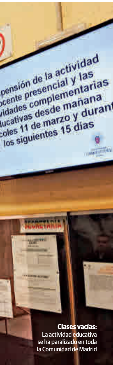
Clases vacías: La actividad educativa se ha paralizado en toda la Comunidad de Madrid

fectados tendrá síntomas leves, que se curan con aislamiento en el domicilio; un 15% necesitará una mayor atención; y solo el 5% estará en zona más sensible.