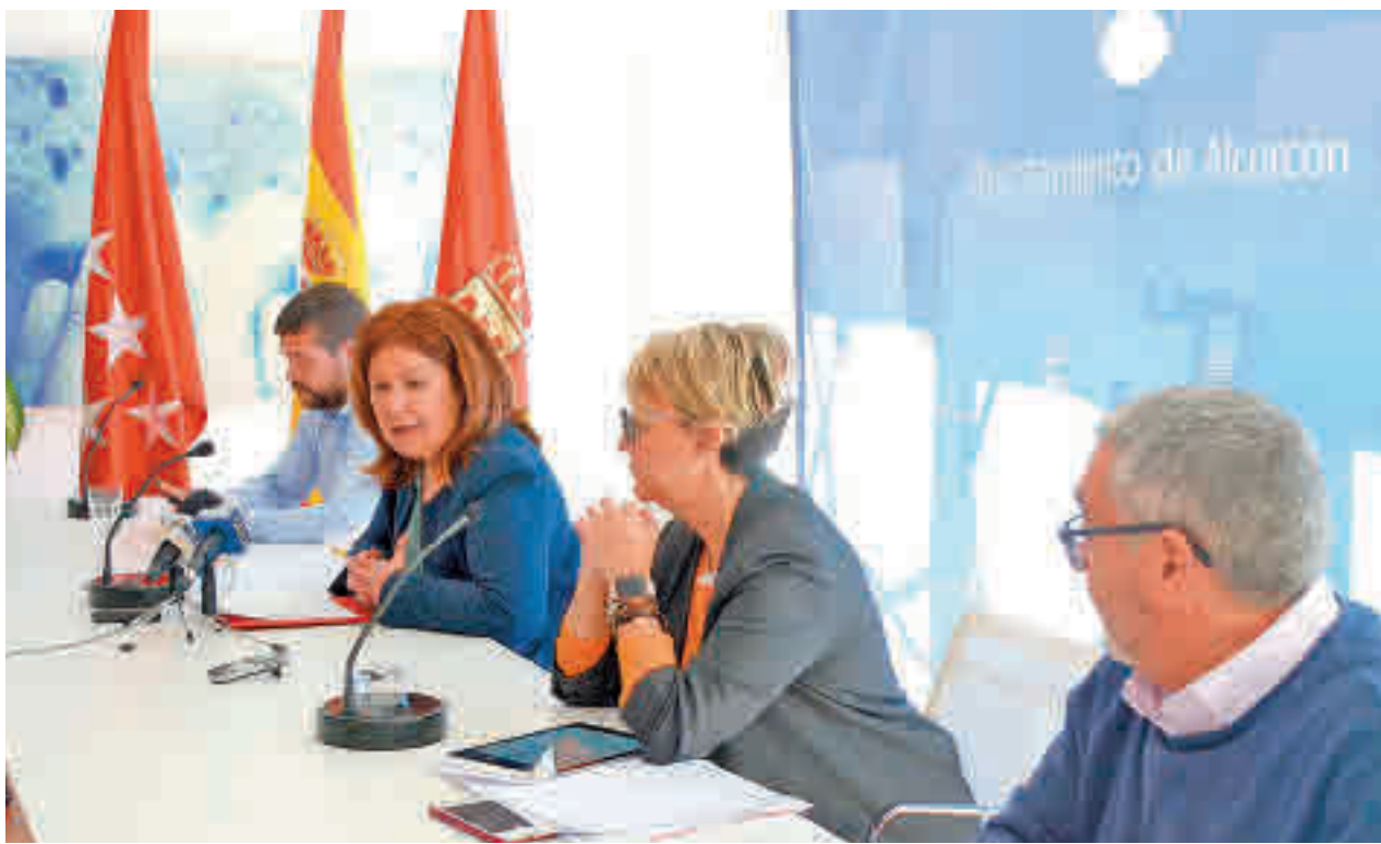
Presentación de las medidas