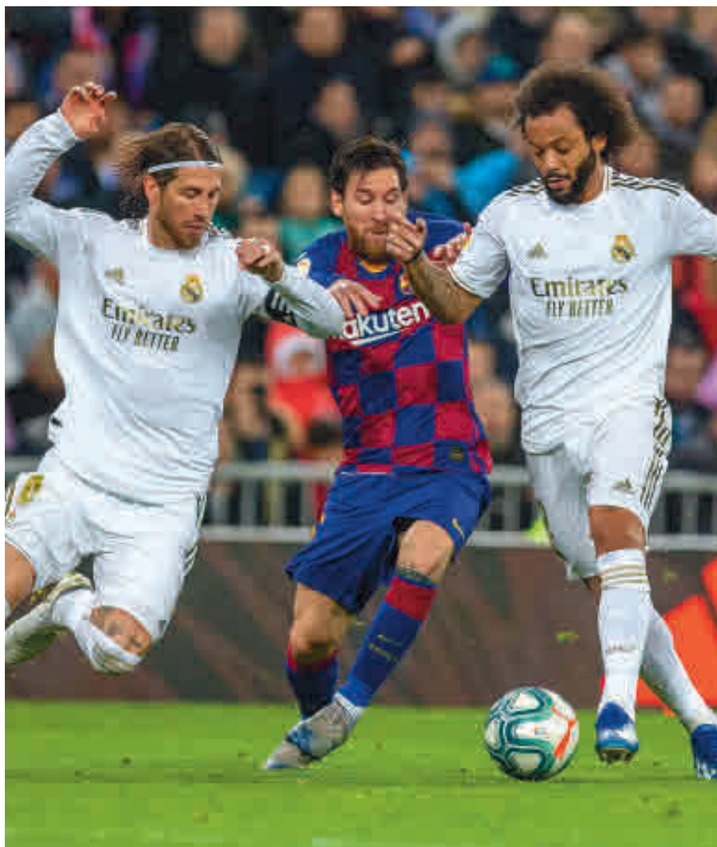
El pulso por el título entre el Barça y el Real Madrid queda en 'stand by'

Pocas horas después, el círculo se terminaba cerrando