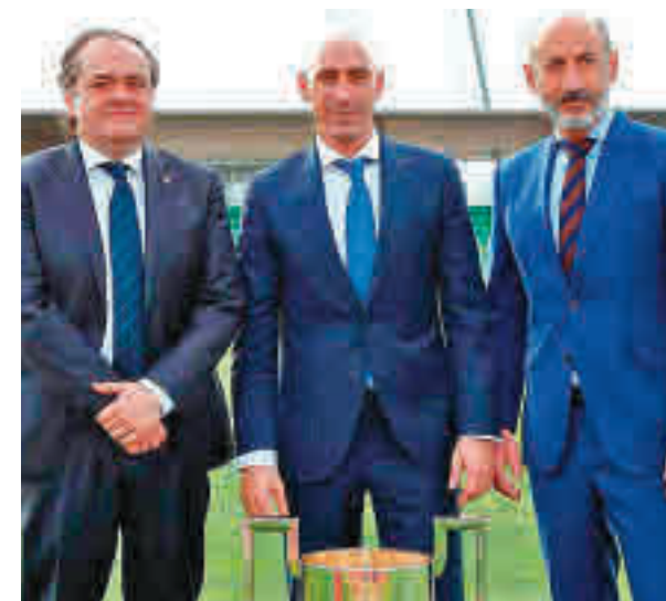
Rubiales, junto a los presidentes del Athletic y la Real

Al cierre de esta edición no se había decidido la fecha definitiva, aunque todo indica a que se tendrá que ir esperando a la evolución del COVID-19 en la sociedad. Además, también se podrían suspender la Champions y la Europa League.