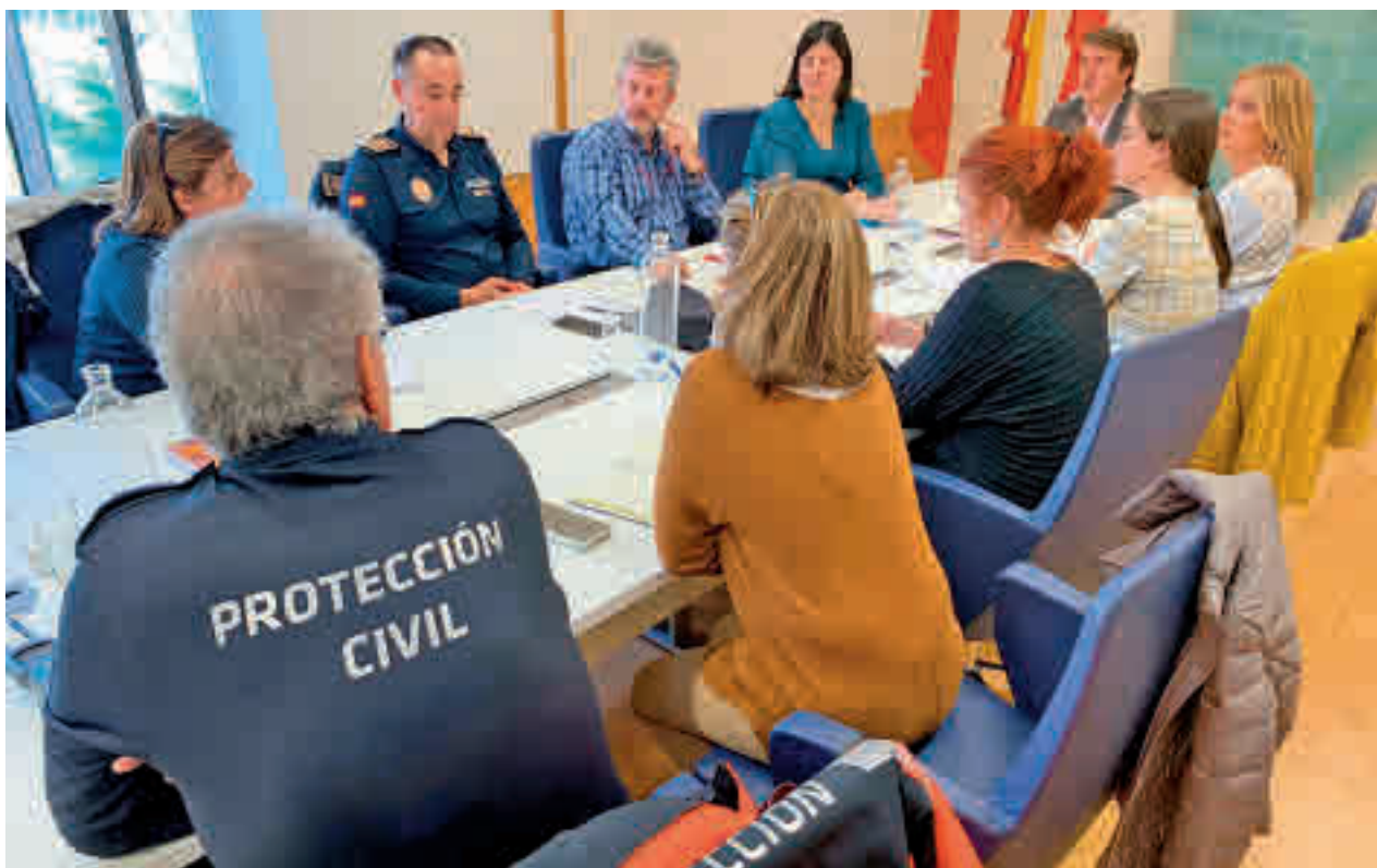
El Ayuntamiento ha creado un equipo de seguimiento de la situación