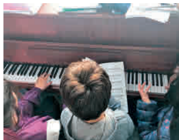
En Colmenar habrá talleres musicales

Las inscripciones estarán abiertas hasta el 27 de marzo, pudiéndose realizar por correo electrónico (a info@careacv.com ) o en la secretaría de Carea, aunque ese centro