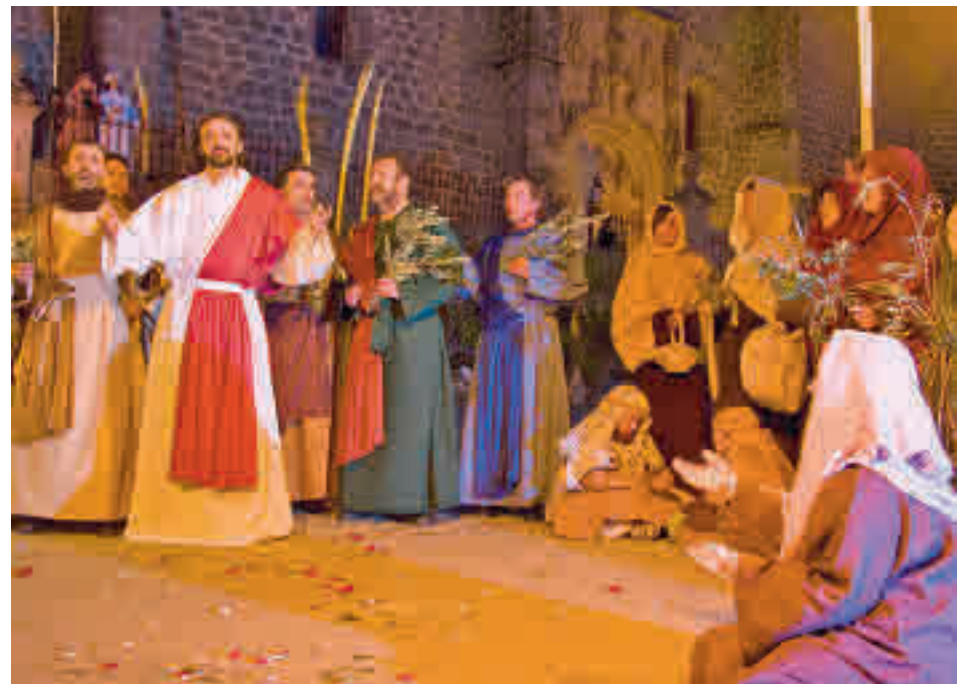
Edición pasada de la Pasión Viviente

El cierre del teatro municipal ha obligado a la Concejalía de Cultura a reprogramar los espectáculos suspendidos hasta el 5 de abril. Las nuevas fechas se pueden consultar en la web (ColmenarVie-