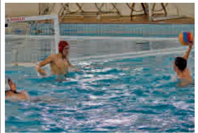
Una jugada del Tres Cantos

Por su parte, la EFS Colmenar Viejo viene de caer 2-5 frente a la AD Alcorcon, un resultado que no les ha ayudado a escalar posiciones, de forma que siguen penúltimos, en el decimoquinto puesto. Por detrás solamente está el Mejorada, con 9 unidades.