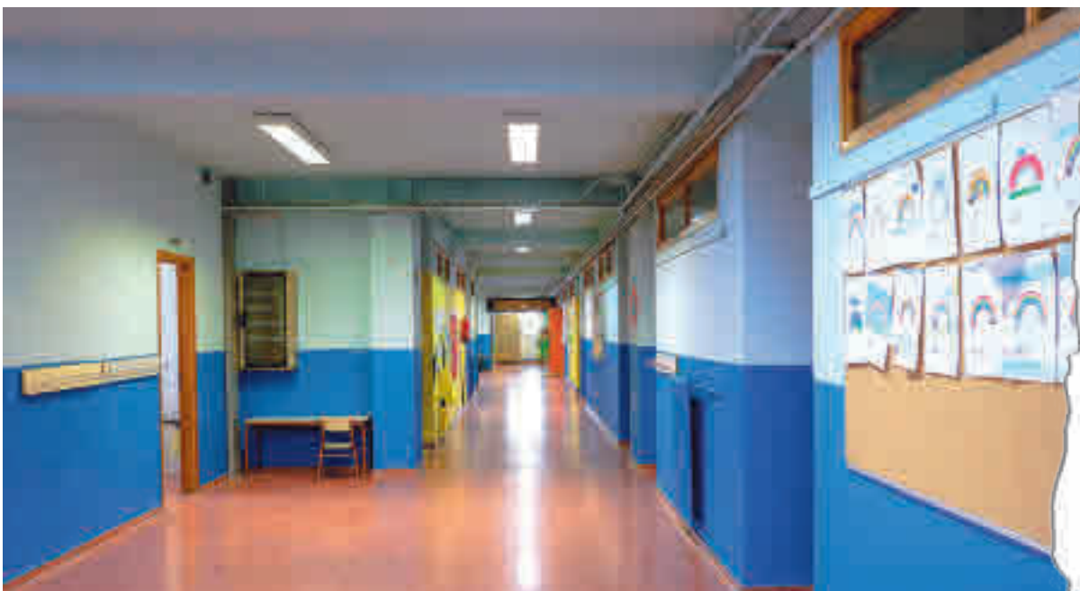
Todos los centros educativos de la región se han cerrado

La Comunidad de Madrid ha anunciado un plan especial para frenar el avance de este virus en la región ● Se multiplicará por tres la capacidad de los hospitales y se ha enviado a casa a 1,5 millones de estudiantes