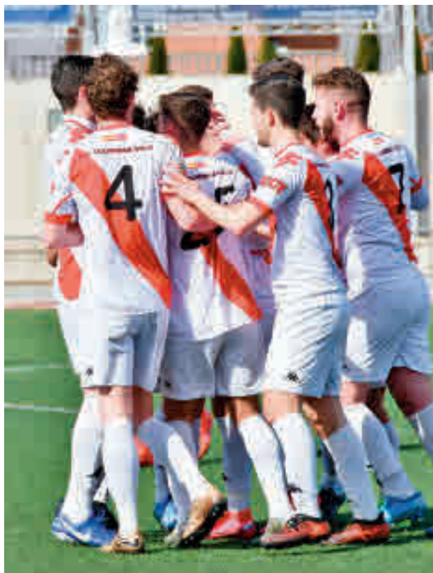
La AD Colmenar celebrando uno de sus goles

Sin embargo, la situación dio un paso más el miércoles,