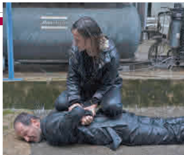
'Ofrenda a la tormenta', una de las producciones destacadas

Aunque la fiesta de Halloween queda ya lejos, los amantes del cine de terror se encontrarán con varios motivos para asistir a las salas de