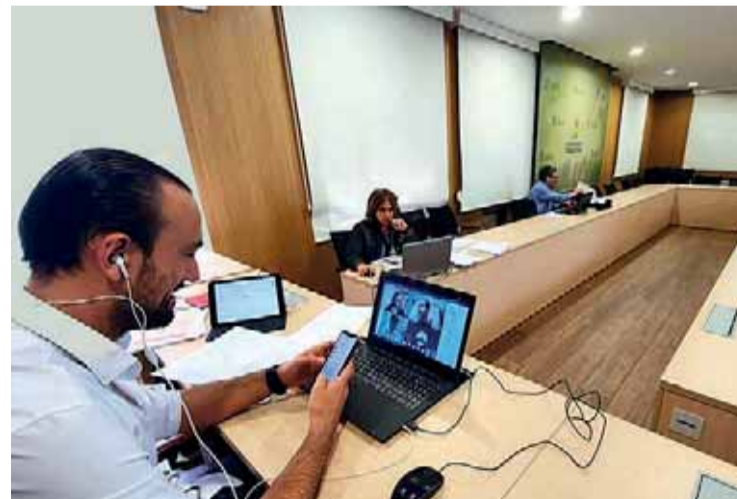
Pleno en el que se aprobó la incorporación del Ayuntamiento al Patronato de FIDBAN.

En la delegación de FIDBAN en Torrelavega se atenderá e informará a los emprendedores sobre las distintas posibilidades existentes para la financiación de sus proyectos y las condiciones para participar en las rondas naciona-