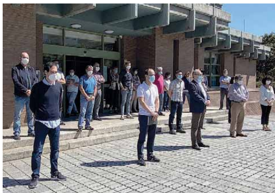
El rector de la UC y parte de su equipo guardaron un minuto de silencio ante el Pabellón de Gobierno.