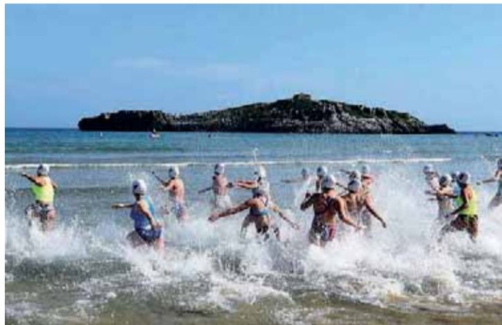
Imagen del Campeonato de España Infantil y Cadete #SOSNoja19.

brarán en la playa de Ris de Noja. La playas deberán disponer del suficiente espacio para cumplir con los requisitos de distanciamiento social que en las actuales circunstancias supone la instalación de carpas con una distancia mínima de dos metros y con una capacidad máxima para diez personas. También se suprimen las ceremonias de premios, por lo que las medallas se entregarán directamente a los responsables de los equipos. Además, se ha establecido una cuota de inscripción reducida para los clubes.