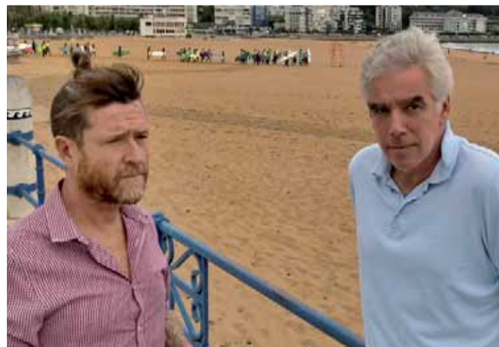
El PRC pondrá en marcha cuanta iniciativa sea necesaria para paralizar el derribo.

"Es de una desvergüenza total que en plena crisis sanitaria un Ministerio esté más pendiente en acelerar los plazos de la demolición de un edificio referente para la ciudad y eche por tierra un proyecto de gran envergadura que permitirá revitalizar el Sardinero y desestacionalizar el turismo a través de