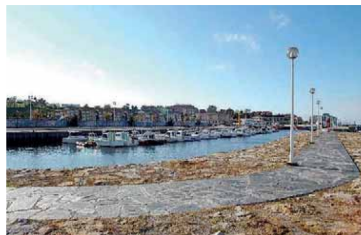
El aparcamiento de La Bárcena está ubicado junto al puerto suancino.

SUANCES | Gratuito y sin limitación horaria