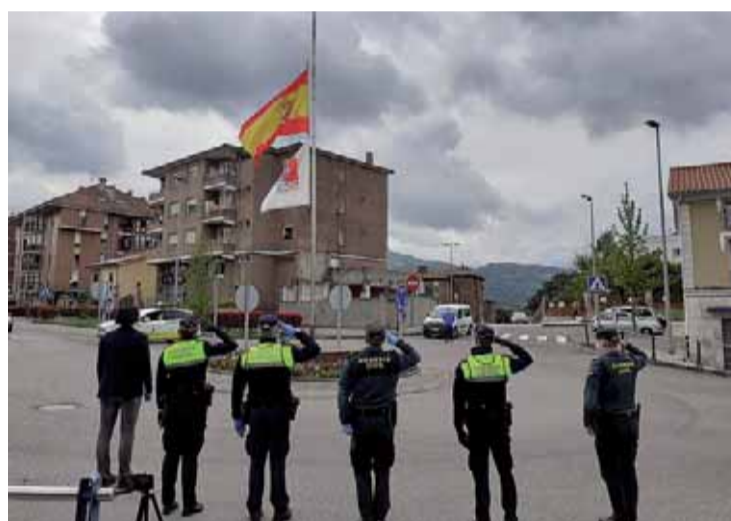
Homenaje a las víctimas en Astillero por parte del alcalde, policías y guardias civiles.