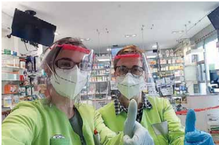
El trabajo se ha realizado en el Almacén de las Artes y en los domicilios de once vecinos.

por la empresa Arko se han sumado aportaciones de empresas, vecinos, centros escolares, como el Colegio Puente y la Asociación de Comerciantes CICAG. El Ayuntamiento, empresas y particulares han hecho también aportaciones de materiales plásticos y acetatos para poder dar cobertura a la gran demanda de material provocada por la crisis del coronavirus.