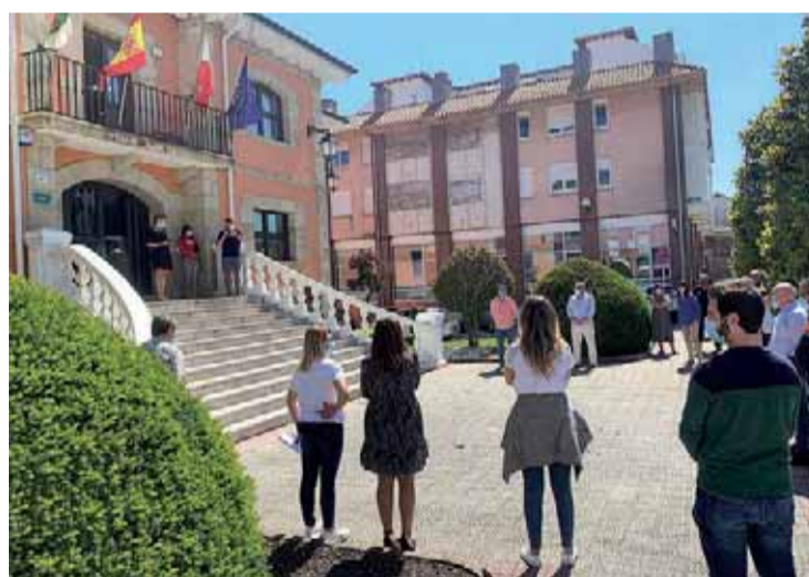
Miembros de la Corporación Local y vecinos de Piélagos se sumaron al minuto de silencio.