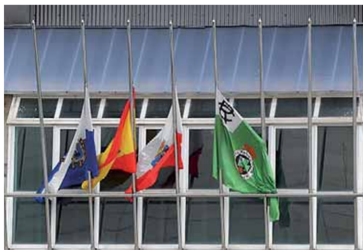
Las banderas ondean a media asta en la sede del Racing en honor a las víctimas.