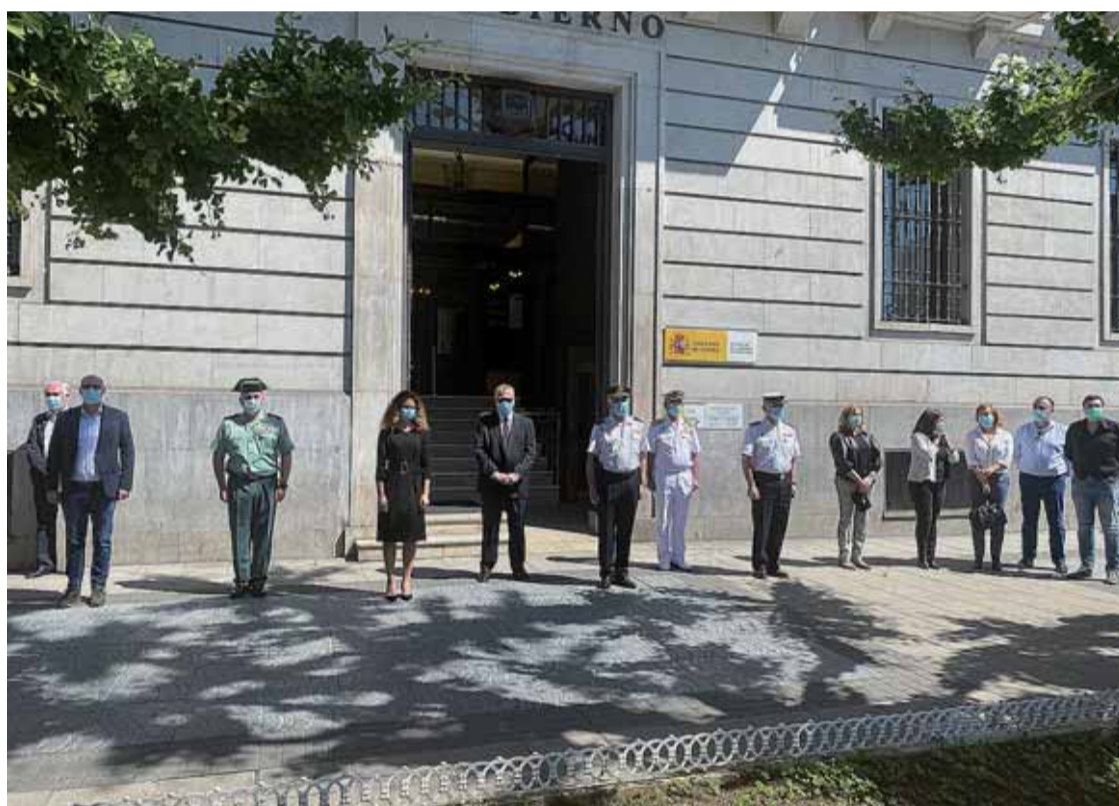
La delegada del Gobierno, diputados regionales y miembros de las FCCSE, durante el minuto de silencio que tuvo lugar el miércoles.

Hasta el 6 de junio, las banderas de los edificios oficiales ondearán a media asta en cumplimiento de los diez días de luto oficial que comenzaron a las 12:00 horas del miércoles con un minuto de silencio en señal de respeto y homenaje a las víctimas del covid-19. Instituciones, tanto públicas como privadas y ciudadanos de Cantabria se suman al reconocimiento en el luto oficial más largo de la historia del país.