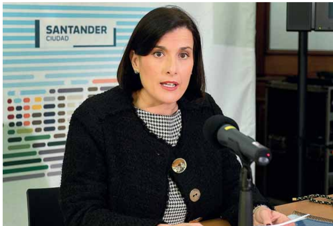
La alcaldesa de Santander durante la rueda de presentación de “Santander a punto”.