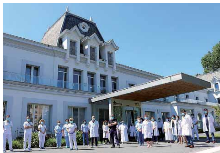
El personal sanitario del Hospital Santa Clotilde se sumó al homenaje a las víctimas realizado el miércoles.