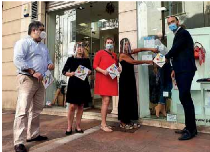
El alcalde y el presidente de la Cámara de Comercio presentaron la campaña.