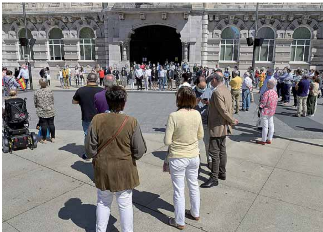
Santander se sumó al homenaje a las víctimas del covid-19 llevado a cabo en la Plaza del Ayuntamiento, con la Corporación al frente.