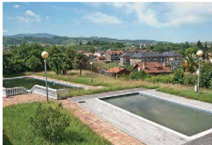
El Ayuntamiento aprovechará para realizar mejoras en ambas instalaciones.