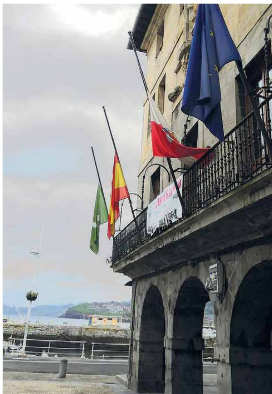
También las banderas del Ayuntamiento de Castro Urdiales lucen a media asta durante el luto oficial.