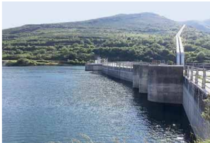
El embalse de Elsa volverá a abastecer de agua a Santander este verano.

Por ello, instó tanto al Gobierno de Cantabria como al de España a "buscar una solución definitiva con el fin de evitar que todos los veranos se tenga que reclamar