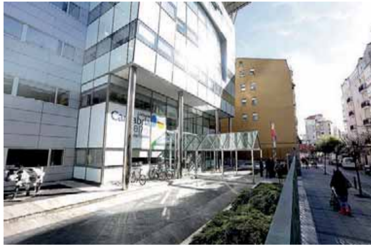
La OEP incluye 499 plazas de personal funcionario y 259 de promoción interna.

Se trata de un volumen de aspirantes en el que se considera viable la adopción de medidas preventivas adecuadas para su celebración en