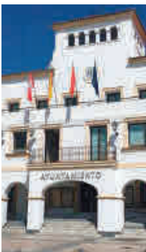
Ayuntamiento de Sanse