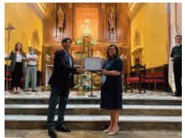
El presidente del club y la presidenta de la Hermandad