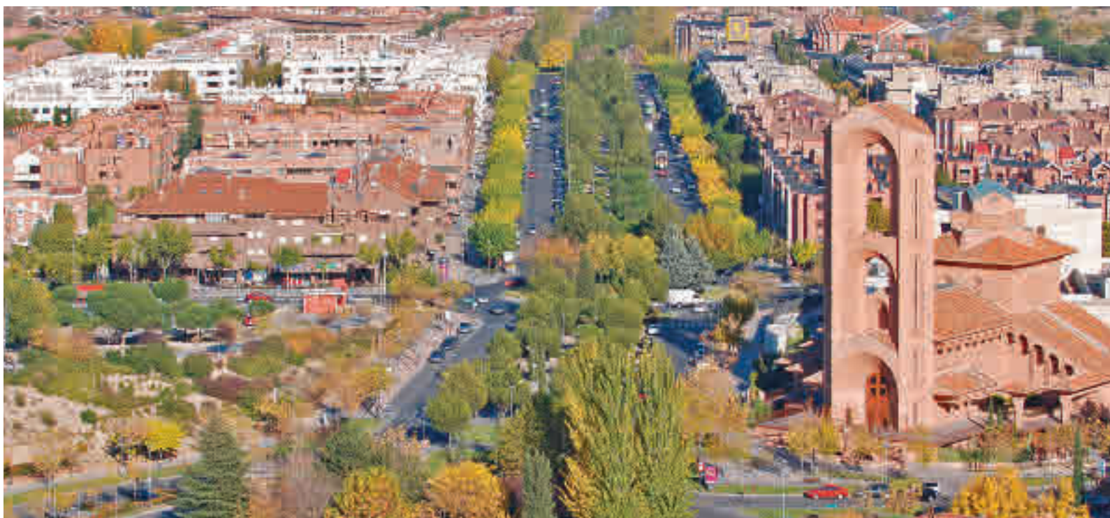
Vista aérea de Pozuelo de Alarcón, la ciudad con mayor renta anual de España