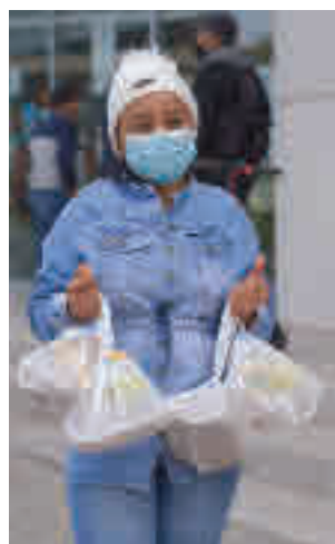
Campaña de alimentos

Bajo el lema 'Ningún hogar sin alimentos', se ha impulsado una campaña de