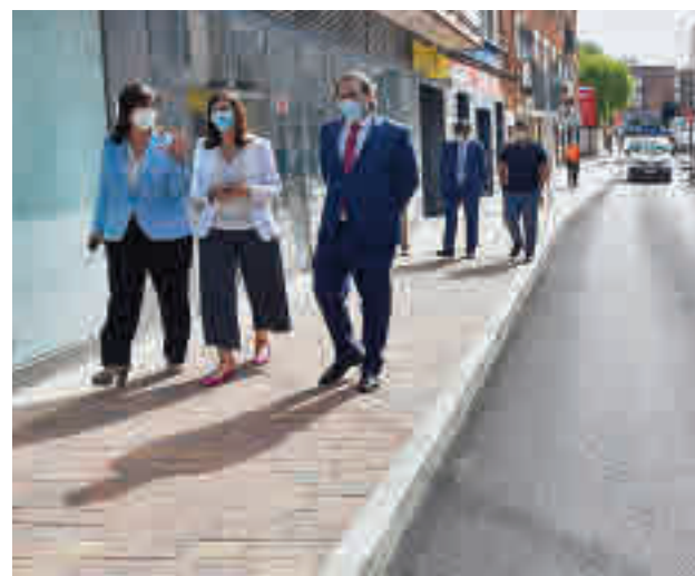
La alcaldesa visitó esta semana la calle Sagunto

Más información de los municipios en nuestra web