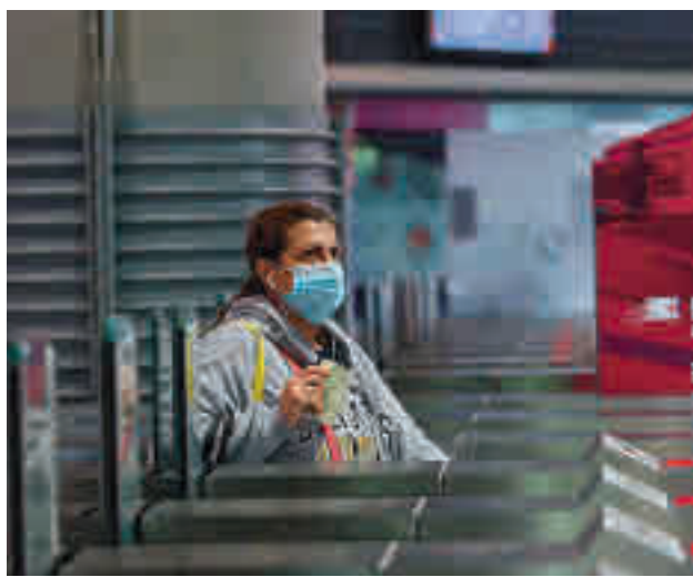
Estación de Cercanías de Atocha GENTE

Madrid es la quinta provincia más afectada, solo por detrás de Soria, Cuenca, Segovia y Albacete.