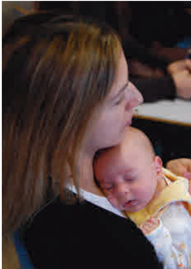
Boadilla vuelve a ofrecer ayudas para fomentar la natalidad

Los requisitos para optar a dichas subvenciones son tener nacionalidad española o extranjera con residencia le-