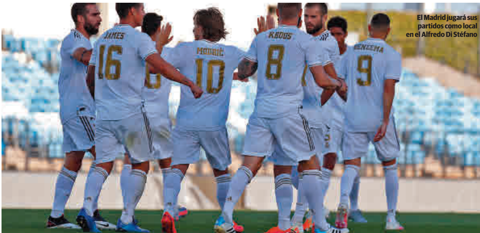
El Madrid jugará sus partidos como local en el Alfredo Di Stéfano