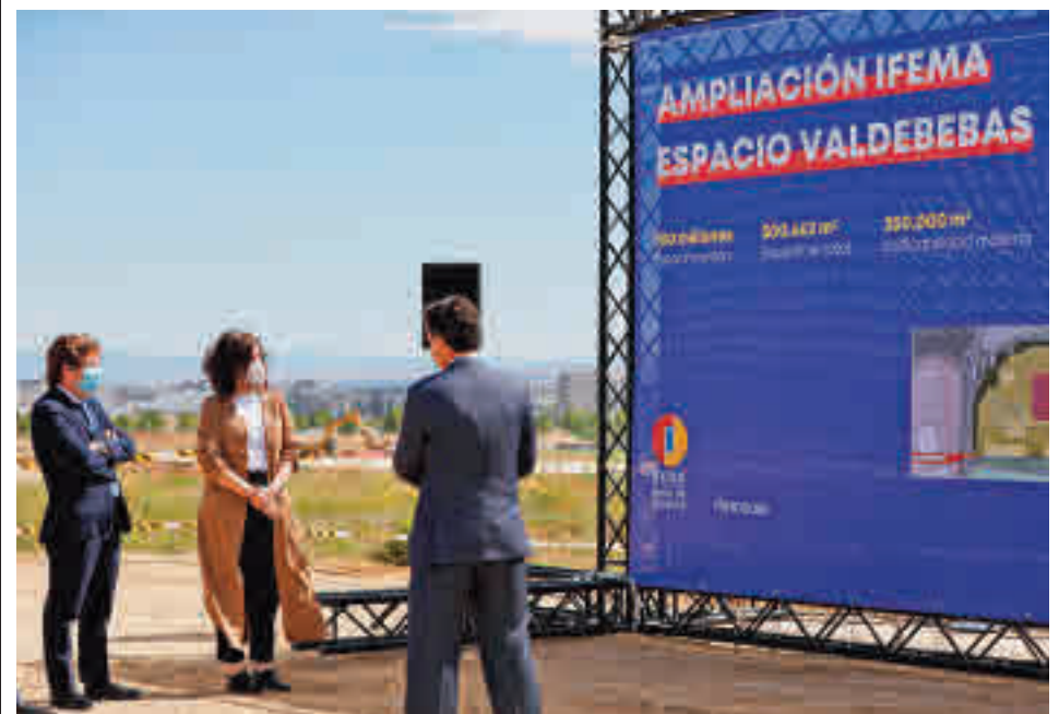
Martínez-Almeida y Díaz Ayuso, en la presentación de la ampliación de Ifema

JUSTO AL LADO SE LEVANTARÁ EL NUEVO HOSPITAL DE PANDEMIAS CON MIL CAMAS