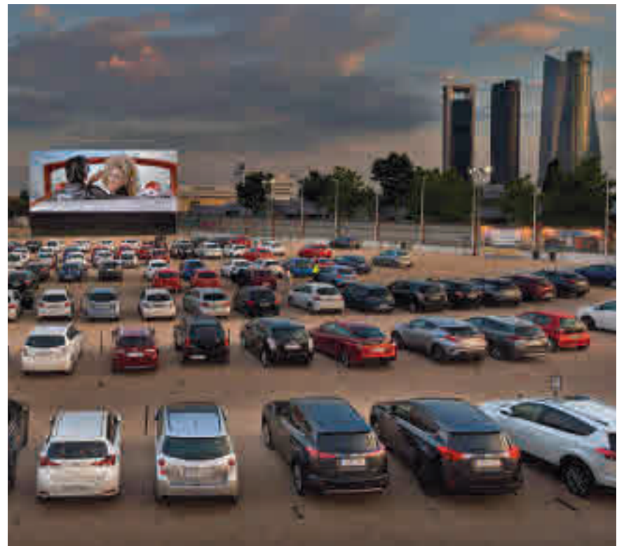
UNA OPORTUNIDAD EN PLENA CRISIS: No todo han sido malas noticias para las salas de cine en las últimas semanas. Las particularidades del Autocine Madrid le han permitido abrir sus puertas antes que la competencia. Lo hizo con la emisión de un clásico: 'Grease'.