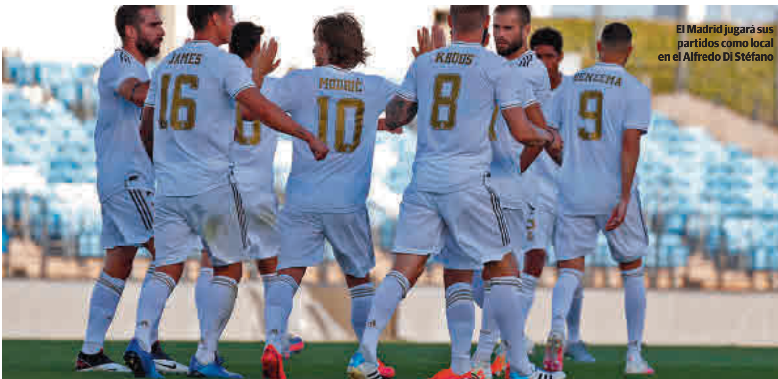
El Madrid jugará sus partidos como local en el Alfredo Di Stéfano