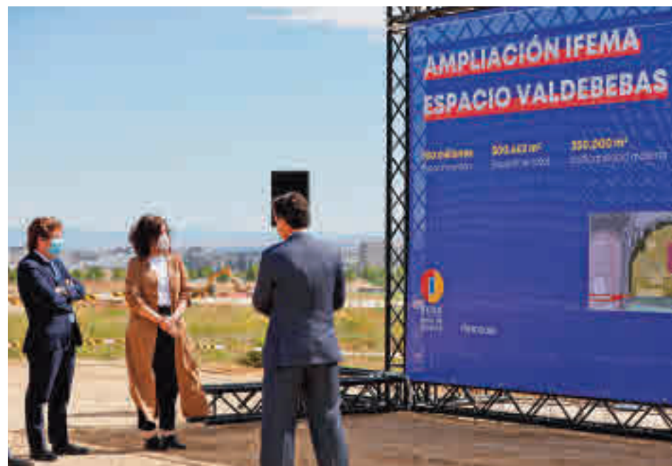
Martínez-Almeida y Díaz Ayuso, en la presentación de la ampliación de Ifema

JUSTO AL LADO SE LEVANTARÁ EL NUEVO HOSPITAL DE PANDEMIAS CON MIL CAMAS