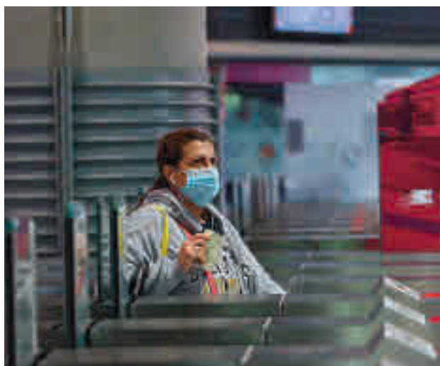
Estación de Cercanías de Atocha GENTE

Madrid es la quinta provincia más afectada, solo por detrás de Soria, Cuenca, Segovia y Albacete.