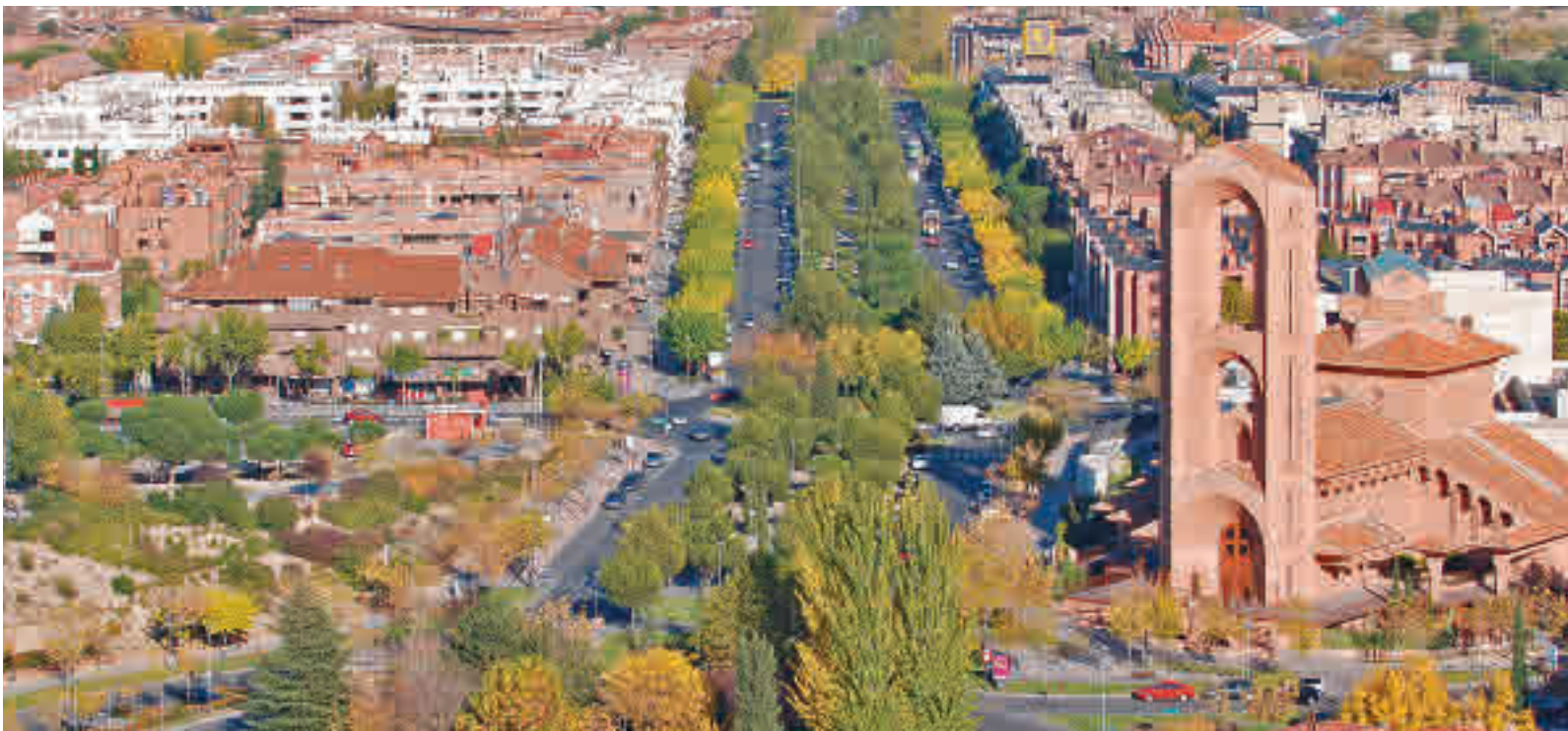
Vista aérea de Pozuelo de Alarcón, la ciudad con mayor renta anual de España