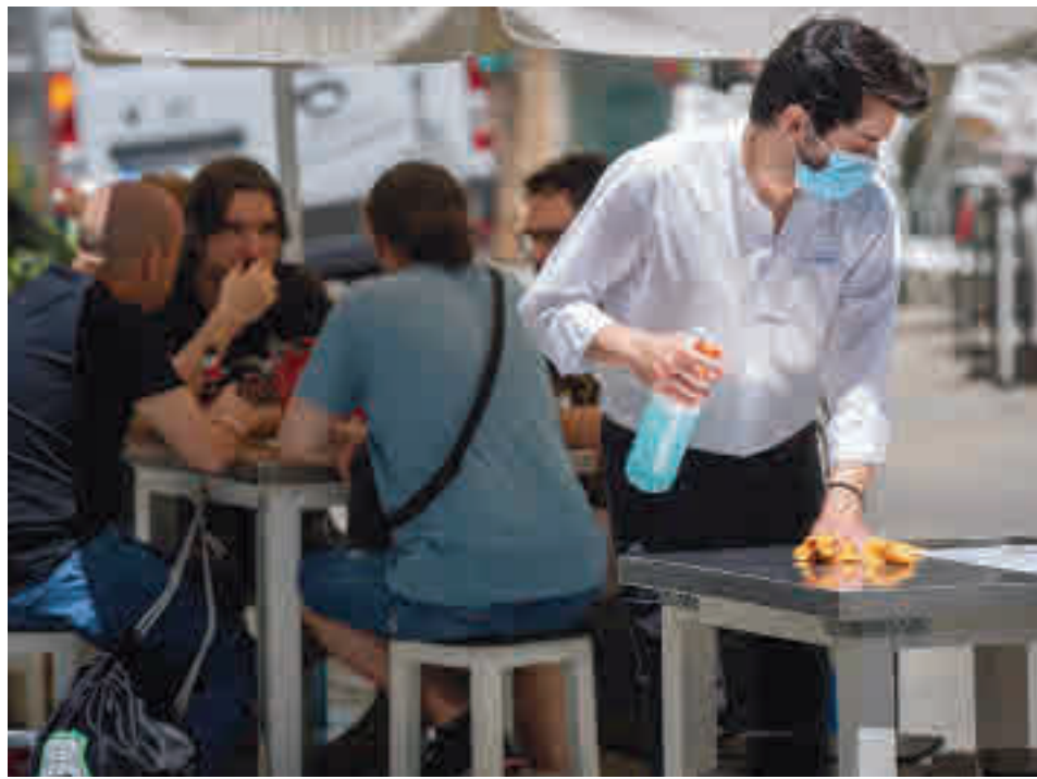
Terrazas de la Comunidad de Madrid en Fase 2

El Ejecutivo regional tendrá que valorar, “seguramente” en el próximo Consejo de Gobierno, “qué nivel de desesca-