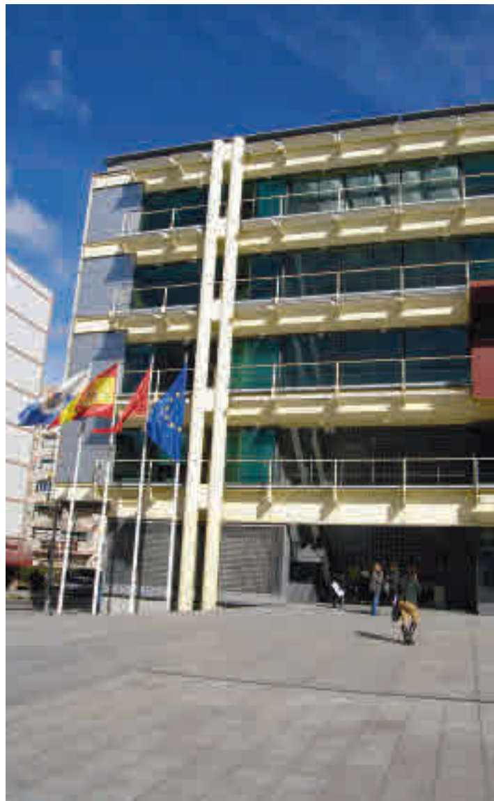
Ayuntamiento de Fuenlabrada

empresas con domicilio fiscal y centro de trabajo en Fuenlabrada que se hayan visto afectados por el cierre temporal durante el Estado de Alarma, siempre que tengan hasta 10 trabajadores y no superen los 2 millones de euros de ingresos. Además, se tienen que haber acogido a la prestación por cese de activi-