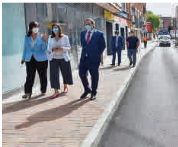
La alcaldesa visitó esta semana la calle Sagunto

Entre los trabajos que se van a llevar a cabo en las próximas semanas destacan la instalación de sendas cubiertas sobre las pistas deportivas de El Cantizal y La Encina, la colocación de una pérgola que cubrirá el espacio entre el gimnasio y el centro infantil en el centro San Miguel, o la instalación de ventiladores en las aulas del colegio Los Olivos.