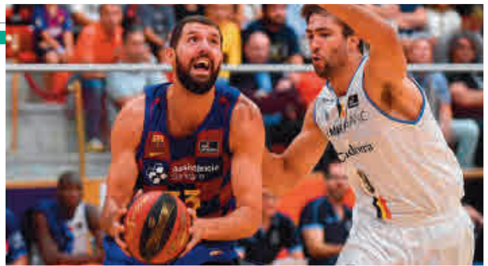
Nikola Mirotic, el referente del líder de la fase regular, el Barça

grupo. Dichos encuentros se jugarán el domingo 28 (17 y 20 horas), mientras que la gran final está programada para el martes día 30 a las 20 horas).