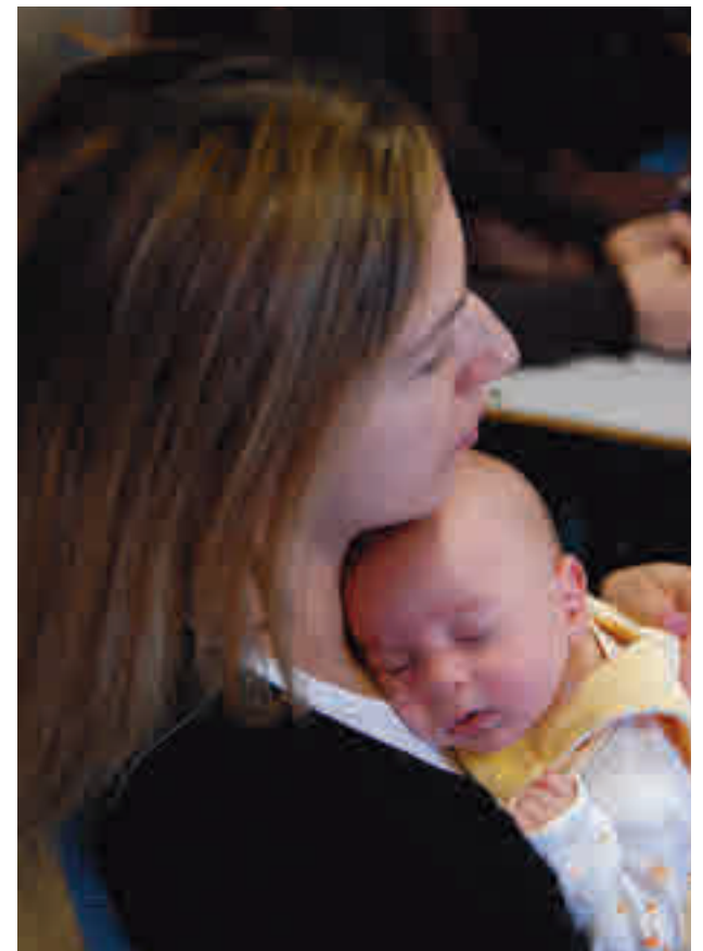
Boadilla vuelve a ofrecer ayudas para fomentar la natalidad

Los requisitos para optar a dichas subvenciones son tener nacionalidad española o extranjera con residencia le-