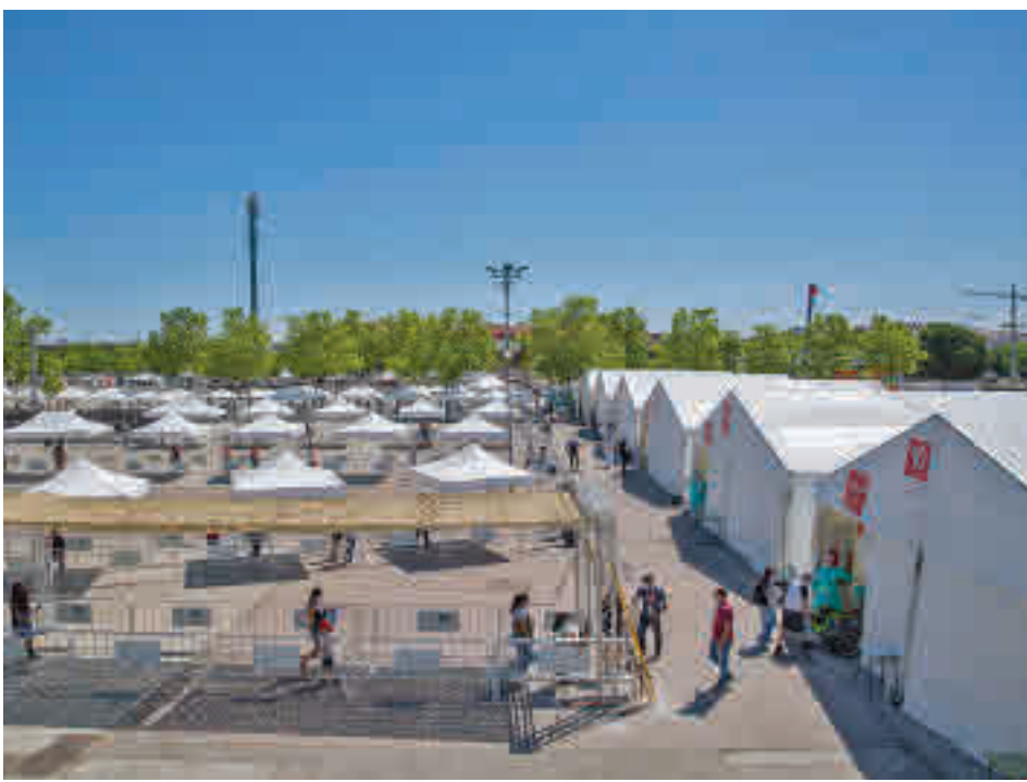
Los habitantes fueron convocados en función del orden alfabético de sus apellidos