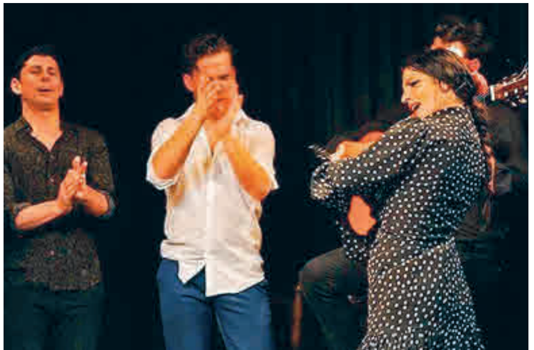
UN SOS DESDE EL FLAMENCO: Uno de los estilos musicales con mayor arraigo en nuestro país y que supone todo un polo de atracción turístico, el flamenco, no vive sus mejores momentos. La Asociación Nacional de Tablaos Flamencos de España ha pedido al Gobierno un plan de ayuda ante el riesgo de desaparición, un peligro que ya ha sufrido en sus propias carnes el mítico Casa Patas de Madrid, que echa el cierre tras 36 años.

Un poco más sombrío se dibuja el horizonte en Madrid respecto a otros ámbitos rela-