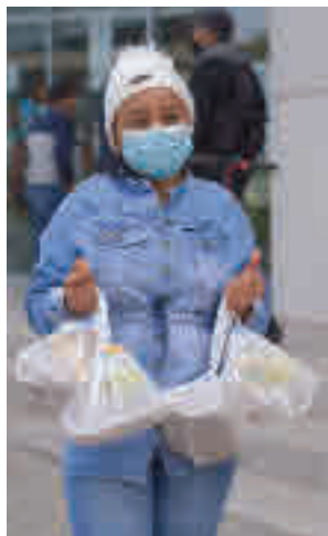
Campaña de alimentos

Bajo el lema 'Ningún hogar sin alimentos', se ha impulsado una campaña de