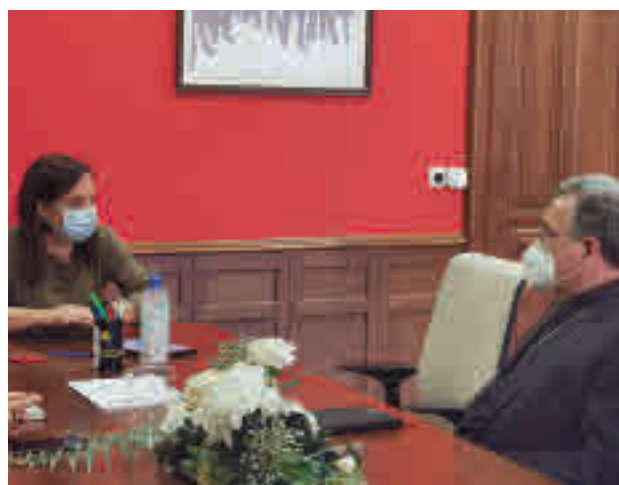
La alcaldesa se reunió con el obispo

En abril la Diócesis de Getafe abrió un comedor social en una parroquia. Esta dotación llevaba meses negociándose, pero se aceleró ante la crisis social y sanitaria.