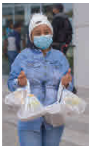
Campaña de alimentos

Bajo el lema 'Ningún hogar sin alimentos', se ha impulsado una campaña de