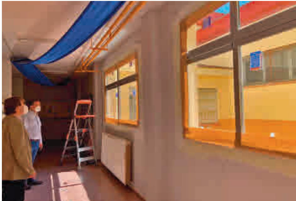
El alcalde visitó algunas de las obras que ya han comenzado

También se repondrán todas las ventanas de Infantil en el Ciudad de Columbia, entre otras mejoras en huertos, como los del Nejapa y