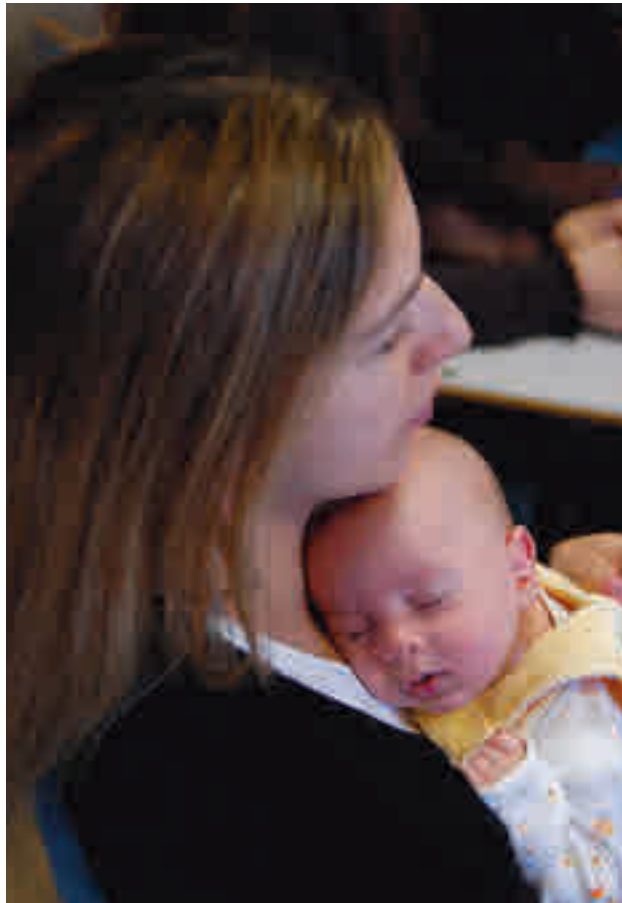
Boadilla vuelve a ofrecer ayudas para fomentar la natalidad

Los requisitos para optar a dichas subvenciones son tener nacionalidad española o extranjera con residencia legal en España; ser propietario o