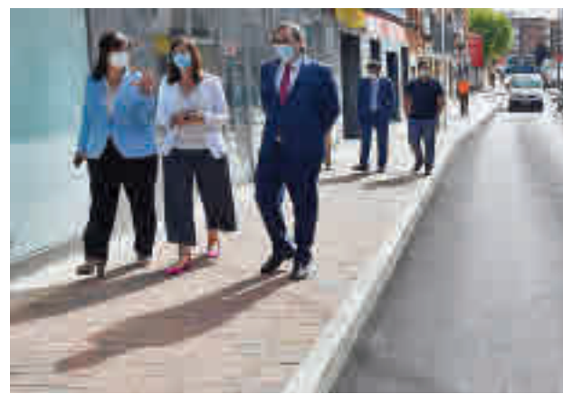
La alcaldesa visitó esta semana la calle Sagunto

Según explicó el Consistorio en un comunicado, para controlar esta afluencia el espacio ha sido delimitado y señalizado, con una única entrada y salida.