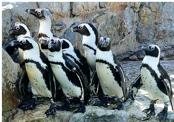
La moción pide que los animales sean reubicados en entornos más adecuados.

En el documento se argumenta que los animales del minizoo “están en espacios que no cumplen unos mínimos suficientes para garantizar su bienestar, además de no tener una finalidad útil para la sociedad o para los animales allí albergados, no respondiendo a fines de conservación de las especies representadas o a fines edu-