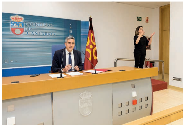
Pablo Zuloaga en la rueda de prensa celebrada tras el Consejo de Gobierno.

Zuloaga afirmó la aprobación del ingreso mínimo vital por parte del Gobierno de España es “una buena noticia para Cantabria”, que “blinda la dignidad, la igualdad y los derechos de las personas”, y que además “supone aliviar una parte del presupuesto autonómico” que se destina a la renta social básica, dado que “ambas indemnizaciones son incompatibles”. A preguntas de los medios en la rueda de prensa posterior al Consejo de Gobierno, el vicepresidente señaló que ese dinero se destinará al desarrollo de políticas sociales.