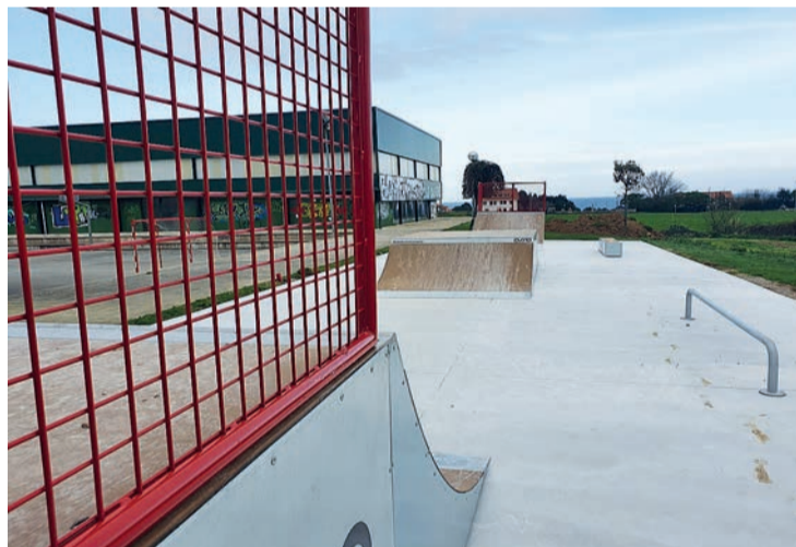
La nueva instalación tiene un total de cinco elementos para la práctica del skate.

Los trabajos han consistido en la definición geométrica de los diferentes elementos y áreas; la ejecución de la solera; el suministro y montaje de los módulos de skate; la revegetación del