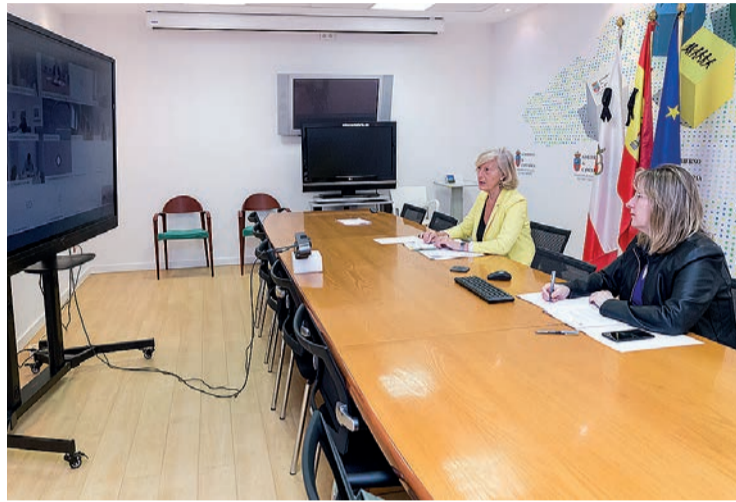
Lombó y García durante la reunión telemática de la Sectorial de Educación.

“Es verdad que el desafío es enorme, que las dificultades son muchas y que conllevará el trabajo in-