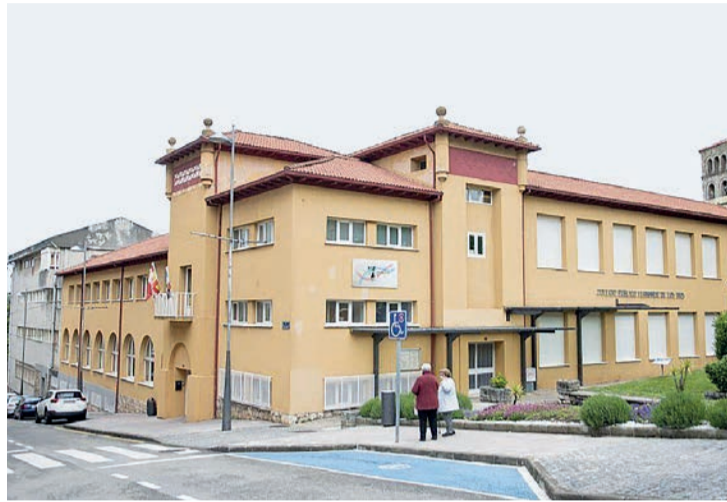
El vale es cajeable por material curricular y no curricular en las entidades adheridas.

Las ayudas buscan promover el principio de igualdad en el ejercicio del derecho a la educación y compensar a las familias para hacer frente a los gastos derivados de la vuelta al cole. Además, se fomenta el comercio local a través del convenio que se va a suscribir con aquellos establecimientos comerciales del municipio que ten-