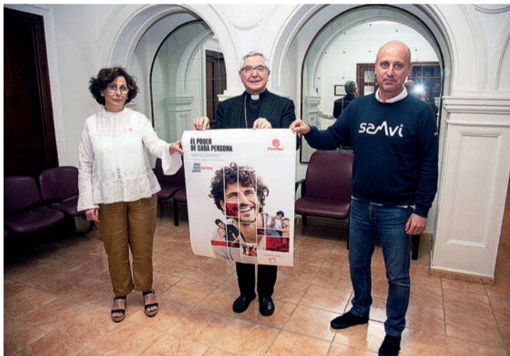
Representantes de Cáritas, junto al Obispo, presentaron los datos.

SOLIDARIDAD | A causa de la crisis derivada del covid-19