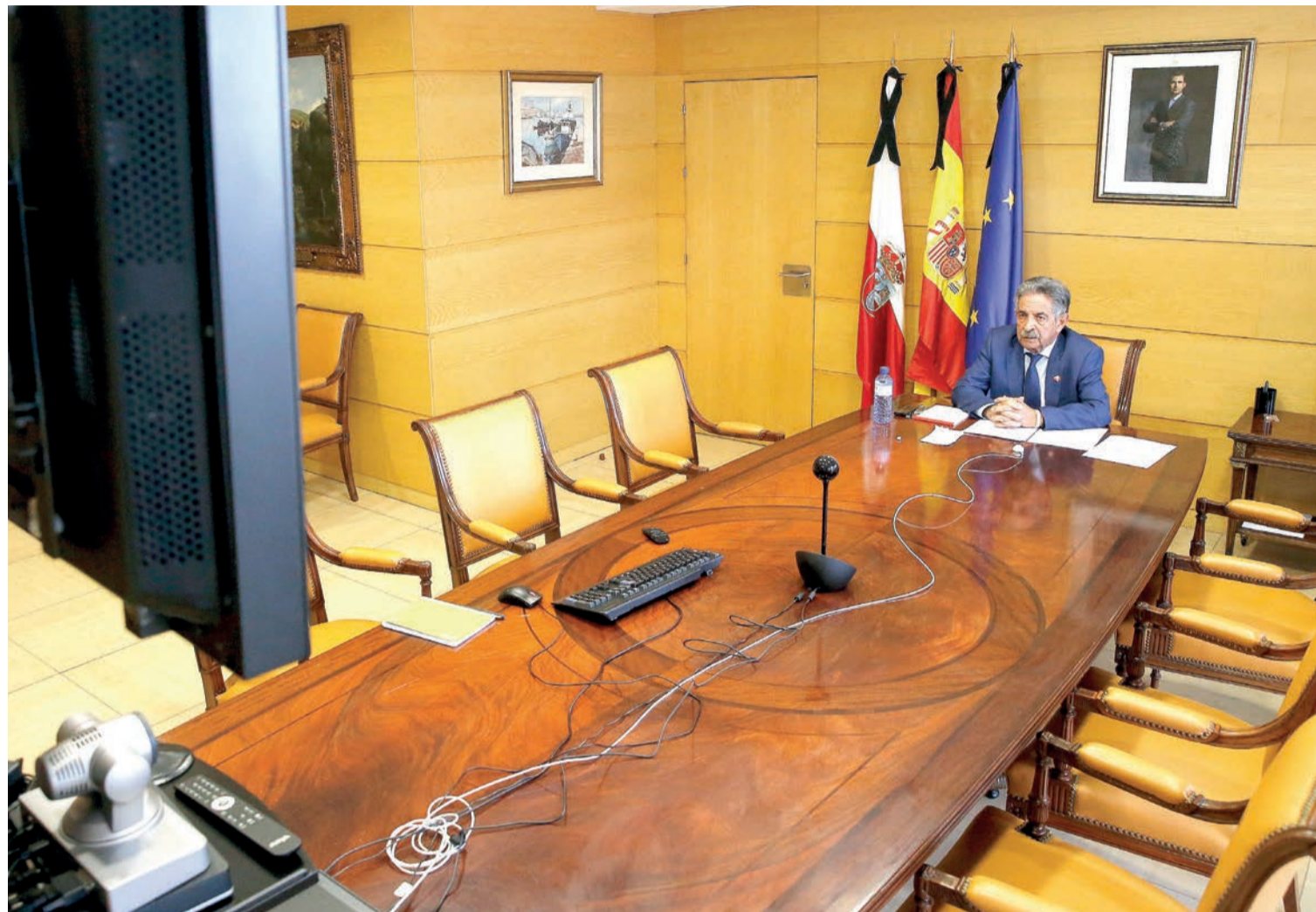
El presidente Revilla comunicó al lehendakari, Íñigo Urkullu, y al presidente asturiano, Adrián Barbón, su decisión de esperar a ver los datos de la evolución sanitaria de los focos vascos.

En este sentido, sostuvo que "una semana antes o después no puede cambiar mucho las cosas" porque las regiones que el día 21 es-