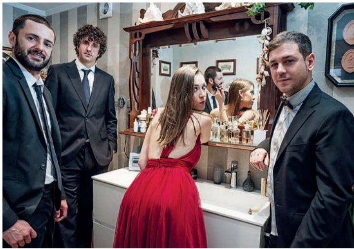
La banda, de reciente formación, tiene cinco videoclips publicados.