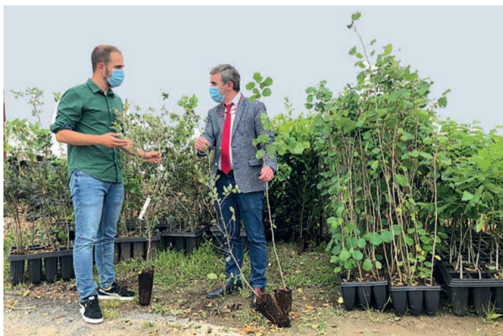
Solo se admitirán un máximo de tres tickets o facturas por persona.

La inscripción puede realizarse a través del correo electrónico casaculturadepuente-sanmiguel@yahoo.es o de forma presencial en la Casa de Cultura de Puente San Miguel.