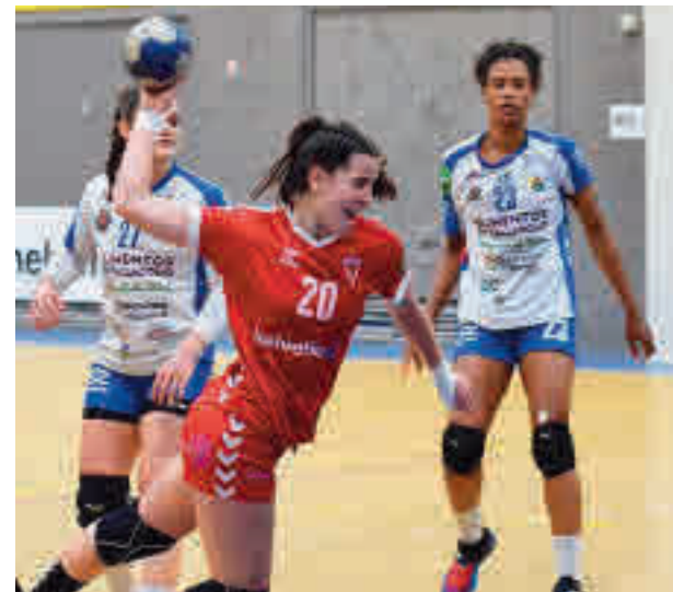
El BM Alcobendas femenino no seguirá en la élite