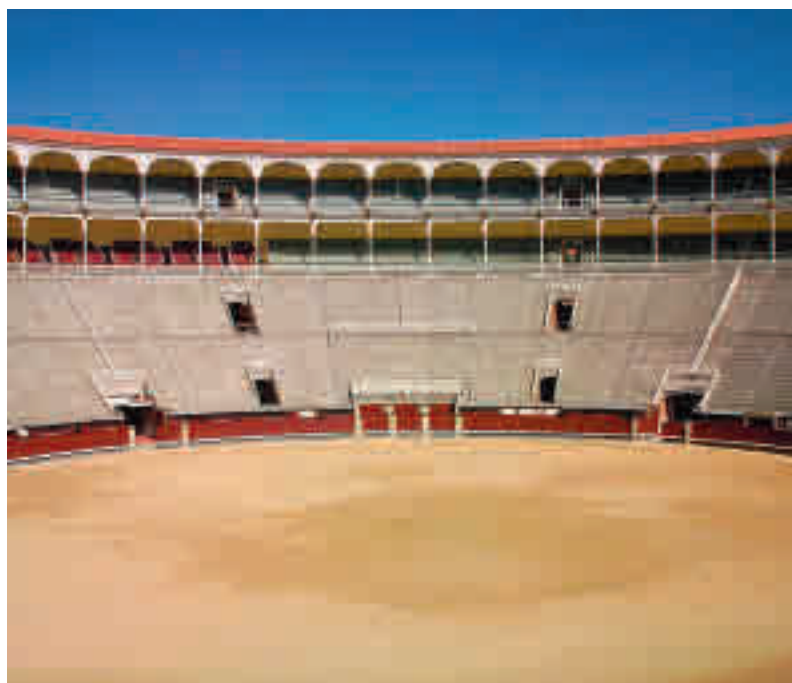
La plaza de Las Ventas no ha acogido esta temporada la Feria de San Isidro

Esas medidas precisamente son las que está abordando el Gobierno de la Comunidad de Madrid. La presidenta regional, Isabel Díaz Ayuso, se reunió recientemente con representantes del mundo taurino para tomar medidas de alivio fiscal, inci-