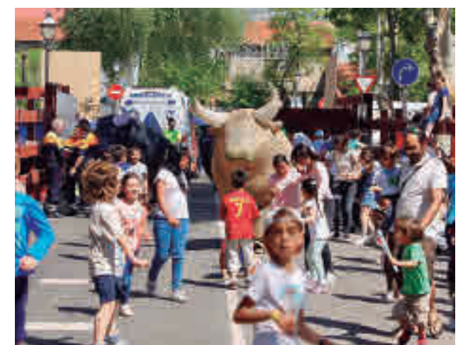
Fiestas de Las Rozas

El regidor señaló que la intención del Ejecutivo es dedicar todo el presupuesto de los festejos a políticas sociales en la localidad.