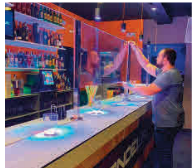
Local de ocio nocturno en Madrid

Habrà que establecer en el interior los espacios que ocuparán los diferentes grupos que accedan al interior y se recomienda emplear vasos desechables y priorizar el pago con tarjeta de crédito. La barra se tendrá que organizar para que no se produzcan aglomeraciones.