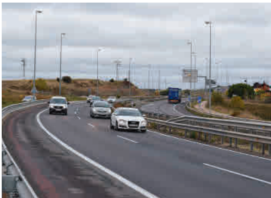
Lavado de cara para la carretera que une Tres Cantos y Colmenar GENTE

Dichas reservas online se podrán pedir siete días antes de la entrada, con límite de un ticket de adulto y dos de menores de edad por usuario. Los precios oscilan entre los 2,9 euros y los 16, 2.