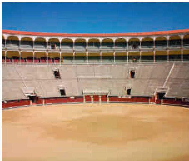
La plaza de Las Ventas no ha acogido esta temporada la Feria de San Isidro

Esas medidas precisamente son las que está abordando el Gobierno de la Comunidad de Madrid. La presidenta regional, Isabel Díaz Ayuso, se reunió recientemente con representantes del mundo taurino para tomar medidas de alivio fiscal, inci-