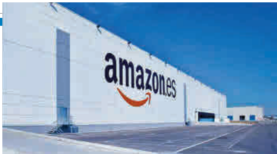
Amazon refuerza su presencia en el Corredor del Henares