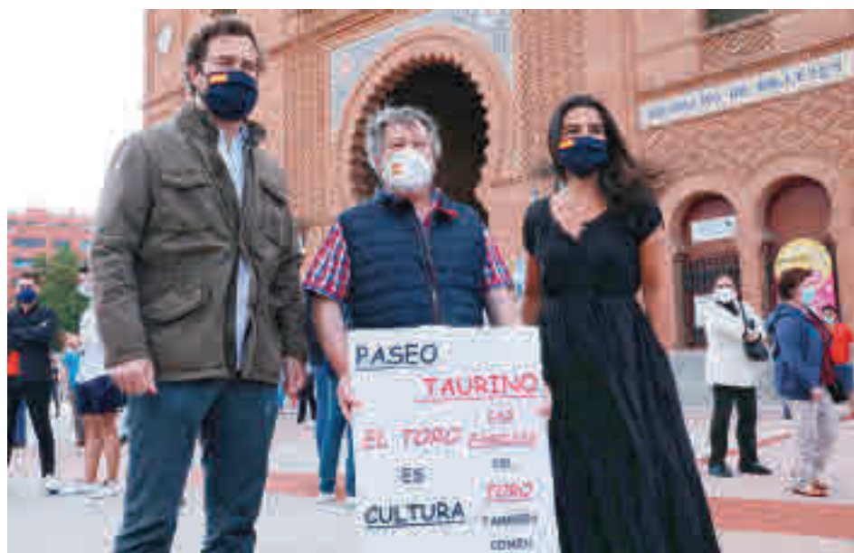
‘PINCHAZO’ DE UNA INICIATIVA: el pasado sábado 13 de junio estaba convocado un paseillo por diferentes ciudades para reivindicar la fiesta de los toros. Por ejemplo, en Sevilla se estima que participaron unas 2.000 personas. En Madrid, la iniciativa no se pudo llevar a cabo, después de que la Delegación del Gobierno no la permitiera, asegurando que se había presentado “fuera de plazo”.

MIGUEL ABELLÁN: “ES IMPOSIBLE RECUPERARSE DE ESTA SANGRÍA ECONÓMICA”