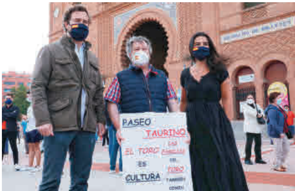
‘PINCHAZO’ DE UNA INICIATIVA: el pasado sábado 13 de junio estaba convocado un paseillo por diferentes ciudades para reivindicar la fiesta de los toros. Por ejemplo, en Sevilla se estima que participaron unas 2.000 personas. En Madrid, la iniciativa no se pudo llevar a cabo, después de que la Delegación del Gobierno no la permitiera, asegurando que se había presentado “fuera de plazo”.