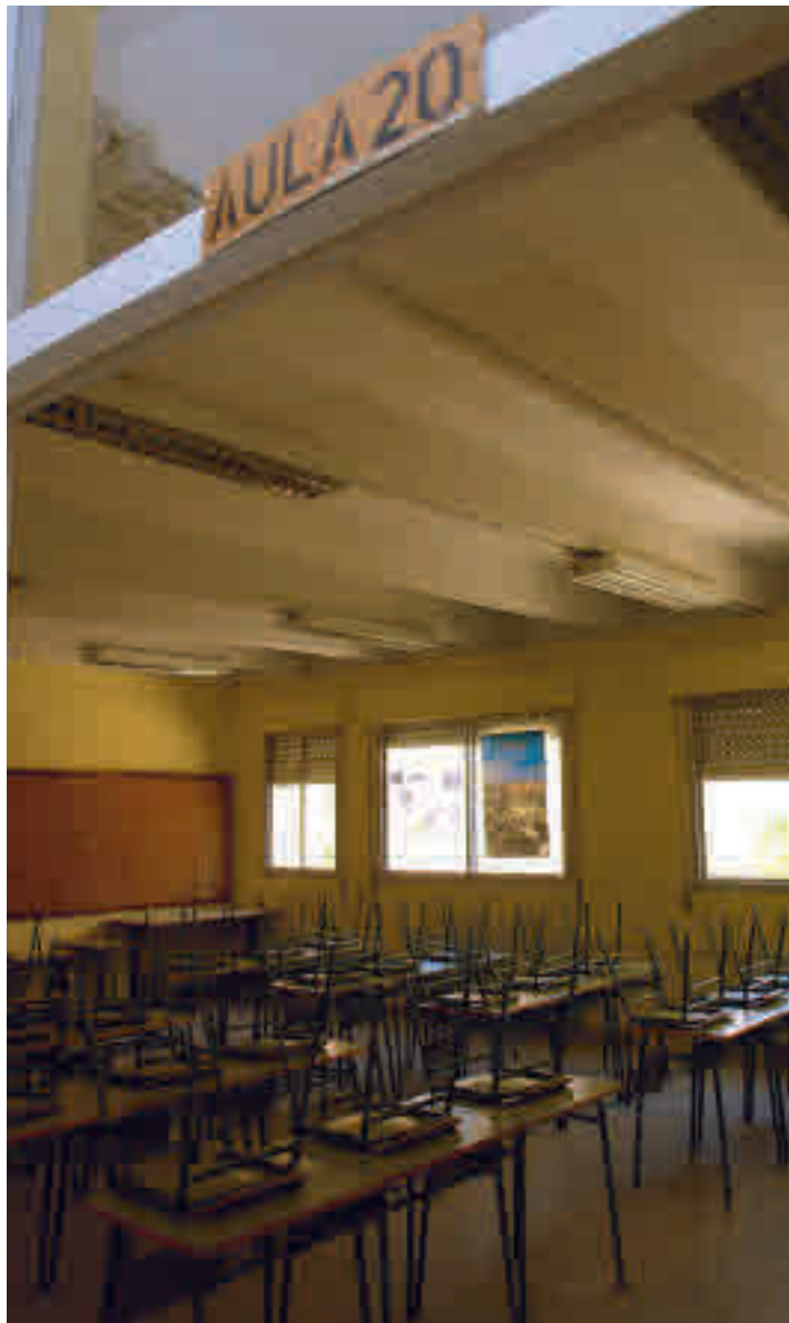
Las aulas volverán a llenarse a partir de septiembre

mascarilla y guardar una distancia de seguridad de 1,5 metros a partir de quinto de Primaria. En los cursos inferiores no serán necesarias esas restricciones, pero habrá que formar 'grupos estables' de 15 a 20 alumnos que solo se relacionen entre ellos y no tengan contacto con el