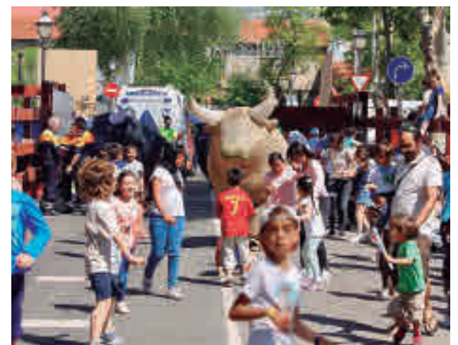
Fiestas de Las Rozas

El regidor señaló que la intención del Ejecutivo es dedicar todo el presupuesto de los festejos a políticas sociales en la localidad.