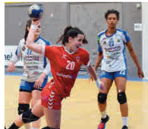
El BM Alcobendas femenino no seguirá en la élite