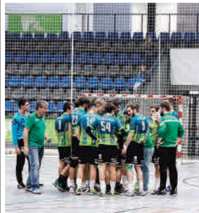
El Ikasa lideraba el Grupo F de la Primera Nacional