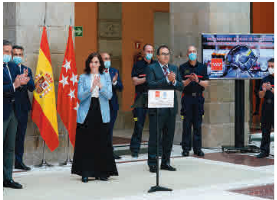
Firma del convenio entre la Comunidad y el Ayuntamiento

Esta integración supone, según indica el Ejecutivo regional, una mejora importante para la prestación del servicio al ciudadano por varios moti-