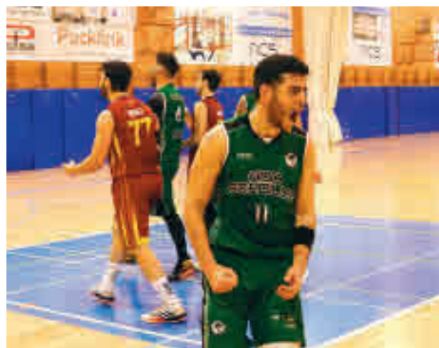
Boadilla tendrá un equipo en la Liga EBA

Así, tras las negociaciones llevadas a cabo por las federaciones de Canarias, Castilla-La Mancha y Madrid, la próxima temporada, la Conferencia B de la Liga EBA estará