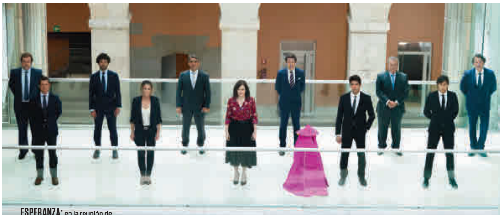
ESPERANZA: en la reunión de Díaz Ayuso con representantes del toreo se habló de la posible celebración de la Feria de Otoño

SIN SAN ISIDRO, MADRID HA DEJADO DE INGRESAR 70 MILLONES