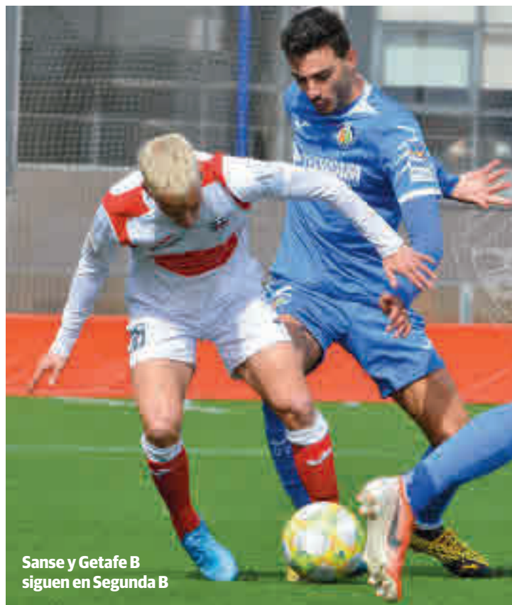
Sanse y Getafe B siguen en Segunda B

nencia estaba a tiro de 15 puntos cuando solo quedaban por jugarse 10 jornadas.