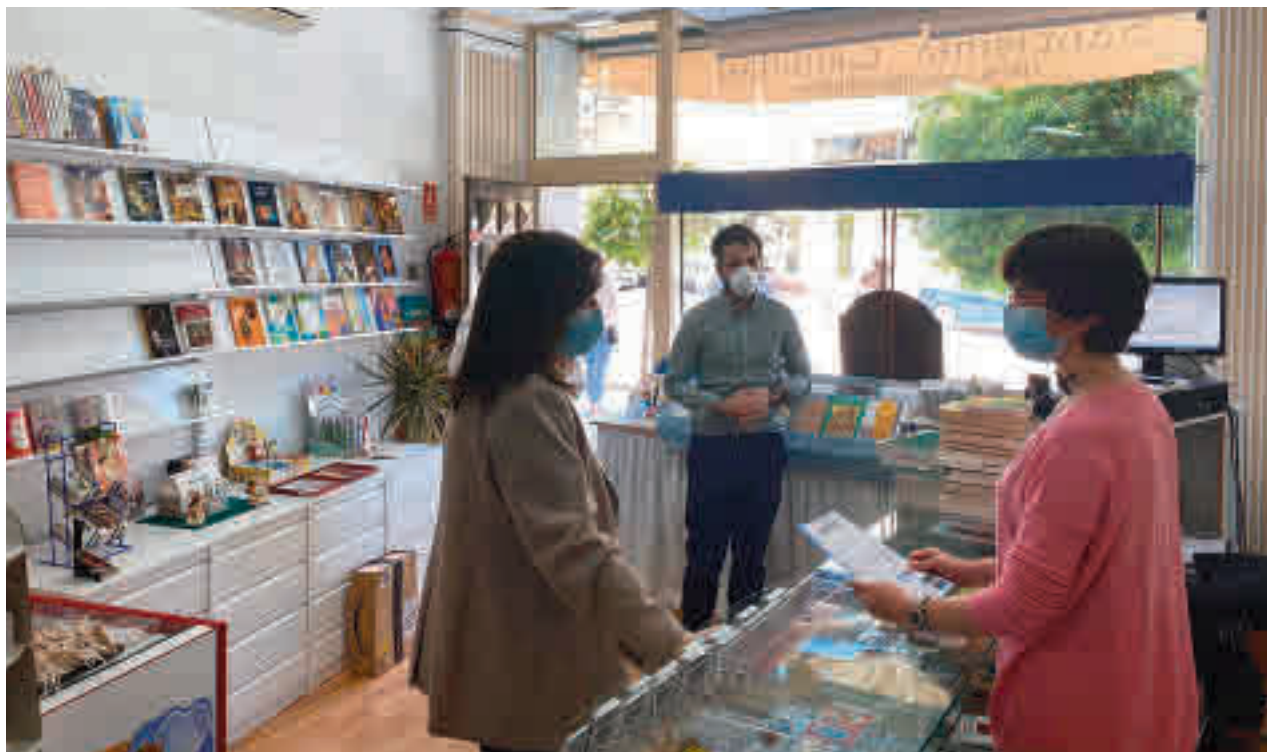
Comercios en Pozuelo de Alarcón

El Ayuntamiento de Pozuelo de Alarcón presentó hace unas semanas su plan de apoyo económico al sector de la hostelería y empresarial para tratar de paliar los efectos que haya ocasionado esta crisis sanitaria. De hecho, el Consistorio invertirá 3,5 millones de euros (una