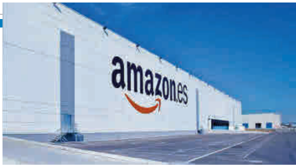
Amazon refuerza su presencia en el Corredor del Henares