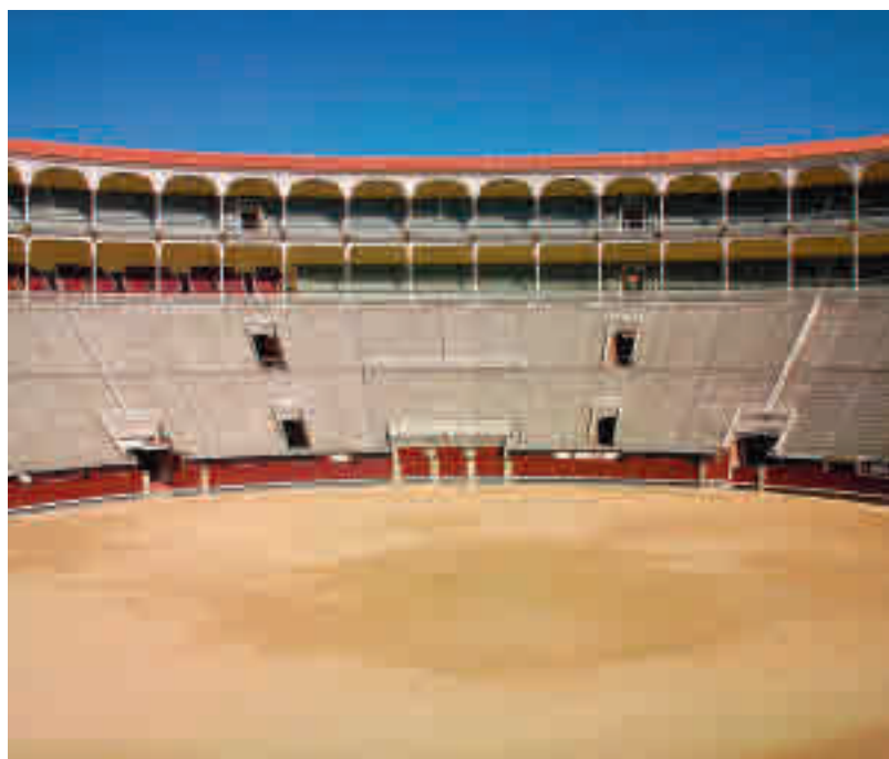
La plaza de Las Ventas no ha acogido esta temporada la Feria de San Isidro

Esas medidas precisamente son las que está abordando el Gobierno de la Comunidad de Madrid. La presidenta regional, Isabel Díaz Ayuso, se reunió recientemente con representantes del mundo taurino para tomar medidas de alivio fiscal, inci-