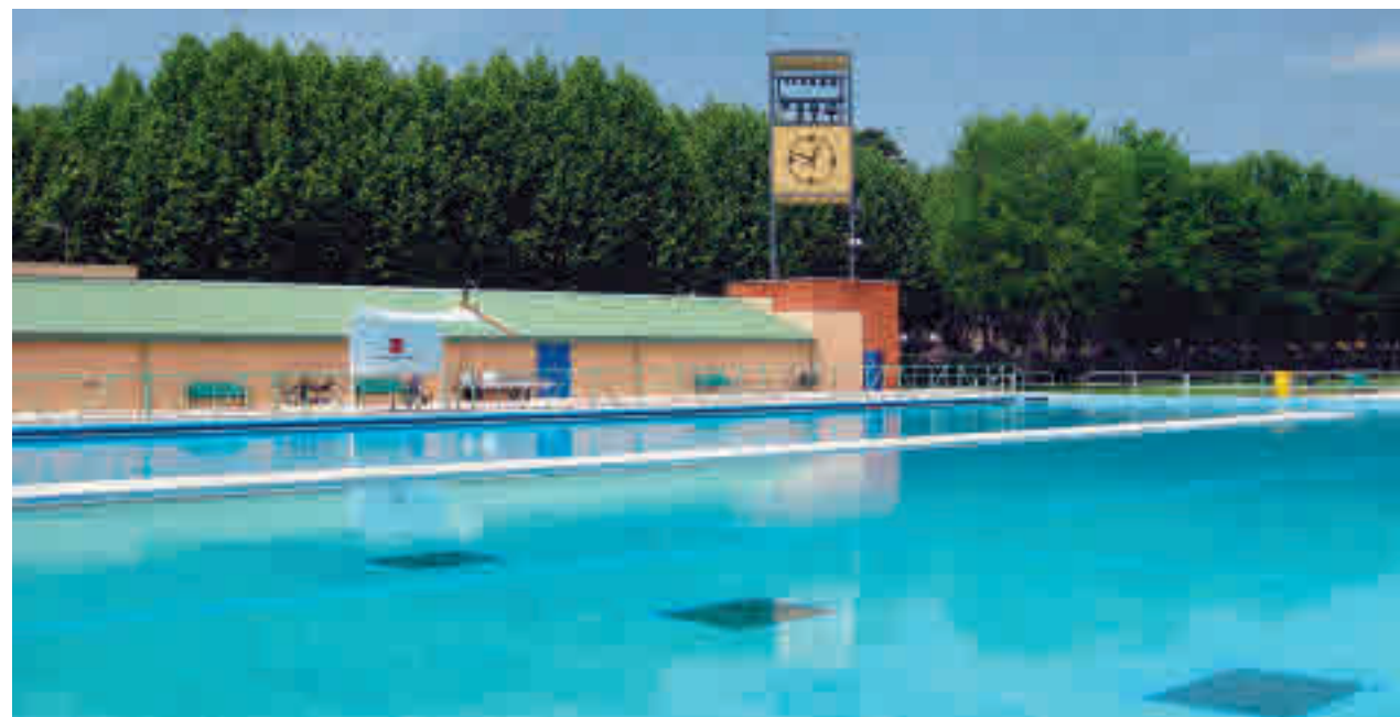
Las piscinas de la capital abrirán con restricciones de aforo