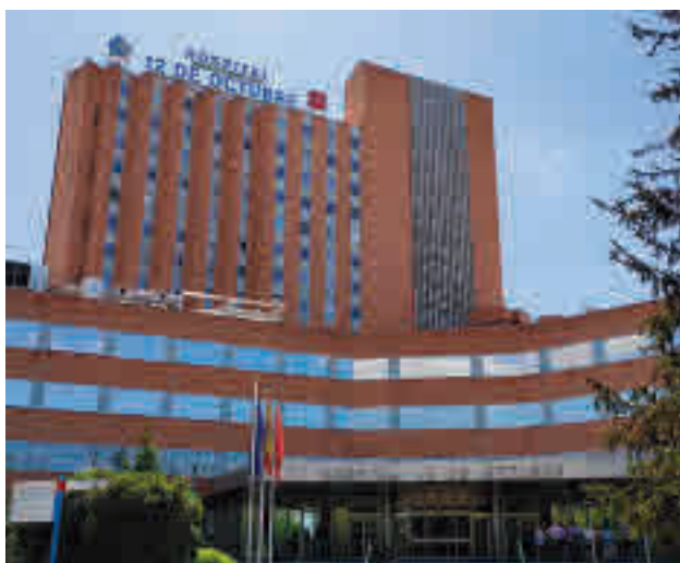
Hospital 12 de Octubre