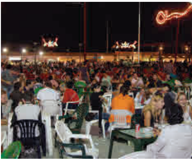
Fiestas patronales de Alcorcón