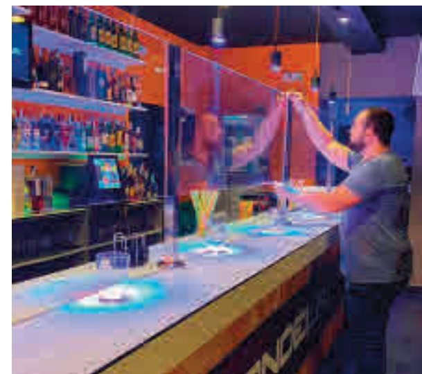
Local de ocio nocturno en Madrid

Habrà que establecer en el interior los espacios que ocuparán los diferentes grupos que accedan al interior y se recomienda emplear vasos desechables y priorizar el pago con tarjeta de crédito. La barra se tendrá que organizar para que no se produzcan aglomeraciones.