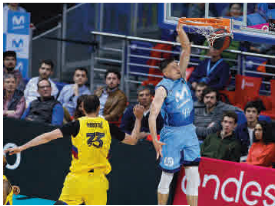
El Estudiantes llegó al parón como colista

vos calendarios, la primera categoría futbolística donde no se producirán descensos es la Segunda B. La división de plata estará compuesta en la temporada 2020-2021 por 100 equipos, de los cuales al menos siete serán madrileños (aumentando a ocho si el Atlético de Madrid B no asciende a la Liga SmartBank). En este sentido, la medida ha beneficiado a Las Rozas, que ocupaba el puesto decimo-séptimo antes del parón, y especialmente al Getafe B y a la UD Sanse, penúltimo y último, respectivamente. En el caso de los de Matapiñonera, que solo tenían 19 puntos en su casillero, estaban prácticamente desahuciados, toda vez que la zona de perma-