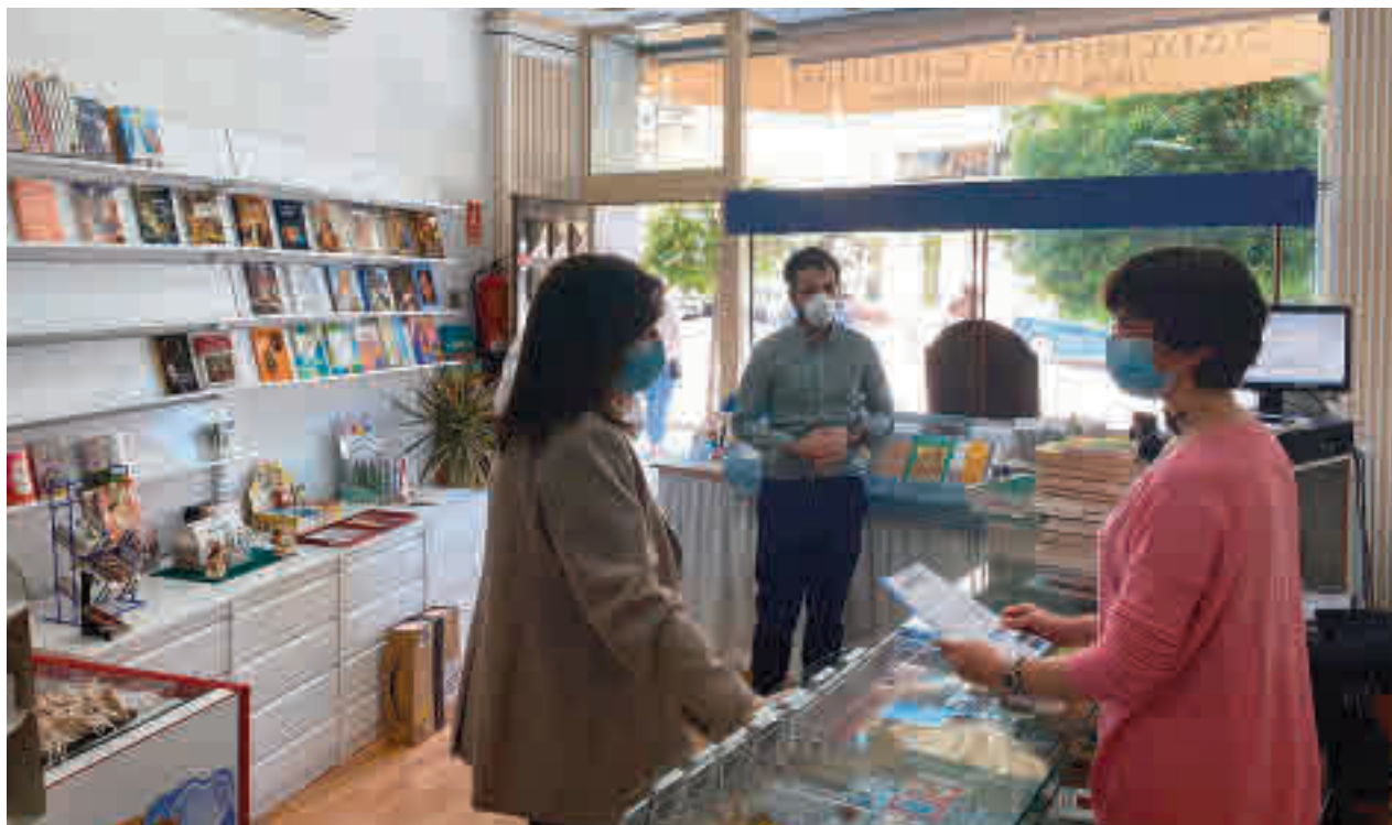
Comercios en Pozuelo de Alarcón

El Ayuntamiento de Pozuelo de Alarcón presentó hace unas semanas su plan de apoyo económico al sector de la hostelería y empresarial para tratar de paliar los efectos que haya ocasionado esta crisis sanitaria. De hecho, el Consistorio invertirá 3,5 millones de euros (una