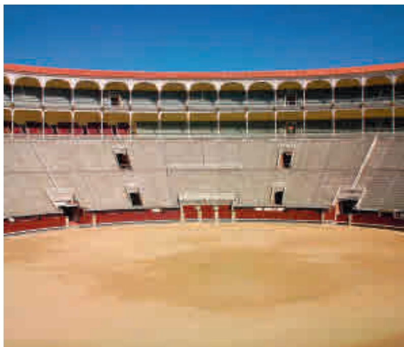
La plaza de Las Ventas no ha acogido esta temporada la Feria de San Isidro

Esas medidas precisamente son las que está abordando el Gobierno de la Comunidad de Madrid. La presidenta regional, Isabel Díaz Ayuso, se reunió recientemente con representantes del mundo taurino para tomar medidas de alivio fiscal, inci-