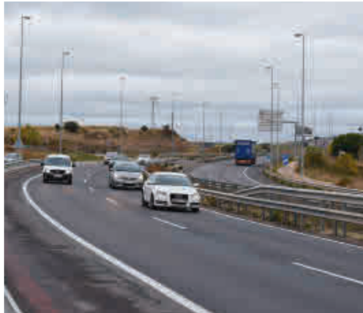
Lavado de cara para la carretera que une Tres Cantos y Colmenar GENTE

gel Garrido, a través de su perfil en la red social Twitter: "Para la Comunidad de Madrid la seguridad vial es prioritaria. Por eso, invertimos en conservación 25.000 euros por kilómetro de vía y año". Una de esas partidas está destinada precisamente a la M-607, donde la Dirección General de Carreteras ya ultima los trabajos de mejora en materia de asfaltado. Además, aprovechando el menor el estado de alarma se han avanzado en las labores del ramal de la M-40.