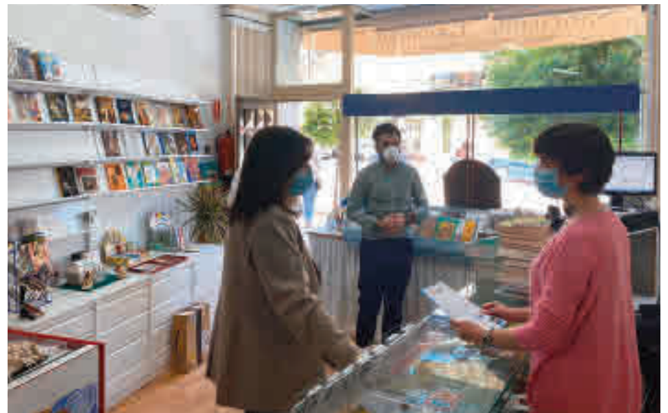
Comercios en Pozuelo de Alarcón

Con esta iniciativa se quiere facilitar que los clientes sientan "mayor seguridad" a la hora de hacer sus compras o gestiones y, es por ello, que cada uno de los establecimientos en los que se haya realizado esta limpieza especial, contará con un certifi-