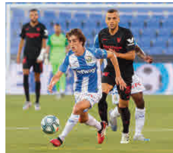
El Sevilla se llevó los tres puntos de Butarque

quema buena parte de las esperanzas pasan por ganar enfrentamientos directos como el que tendrá lugar este domingo 5 (17 horas) en Cornellá-El Prat. Allí se verán las caras el Espanyol, entrenado ahora por Rufete, y el CD Leganés, que hasta la fecha solo ha ganado uno de los 16 encuentros que ha disputado lejos de Butarque. Con los números en la mano, un empate sería insuficiente para las aspiraciones de ambos equipos, a los que no les queda otra opción que salir en busca del triunfo.