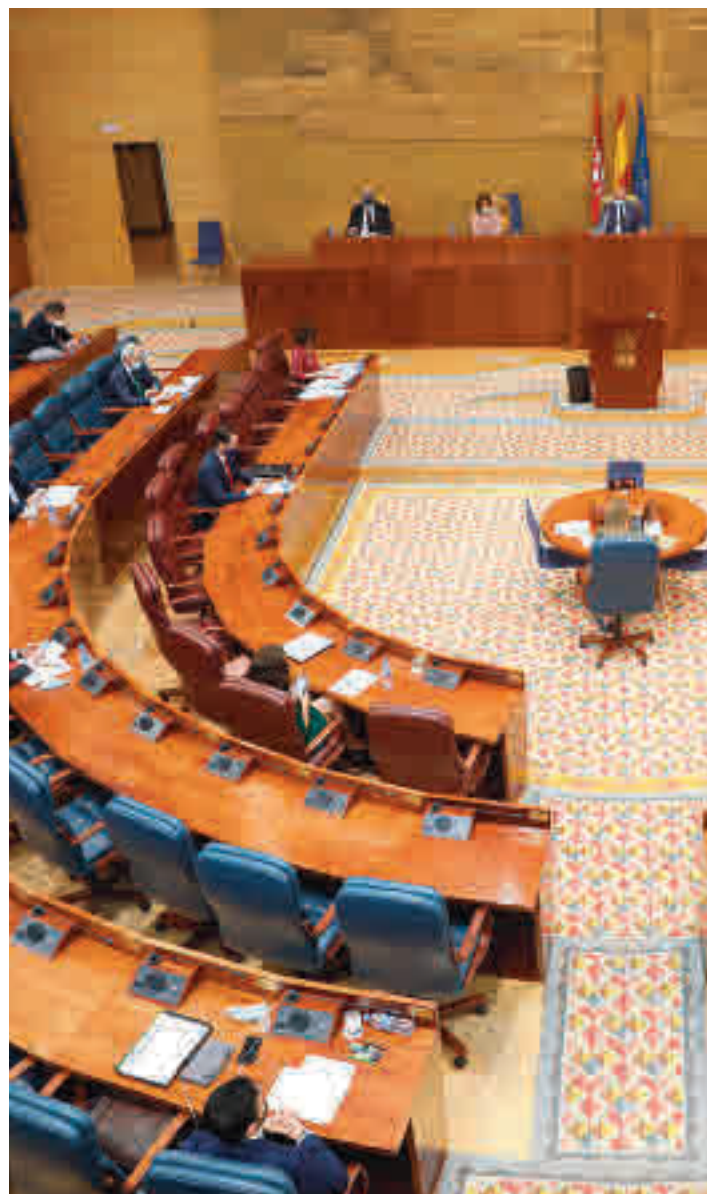
Asamblea de Madrid