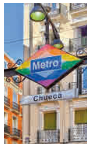
Logotipo de Metro en Chueca

El rombo rojo habitual del suburbano en las estaciones de su red pasa a ser multicolor, “con lo que la Comunidad de Madrid muestra su defensa de la libertad, el res-