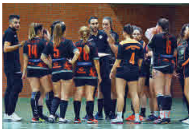
Imagen de la plantilla durante un encuentro