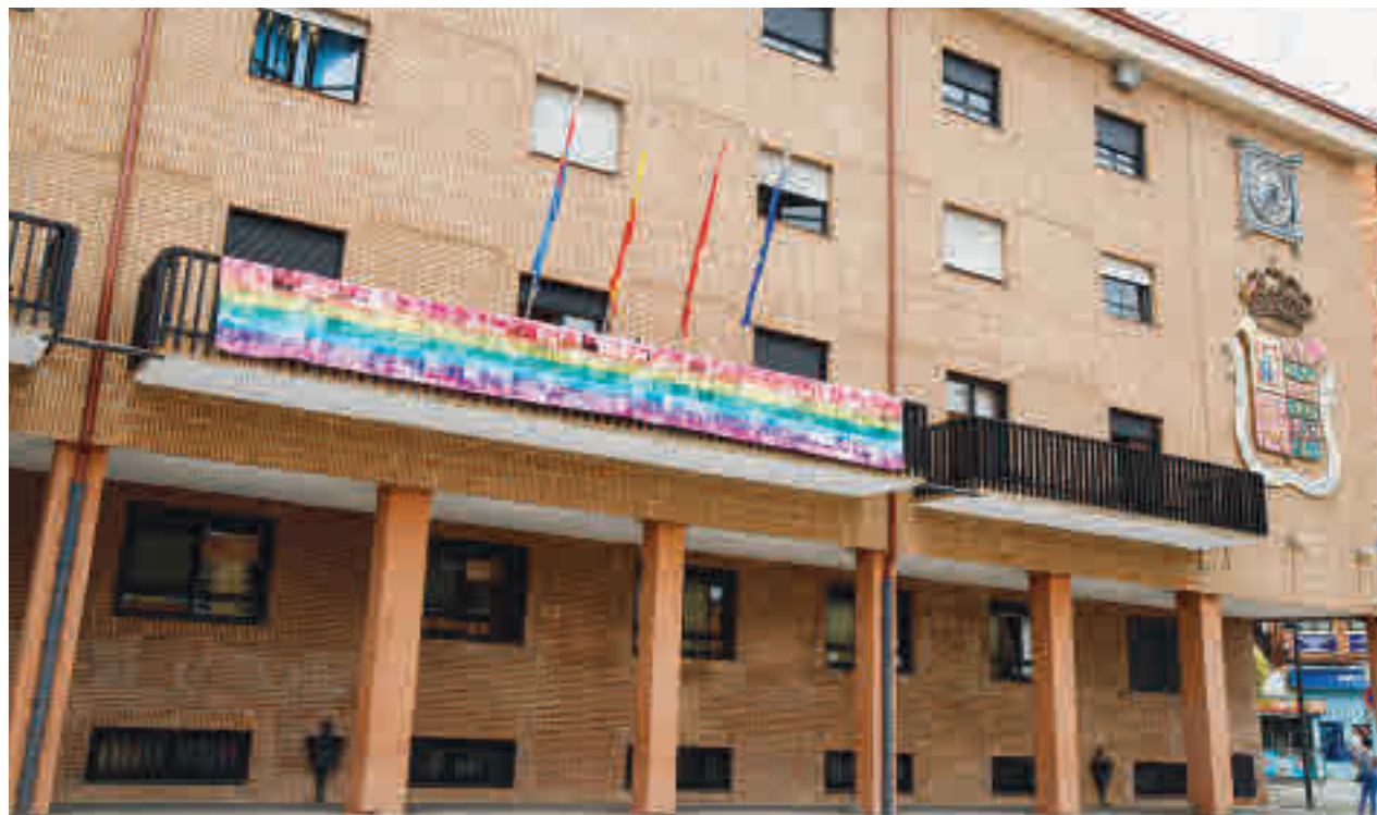
El Ayuntamiento de Móstoles desplegó una pancarta de apoyo al colectivo LGTBIQ+