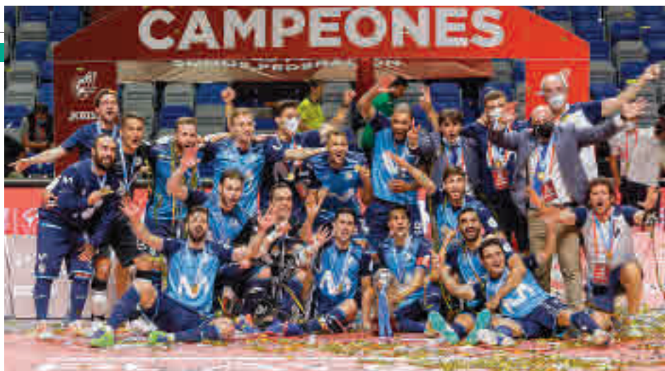
Movistar Inter cierra un ciclo con un nuevo trofeo en sus vitrinas LNFS.ES