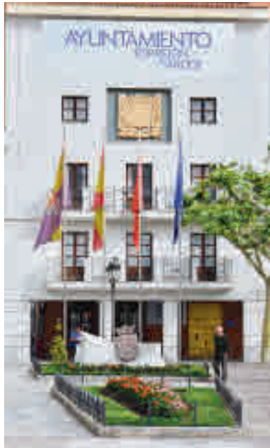
Ayuntamiento de Torrejón de Ardoz

Las primeras medidas contemplan la exención del IBI para familias con todos sus miembros en paro