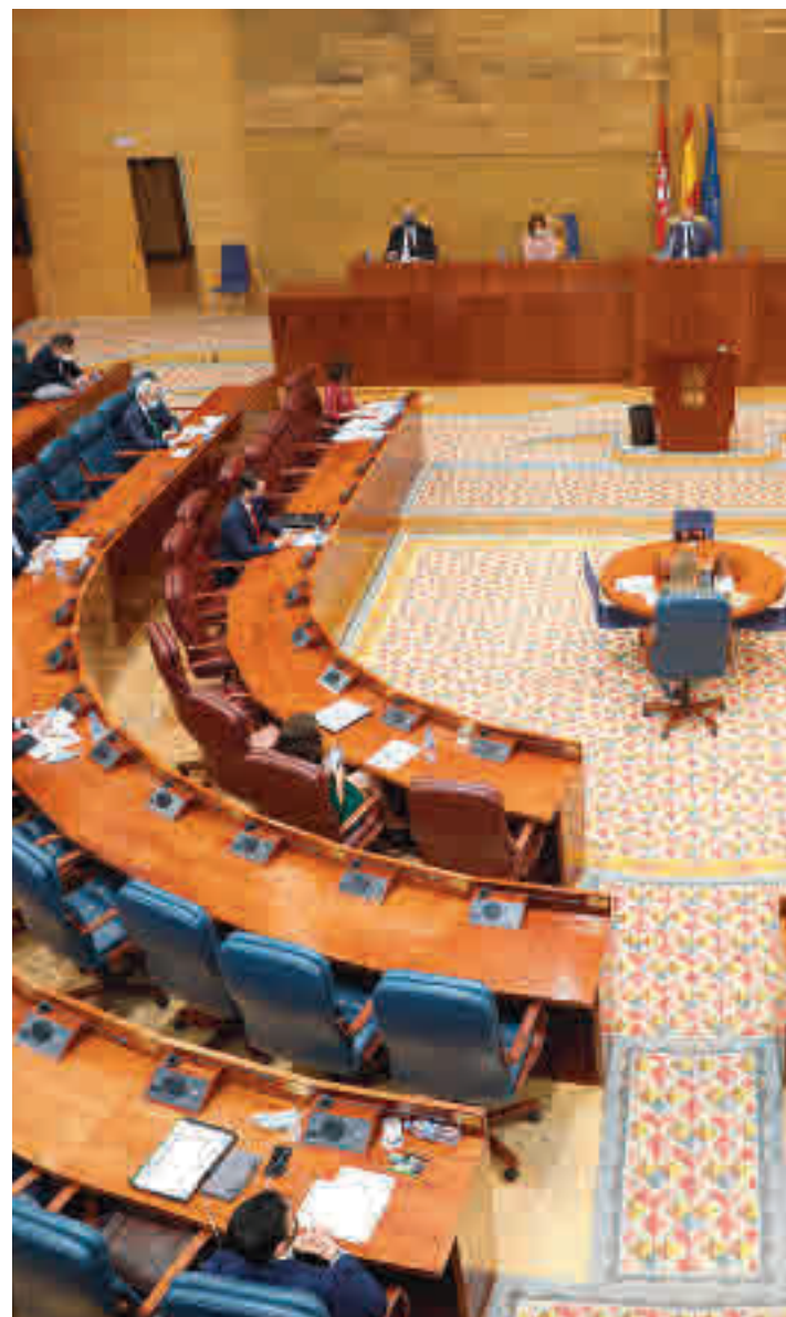
Asamblea de Madrid