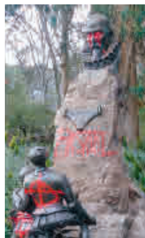
Cervantes en San Francisco

Bread, para ofrecer a la localidad madrileña como lugar que acoja a las estatuas de Miguel de Cervantes y Fray Junípero, que resultaron atacadas el pasado fin de semana en la ciudad norteamericana.