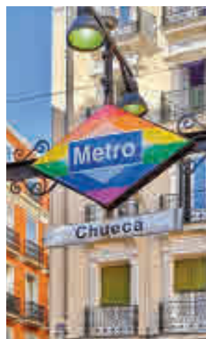
Logotipo de Metro en Chueca