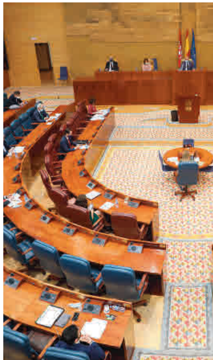
Asamblea de Madrid