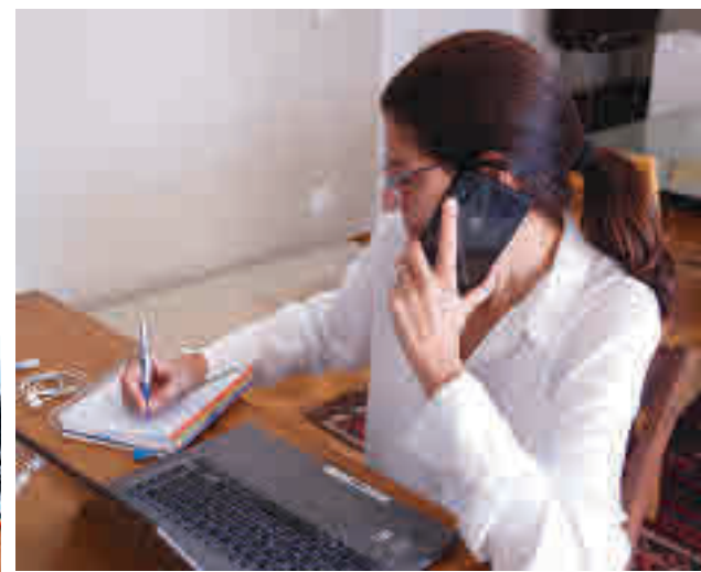
El teletreball presenta riscos i oportunitats.