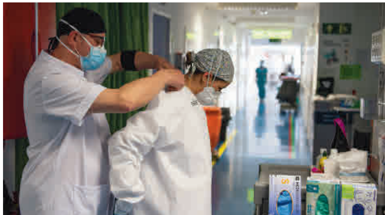
Professionals sanitaris atenen malalts de coronavirus a l'Hospital Clínic.