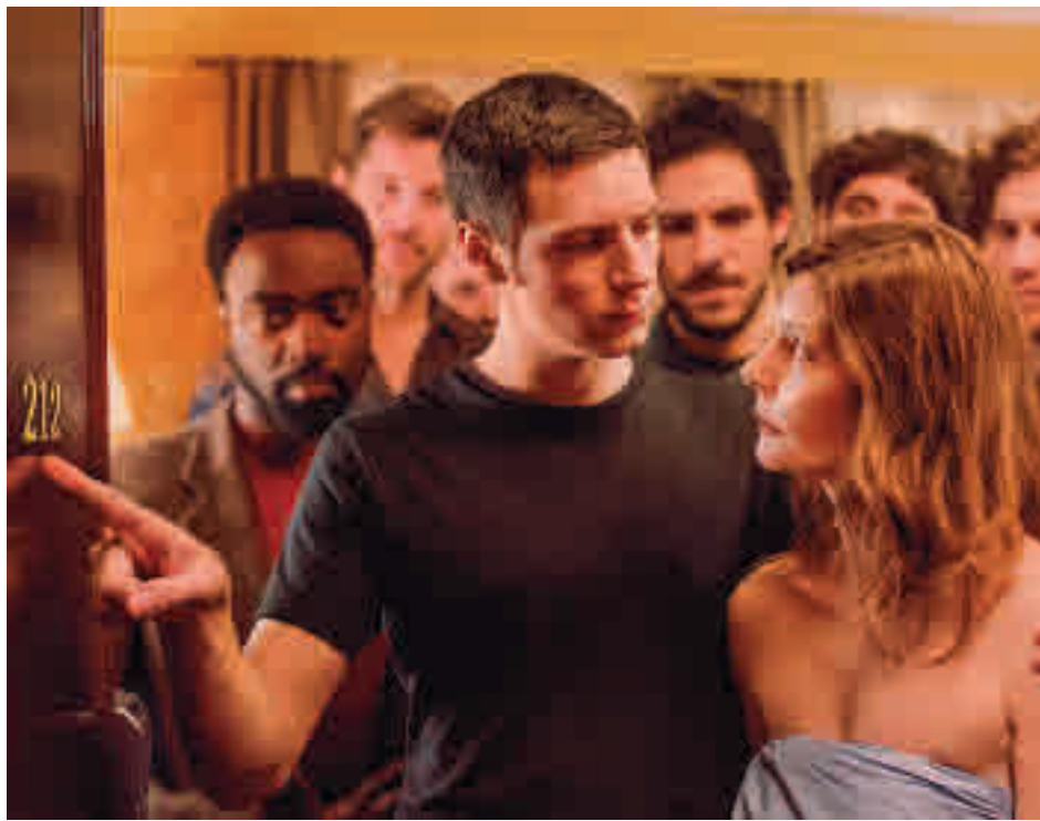
Una imatge del film inaugural del D'A Film Festival 'Habitación 212'.

L'última obra de Christophe Honoré, 'Habitació 212', protagonitzada per Chiara Mastroianni, que va guanyar el premi a la millor actriu de la secció Un Certain Regard a Canes 2019, Vincent Lacoste i Benjamin Biolay, arriba a la gran pantalla.