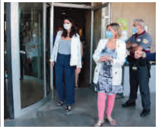
L'Hospital Arnau de Vilanova de Lleida. ACN

"Ara tenim una capacitat suficient per perimetrar amb molta més exactitud els punts on hi ha un brot", ha puntualitzat. I aposta que aquest sigui l'exemple a seguir en el cas dels brots de Lleida i que -si és necessari- el Govern decreti confinaments a l'entorn més propers.