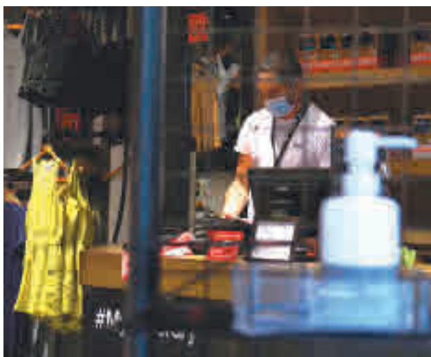
Molts comerços pateixen excés d'estoc.