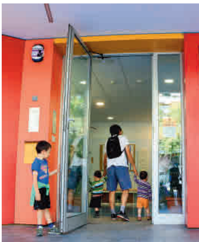
Hi haurà almenys dos mestres per cada grup estable.

Aragonés ha afirmat que tot i que el curs es reprendrà "amb normalitat" serà "excepcional" i durant el qual caldrà abordar l'"emergència educativa". Per això, el Govern ha plantejat aquesta in-