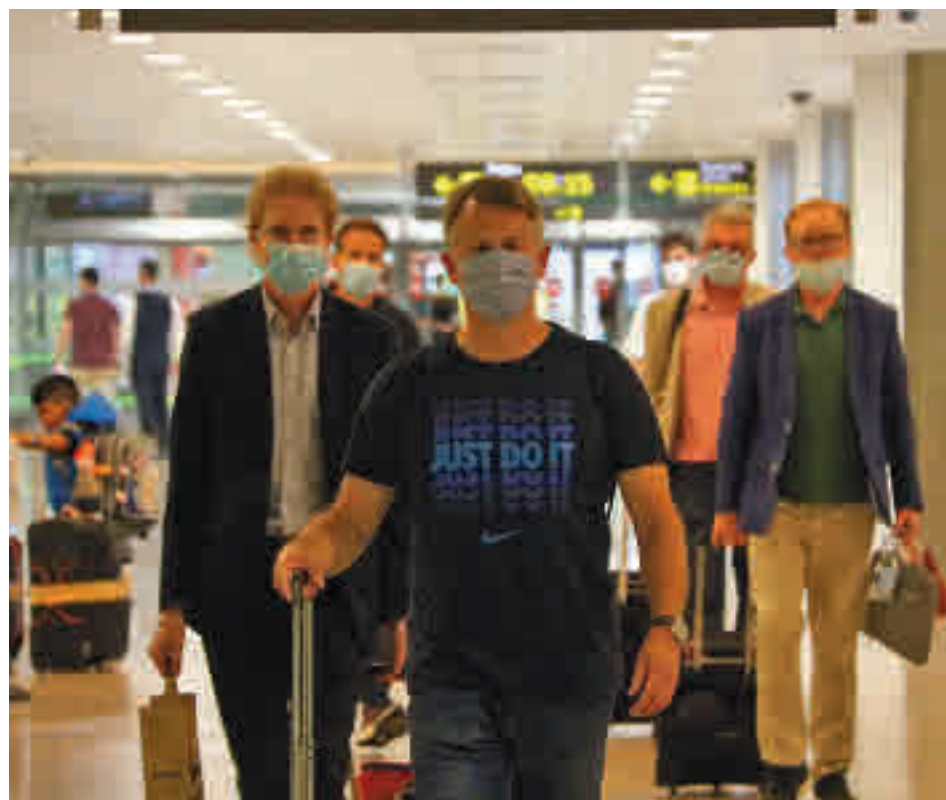
L'activitat a l'aeroport encara funciona a mig gas.

El llistat europeu inclou la Xina, el Japó, el Canadà, Austràlia, Nova Zelanda, el Marroc, Algèria, Tunísia, Montenegro, Geòrgia, Sèrbia, Corea del Sud, Tailàndia, Uruguai i Ruanda. També permet la reobertura de fronteres