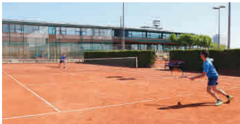
Els esportistes no hauràn de fer ús de les mascaretes.

de fins a 3.000 persones, i enfrontaments en instal·lacions interiors de fins a 2.000. Com a criteris generals, es permetrà la pràctica esportiva i d'activitat física, tant individual com col·lectiva, en qualsevol instal·lació esportiva així com