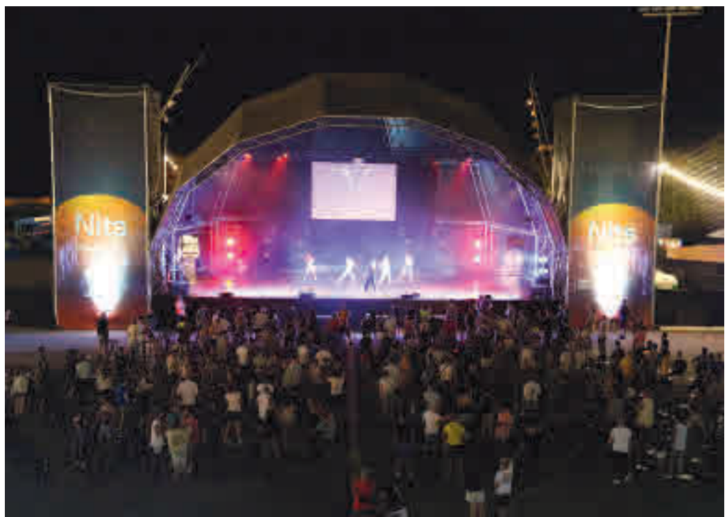
L'aforament estarà limitat i s'aplicaran les mesures de seguretat i higièniques. ACN

TOTES LES ENTRADESALS CONCERTS TINDRAN UN SEIENT NUMERAT