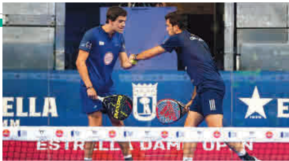
Juan Lebrón y Alejandro Galán ganaron el Estrella Damm Open 2020 WORLD PADEL TOUR

las sesiones. El espectáculo que brinda el pádel sigue ganando adeptos, pero con el contexto actual no queda más remedio que seguirlo desde la distancia, bien sea a través de canales de televisión (GOL) o plataformas en 'streaming'. Buena muestra de esta fiebre es que la reciente edición del Estrella Damm Open batió el récord histórico de audien-