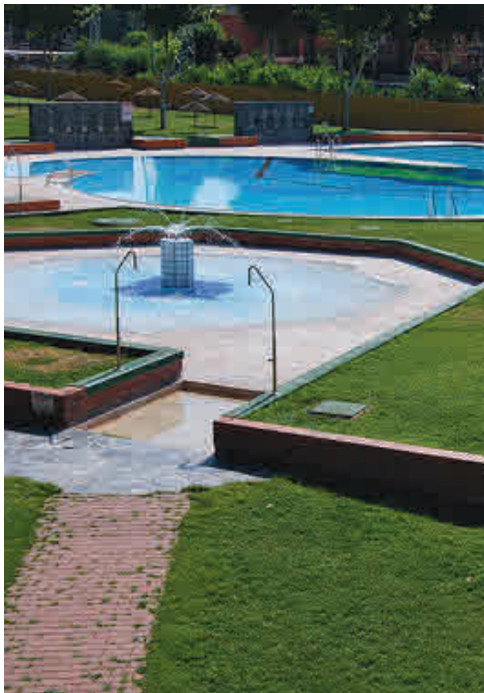
Instalaciones de El Juncal

de seguridad impuestas sean las piscinas. Allí encuentran descanso y refresco muchos habitantes que no han podido escaparse a los destinos de playa y que tratan de combatir las altas temperaturas que ha traído aparejadas la llegada del mes de julio. Pero, ¿cómo acercarse hasta algu-