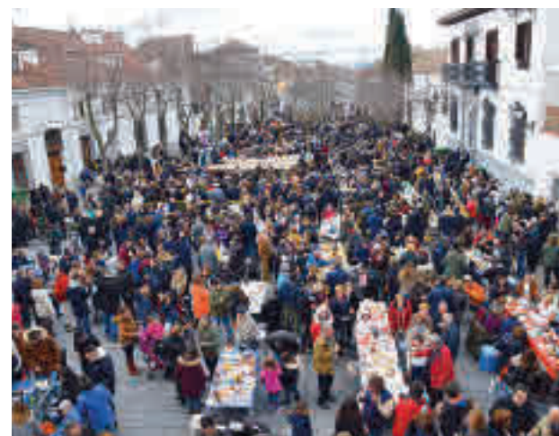
Fiestas de Villaviciosa

La decisión se ha determinado después de la reunión del consejo Sectorial de Fiestas celebrada bajo la pre-