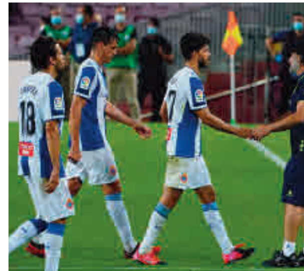
El Espanyol vuelve a Segunda 26 años después

Por entrar en la Europa League, la cosa está más reñida, con Getafe, Real Sociedad e incluso Valencia como posibles acompañantes del Sevilla o el Villarreal.