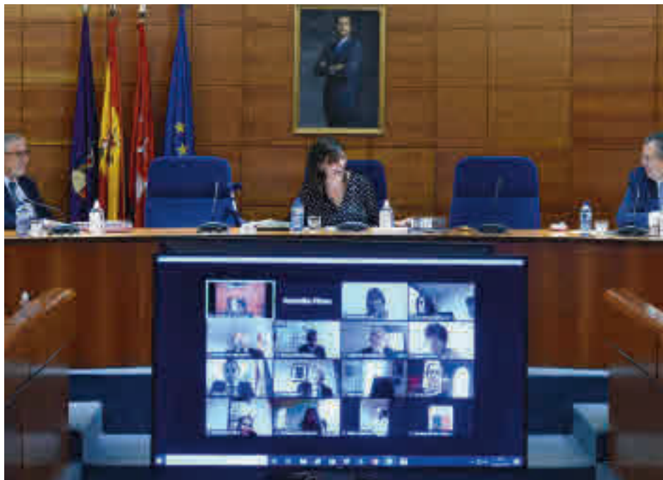
Debate del Estado del Municipio de Pozuelo

En cuarto lugar está la apuesta por las nuevas tecnologías a la hora de realizar los trámites, evitando en la manera de lo posible el gasto de papel y fomentando la administración ‘online’. A continuación llegaría la seguridad, con la instalación de cámaras por toda la ciudad;