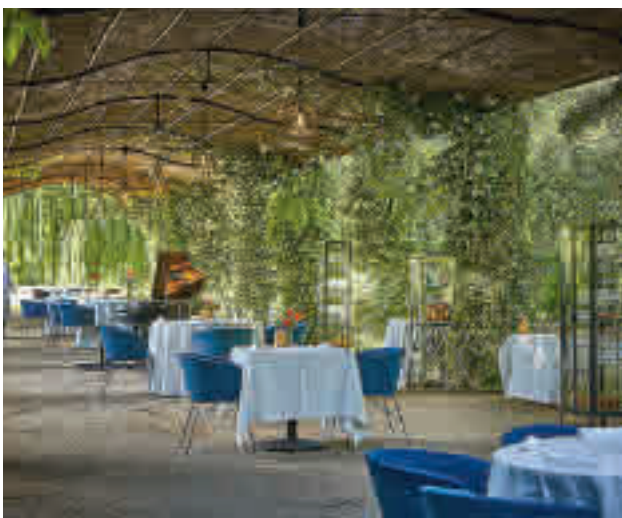
La espectacular terraza donde se sirven los almuerzos y cenas