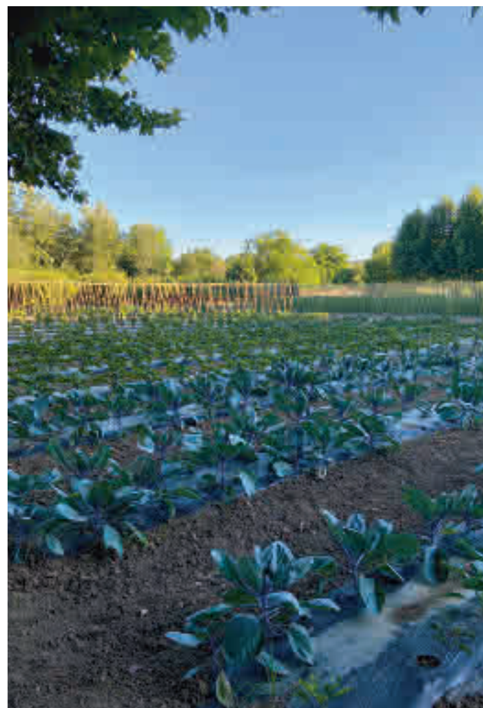
Un total de 15 hectáreas de huerta en el municipio de Carabaña MC/GENTE

Situada a poco más de 40 kilómetros del centro de Madrid, en el municipio de Carabaña, se convierte en un paraíso para los ciudadanos de la capital y del resto de la Comunidad que quieren alejarse por unas horas del ruido y volver a los tiempos en los que un tomate sabía a tomate. Y es que el protagonista indiscutible de la huerta, que cuenta con 15 hectáreas, es este producto, del que tie-