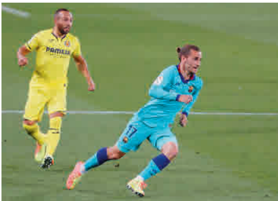
Griezmann está mostrando su mejor imagen desde que llegó al Barça