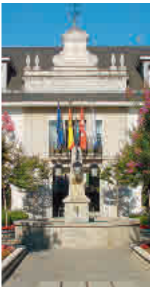
Ayto. de Majadahonda