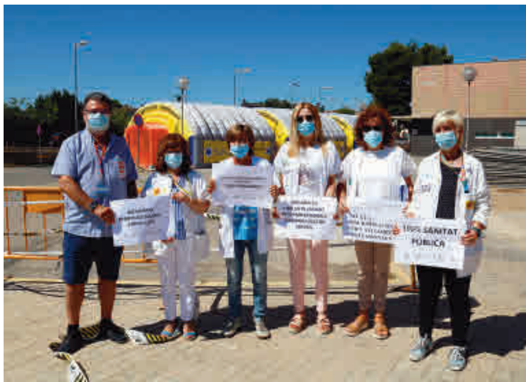
Treballadors de l'Arnau reclamen reforços permanents als hospitals de Lleida pels nous brots.

ELS BROTS DE LLEIDA I LA RESTA DE CATALUNYA HAN ENCÈS L'ALARMA