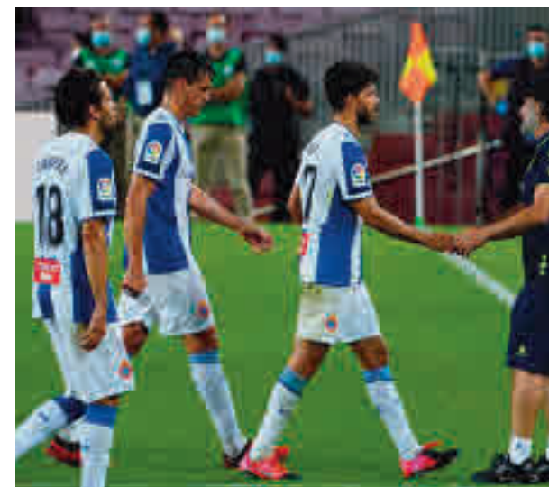
El Espanyol vuelve a Segunda 26 años después

Por entrar en la Europa League, la cosa está más reñida, con Getafe, Real Sociedad e incluso Valencia como posibles acompañantes del Sevilla o el Villarreal.