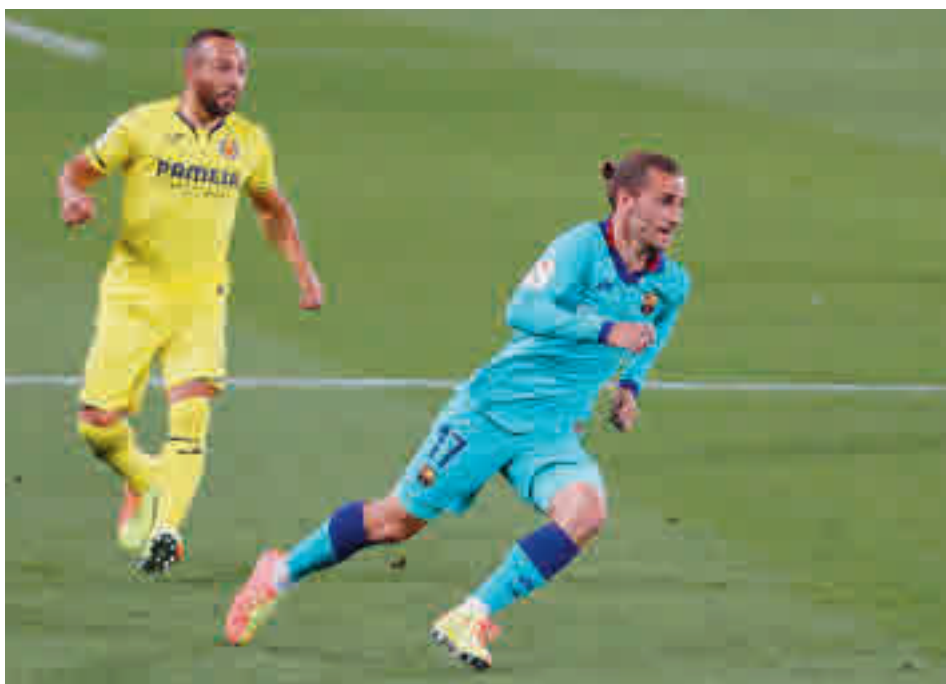
Griezmann está mostrando su mejor imagen desde que llegó al Barça