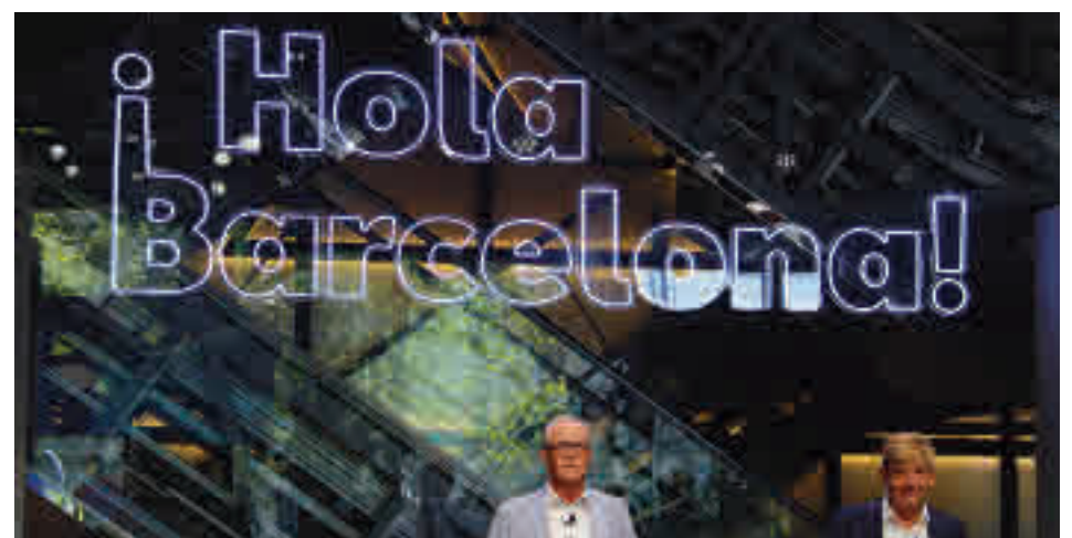
El president de SEAT, Carsten Isensee, acompanyat del vicepresident.

A més, Seat ha anunciat que llançarà el nou model e-Born sota la marca Cupra i un nou sistema de motos compartides per Barcelona. L'e-Born és un cotxe dissenyat i desenvolupat totalment a la capital catalana.