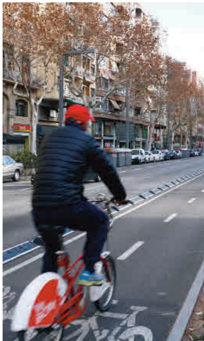
El carril bici de l'avinguda del Paral·lel.

A més, s'habilitaran 2.850 m2 nous per a vianants a través de dues actuacions d'ampliació tàctica de voreres: les dues de la Ronda Universitat i la vorera mar del carrer Pelai.