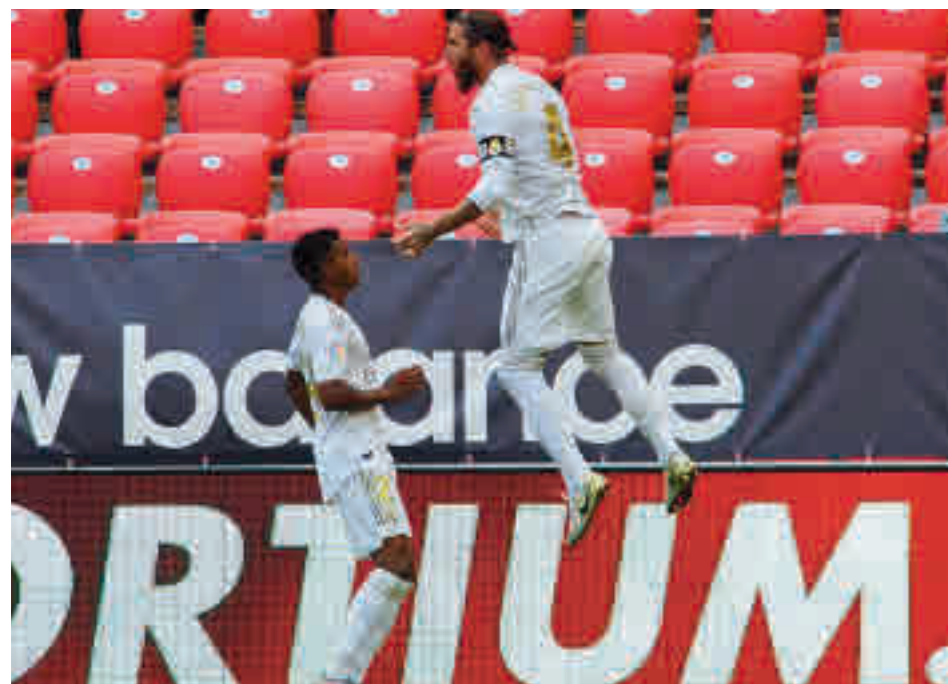
Sergio Ramos está aportando varios goles en las últimas jornadas