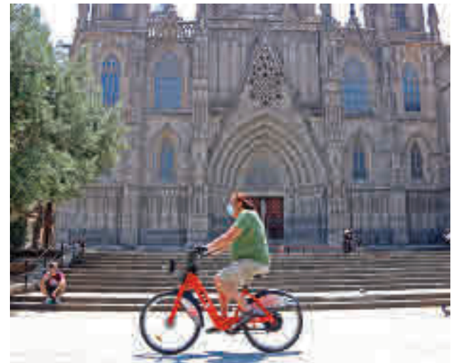
El peató cobra més importància al centre de la ciutat.