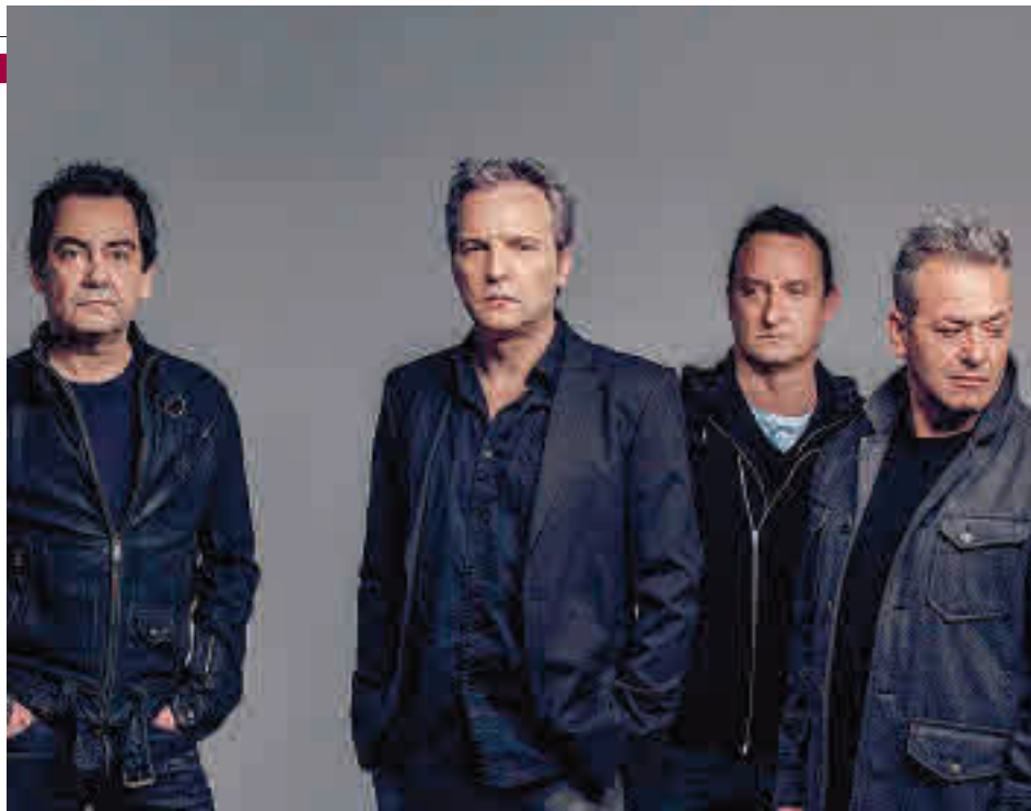
La banda musical Hombres G és un dels caps de cartell.

També actuaran dins del mateix festival Paco Candela, que acaba d'editar el seu nou disc 'Alma de Pura Raza', o el català