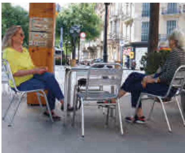
Els locals podran gaudir de més espai per les terrasses.