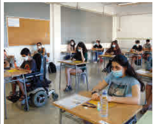
La mascareta ha estat obligatòria a l'entrar i sortir.

Per fer-hi front, moltes dones opten per l'"apagada" digital i es donen de baixa de totes les xarxes socials i deixen de fer ús d'internet durant una temporada. D'altres en canvi, opten per denunciar públicament la situació a les pròpies xarxes digitals, tot i que això a vegades pot provocar un empitjorament de la situació de violència que es patia.