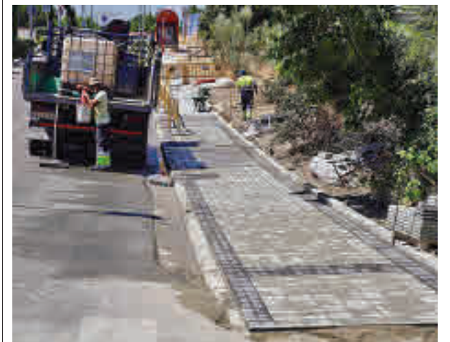
Los trabajos se realizarán durante julio y agosto

Por su parte, el IES Carmen Conde también verá reordenado los aparcamientos de su área más cercana, con el objetivo de lograr una entrada y salida de alumnos más segura gracias a la creación de plazas de estacionamiento en el lateral de la avenida de Atenas.