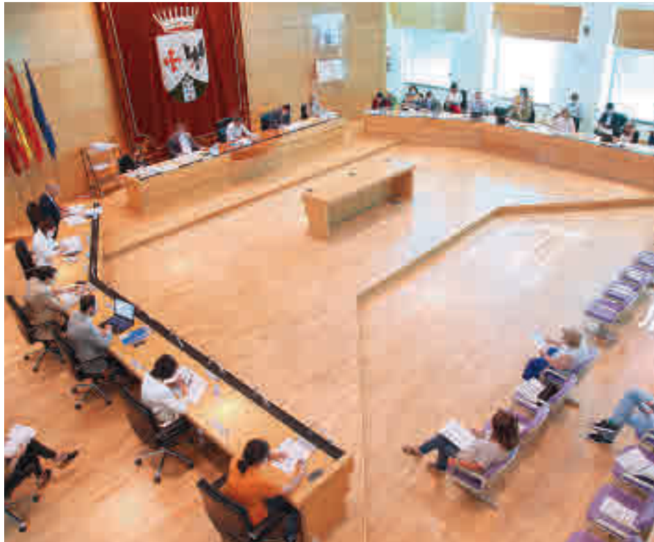
Pleno del Ayuntamiento de Alcobendas

El documento prevé que se destinen más de 1,5 millones de euros a la modernización de la Administración municipal, avanzando en la digitalización de la gestión de los servicios públicos. Para ello, se invertirá en el desarrollo de la implantación de la administración electrónica en el Ayuntamiento y sus patronatos; en el equipamiento para la gestión del control inteligente de la ciudad; en la nueva web municipal; y en la adquisición de programas informáticos y de nuevos equipos para la universidad popular, las mediatecas, los servicios sociales, las instalaciones deportivas o el centro de formación.