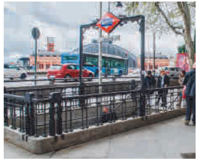
La Línea 11 de Metro pasará por Atocha