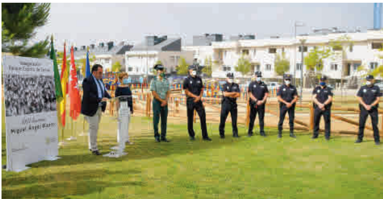
Boadilla del Monte inauguró el parque Espíritu de Ermua