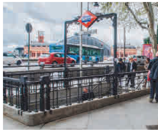
La Línea 11 de Metro pasará por Atocha