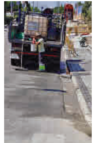
Los trabajos, en marcha

Fruto de estas conversaciones, el Consistorio roceño planificó una serie de me-