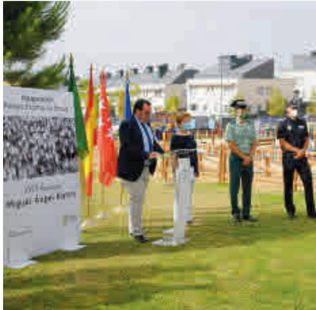
Boadilla del Monte inauguró el parque Espíritu de Ermua

Veintitrés años después, el asesinato del que fuera concejal de Ermua, Miguel Ángel Blanco, a manos de la banda terrorista ETA sigue muy presente en la memoria de miles de españoles. Por eso, este pasado 13 de julio se celebraron hasta 45 actos de homenaje en diferentes localidades, bajo el lema 'La resistencia de la dignidad' con una amplia representación de la Comunidad de Madrid: Alcobendas, Alcorcón, Alpedrete, Boadilla del Monte, Brunete,