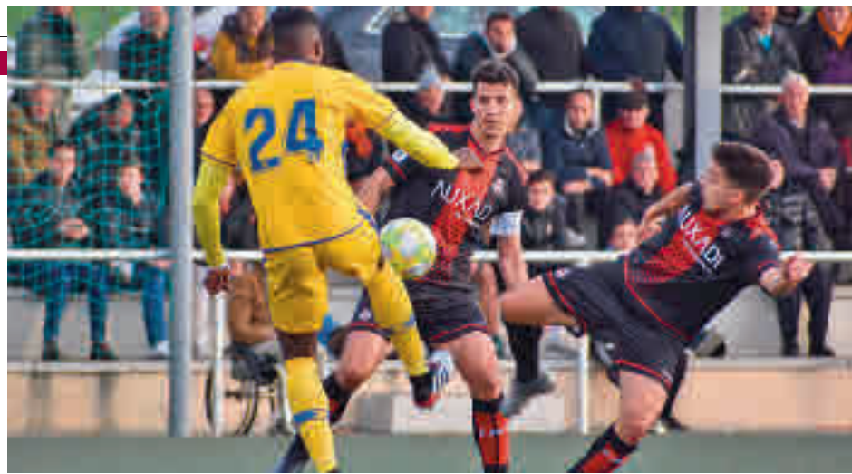
Unión Adarve y Alcorcón B jugarán este domingo

Al igual que el Navalcarnero, el Unión Adarve también tratará de regresar un año después a la Segunda División B. Para ello tendrá que superar, en primer lugar, a un