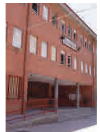
Colegio de Fuenlabrada

provisional de admitidos y abrió el martes el plazo para que aquellas familias que solicitan por primera vez la beca municipal para material escolar, unos 3.900 demandantes, puedan presentar la documentación requerida. Podrán hacerlo hasta el 31 de julio. El presupuesto es de 1,2 millones de euros para las ayudas.