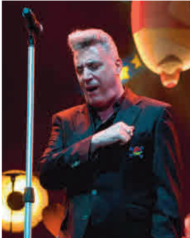
Loquillo será el encargado de cerrar Las Lunas del Egaleo 2020

El mes se completará con las actuaciones de Desakato