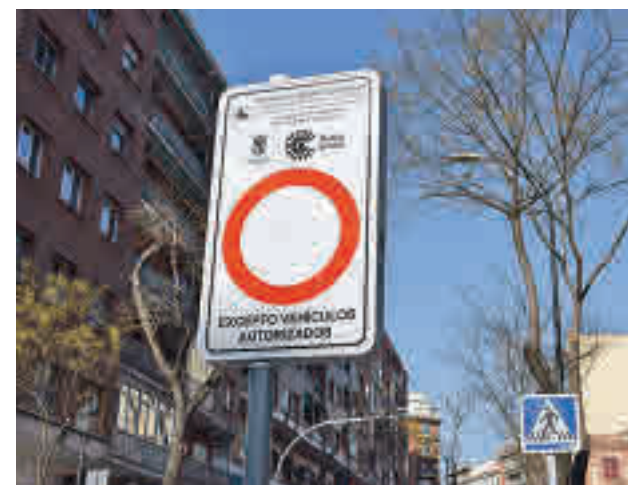
Restricciones de paso por Madrid Central

Se trata de la tercera línea de EMT, junto a las dos líneas Cero gratuitas que ya están en marcha, que se incluyen en la estrategia de sostenibilidad ambiental 'Madrid 360'. Martínez-Almeida señaló que este tercer recorrido "paliará las necesidades" de movilidad que se dan en la zona desde la implantación de Madrid Central.