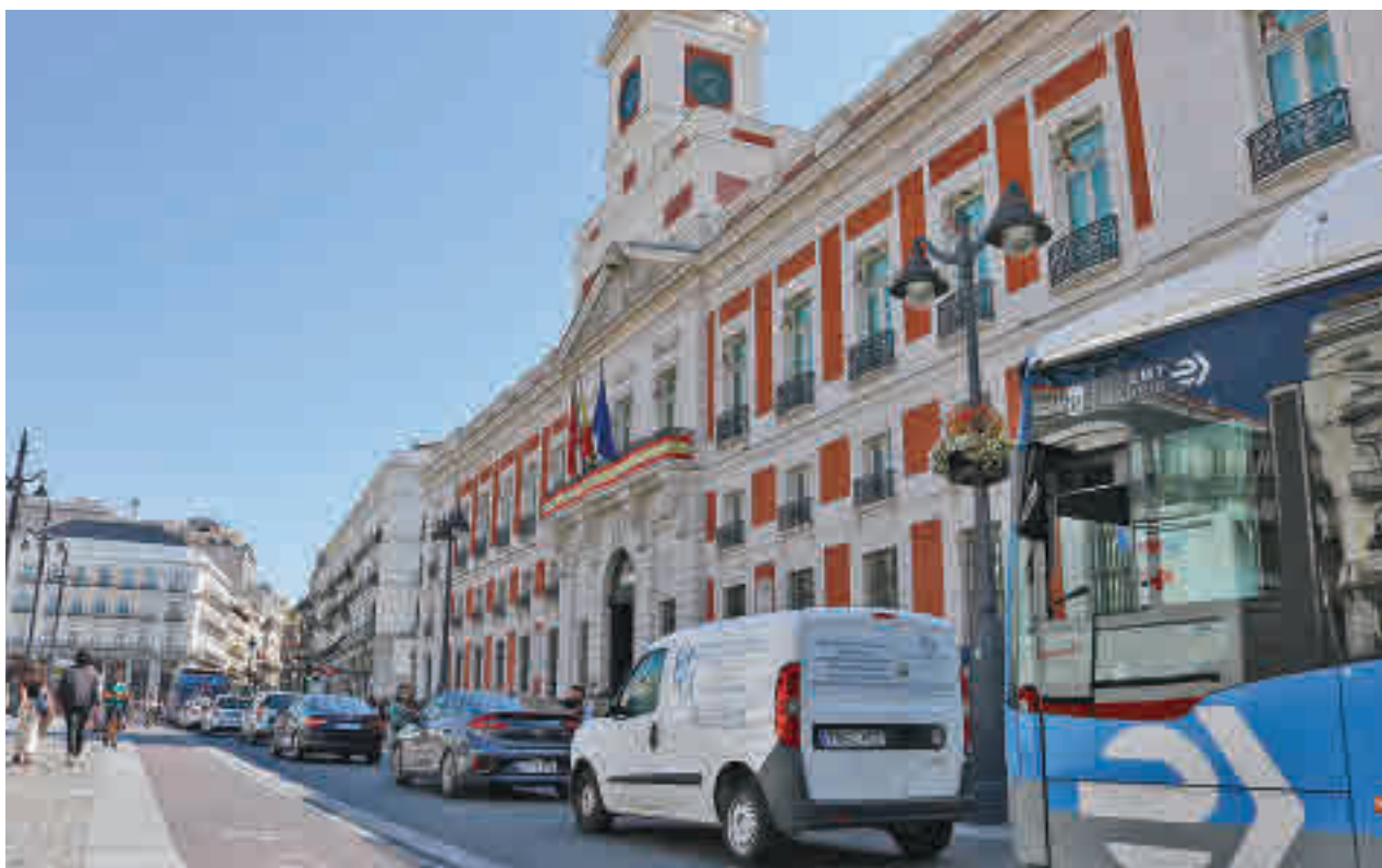
Los coches dejarán de pasar por la Puerta del Sol en poco más de un mes