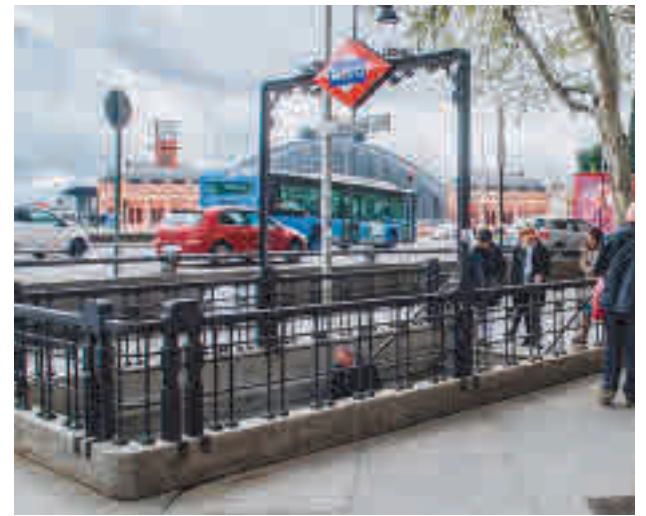
La Línea 11 de Metro pasará por Atocha