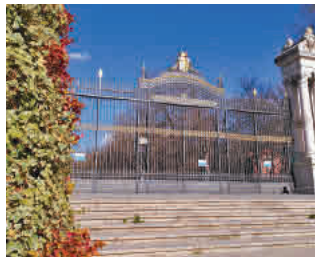
Los parques madrileños cierran a las 22 horas