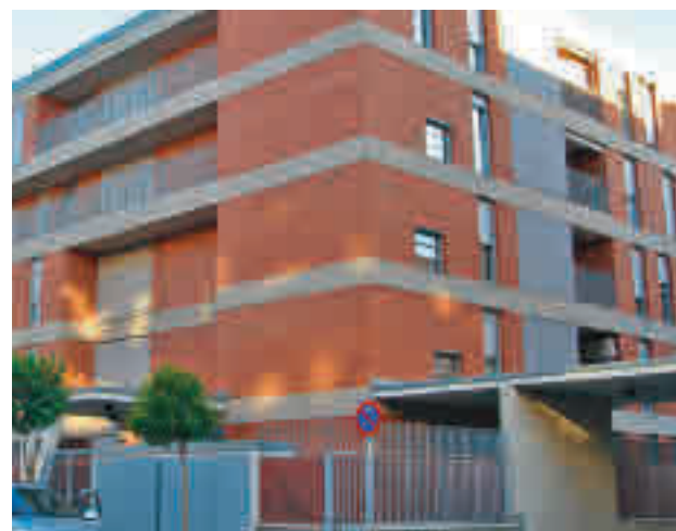
Barrio de El Arroyo de Fuenlabrada

tal de Vivienda para rehabilitar sus casas y obtener financiación del 40% al 75% del coste, dependiendo del alcance de la obra y de la situación socioeconómica de los residentes. El Instituto Municipal de la Vivienda de