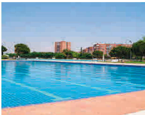
Las piscinas de Madrid ya han cerrado sus puertas