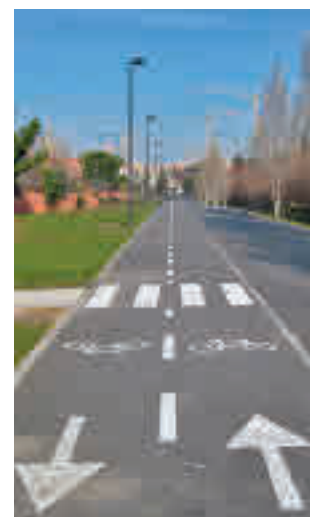
Carril bici de Getafe

añadido a la oferta cultural del municipio y no lucrarse, dado que las actividades realizadas en Alcorcón "no son rentables".