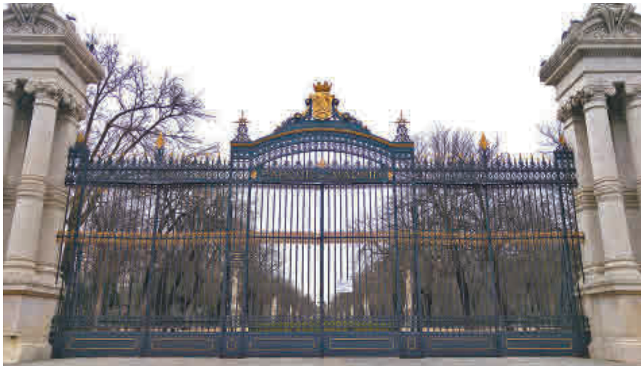
Los parques de la capital están cerrados en horario nocturno

En concreto, en Puente de Vallecas se han registrado en este periodo de tiempo 1.196 casos, en Carabanchel 936 y en Ciudad Lineal 700.