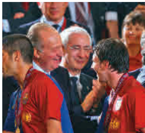
El rey emérito saludando a Lionel Messi

EL PERIÓDICO GENTE NO SE RESPONSABILIZA NI SE IDENTIFICA CON LAS OPINIONES QUE SUS LECTORES Y COLABORADORES EXPONGAN EN SUS CARTAS Y ARTÍCULOS