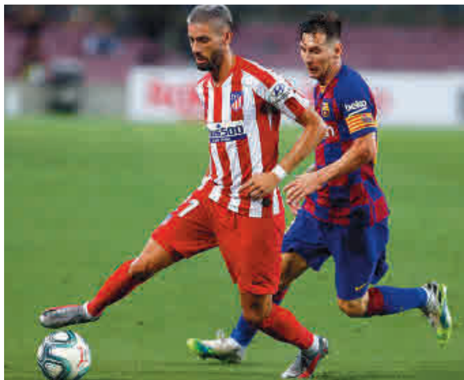
Carrasco se ganó un hueco en el Atlético gracias a un buen final de temporada