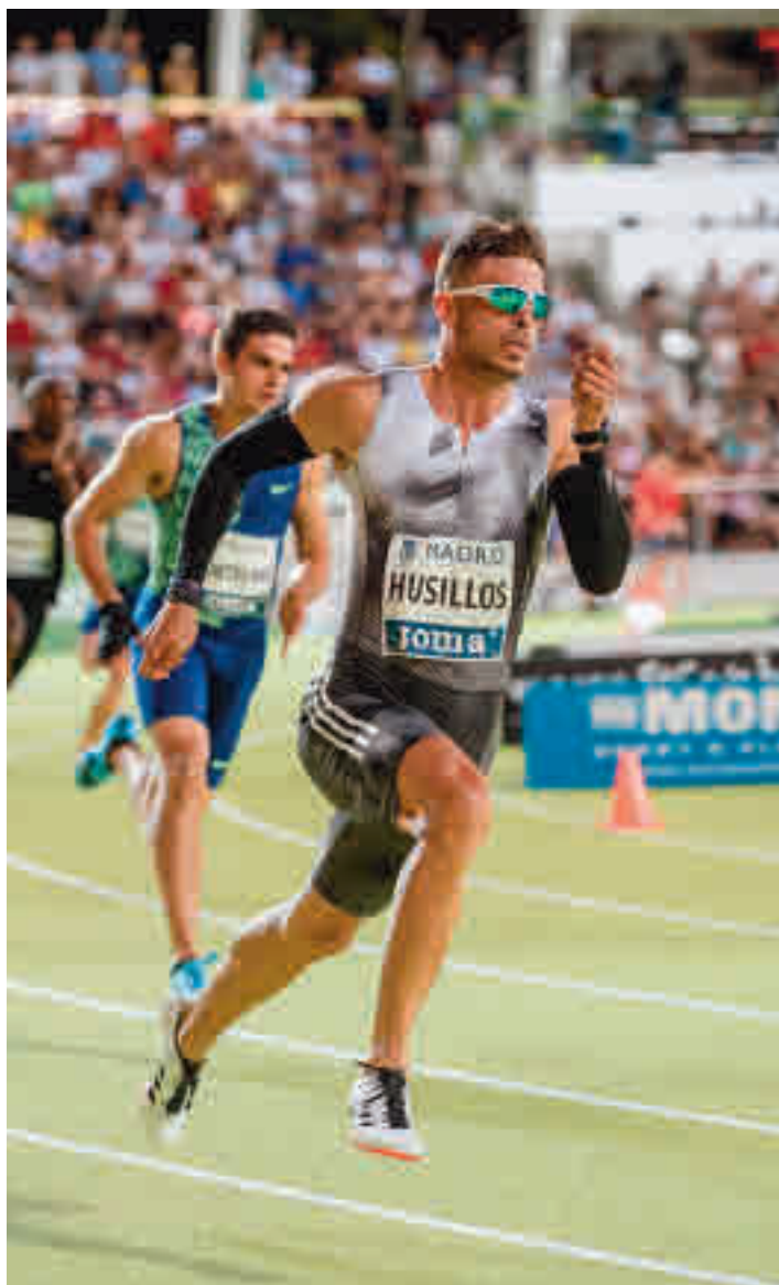
Septiembre es sinónimo de atletismo en Madrid

La nueva normalidad ha llegado para quedarse y obliga a estos deportistas a replantear sus objetivos a corto plazo y, por tanto, su preparación en un año sobre el que habían puesto muchas de sus esperanzas. De hecho, la temporada ha comenzado bastante más tarde de lo deseado, pero al menos el calendario ya ha sido inaugurado, colocando a Madrid como el epicentro de esta disciplina