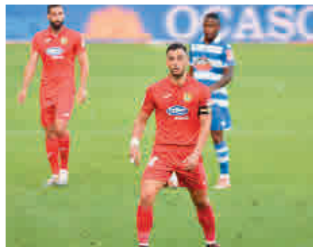
El Depor-Fuenla sigue coleando, casi un mes después