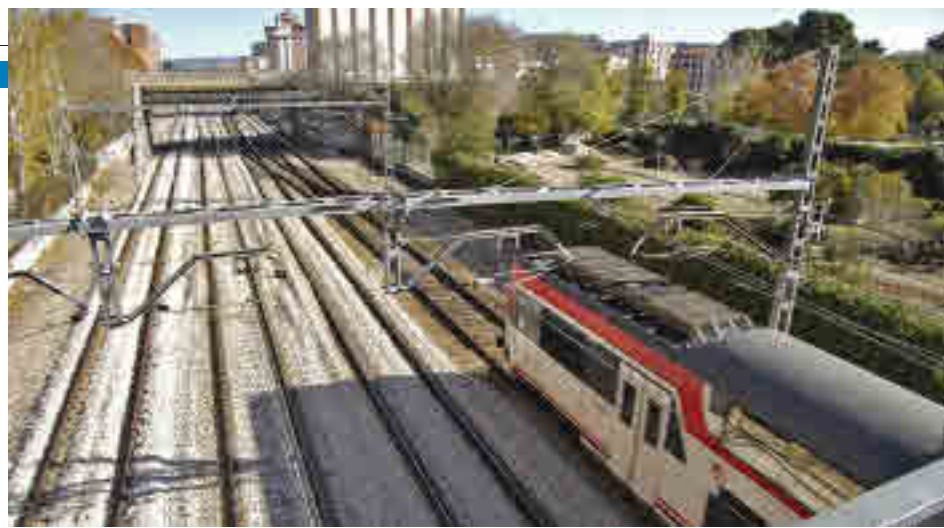
Línea de Cercanías que une Atocha con el Corredor

La actuación tendrá una duración de seis meses ● No afectará al servicio habitual, ya que las obras se harán por la noche