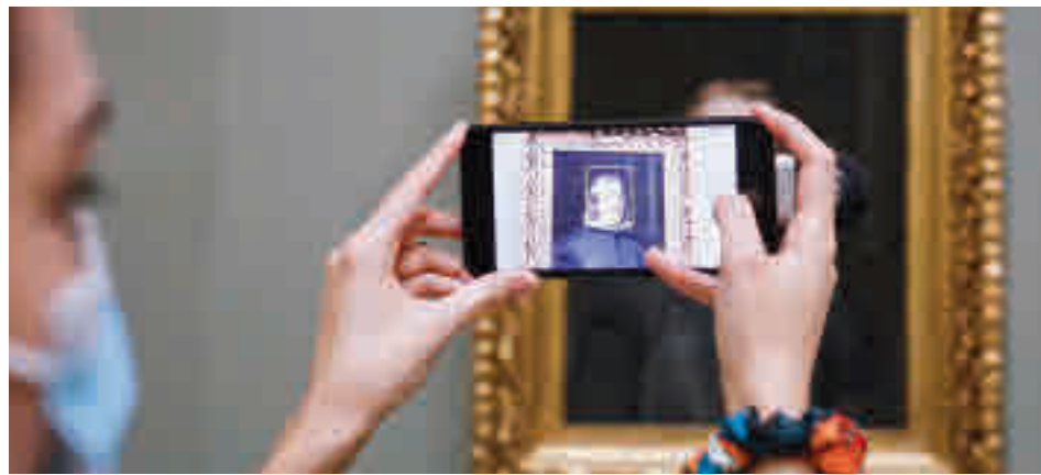
Las visitas a los museos han bajado sensiblemente este verano

Ya sea a partir de este balance o como previsión de los tiempos venideros, en el Museo Thyssen-Bornemisza no se han quedado de brazos cruzados y han optado por una medida con la que tratan de atraer a nuevos usuarios. La apuesta en cuestión es la rebaja del precio de la entrada, pasando la general a tener un coste de 9 euros en lugar de los 13 anteriores. En el caso del ticket reducido, el descuento deja el precio final en 6 euros. “El Thyssen quiere hacer este esfuerzo teniendo en cuenta la situación general del país y aprovechando que ‘Expresionismo alemán’, que reunirá las obras pertenecientes a la colección privada