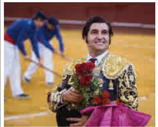
Morante era uno de los diestros anunciados

gentedigital.es Toda la información del Norte en nuestra página web