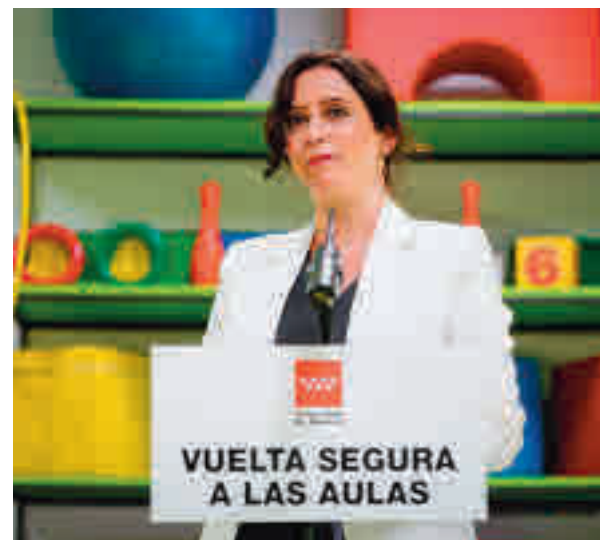
Isabel Díaz Ayuso, en un colegio de Getafe