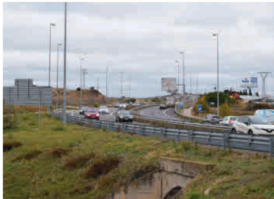
Tramo de la carretera M-607 entre Colmenar y Tres Cantos

La suspensión de la corrida que iba a tener lugar el pasado fin de semana en Alcalá de Henares había puesto en el punto de mira los actos de Sanse. Tras varios días de dudas, la decisión del Gobierno regional de limitar a un máximo de 600 personas el aforo de los espectáculos ha supuesto la puntilla final.