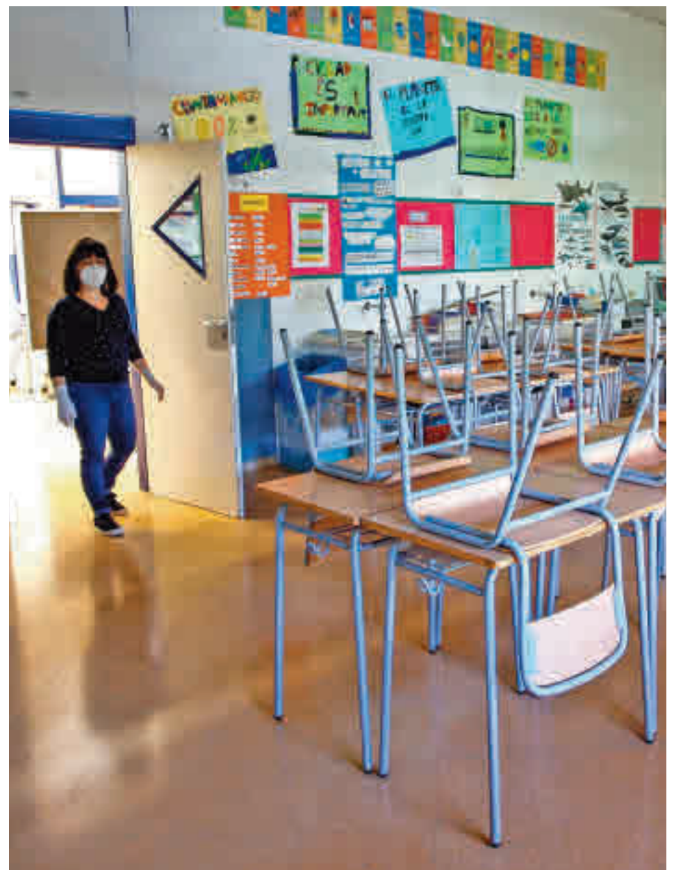
Los alumnos madrileños vuelven al cole entre dudas

La Comunidad facilitará que los centros que aún no la tienen puedan aplicar este curso de manera excepcional la jornada continua y posibilita-