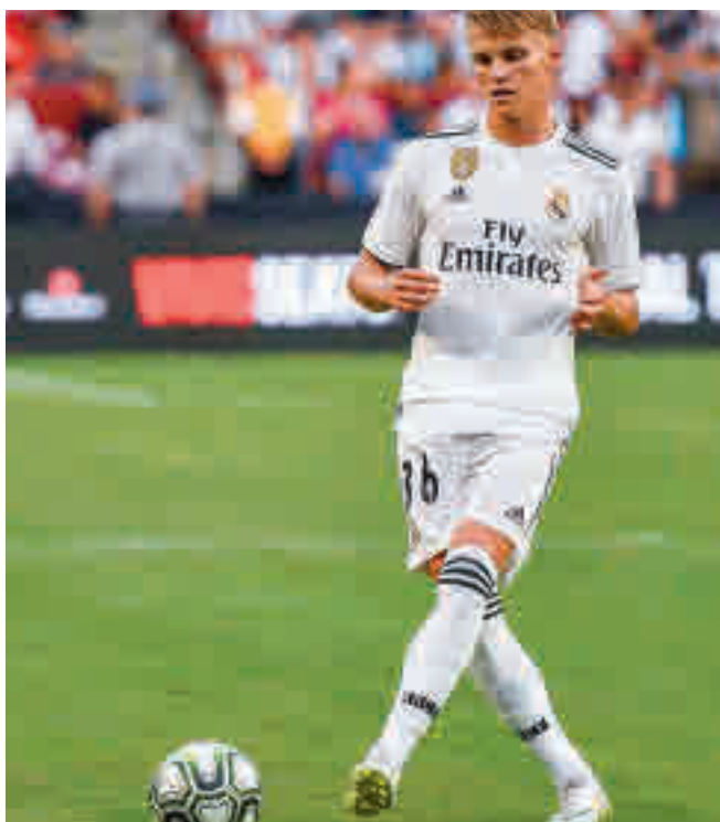
Ødegaard ya está a las órdenes de Zidane