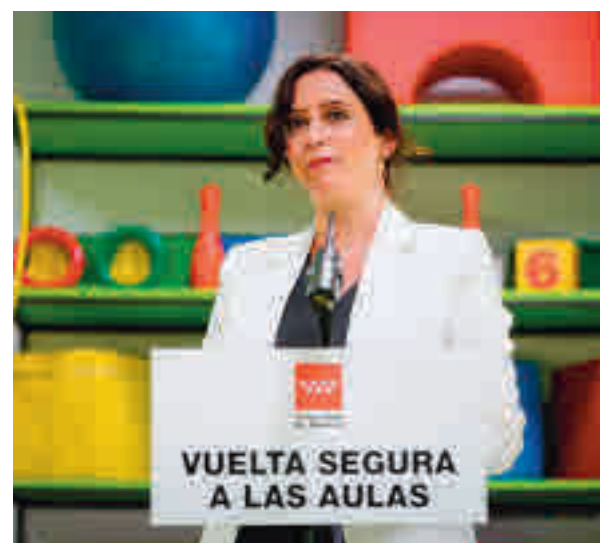
Isabel Díaz Ayuso, en un colegio de Getafe

nistra de Educación, Isabel Celáa; la presidenta madrileña, Isabel Díaz Ayuso; o el consejero regional, Enrique Ossorio. En todos los casos el mensaje es claro: "Los niños van a estar más seguros en las aulas que en otras partes".