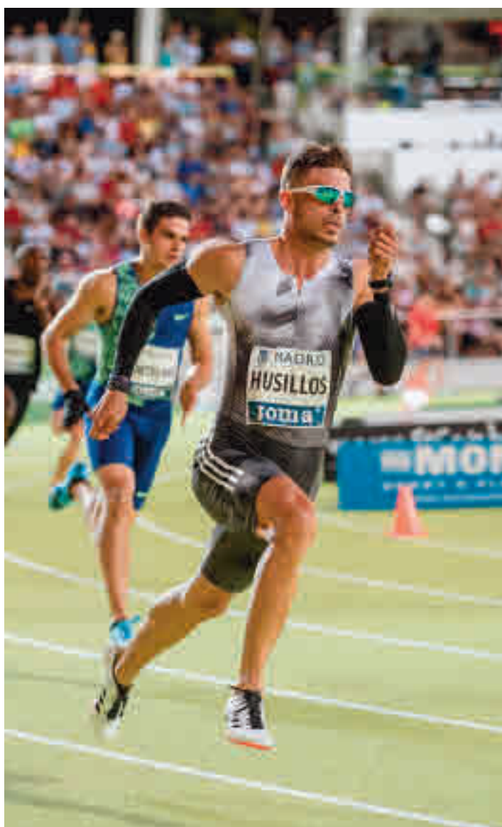
Septiembre es sinónimo de atletismo en Madrid

La nueva normalidad ha llegado para quedarse y obliga a estos deportistas a replantear sus objetivos a corto plazo y, por tanto, su preparación en un año sobre el que habían puesto muchas de sus esperanzas. De hecho, la temporada ha comenzado bastante más tarde de lo deseado, pero al menos el calendario ya ha sido inaugurado, colocando a Madrid como el epicentro de esta disciplina