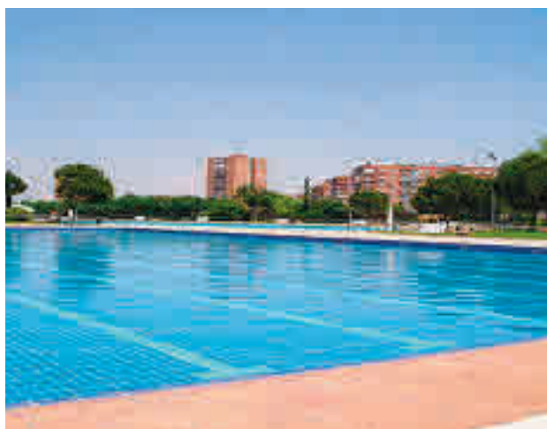
Las piscinas de Madrid ya han cerrado sus puertas