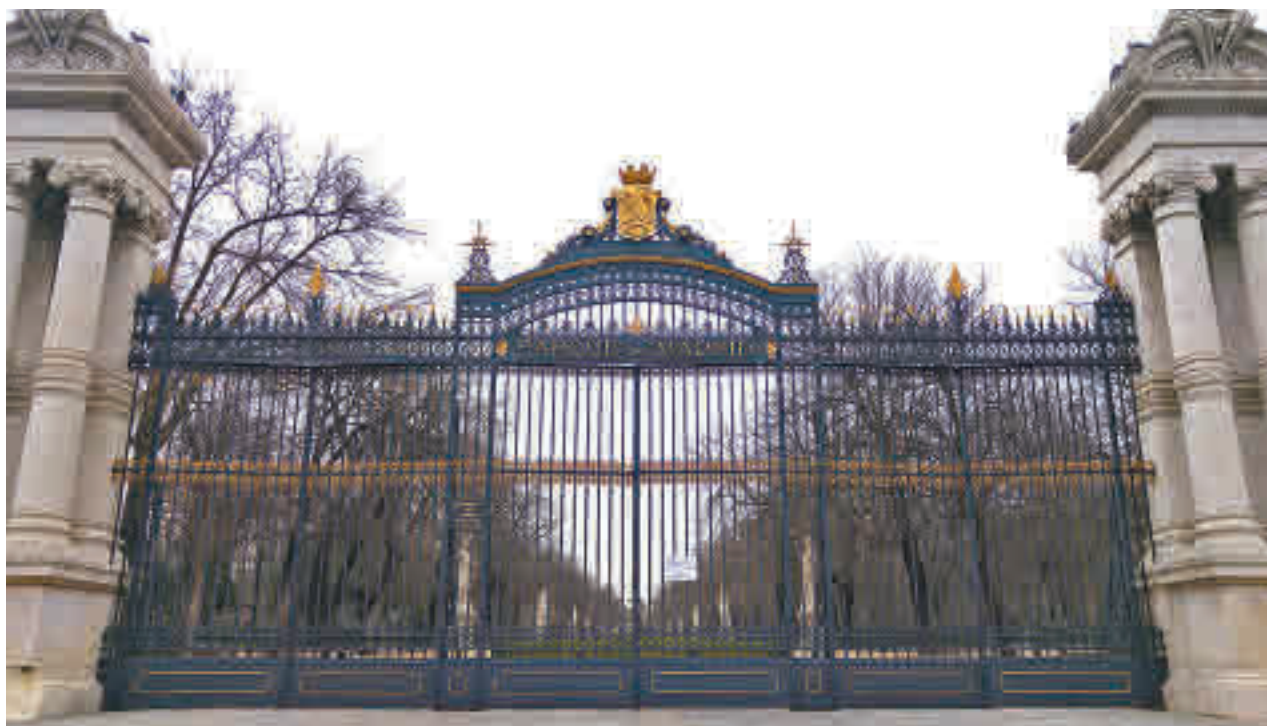
Los parques de la capital están cerrados en horario nocturno

En concreto, en Puente de Vallecas se han registrado en este periodo de tiempo 1.196 casos, en Carabanchel 936 y en Ciudad Lineal 700.