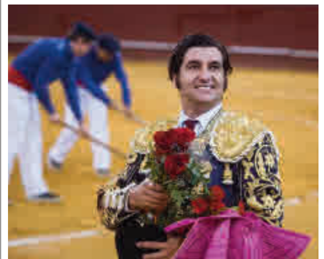
Morante era uno de los diestros anunciados

gentedigital.es Toda la información del Norte en nuestra página web