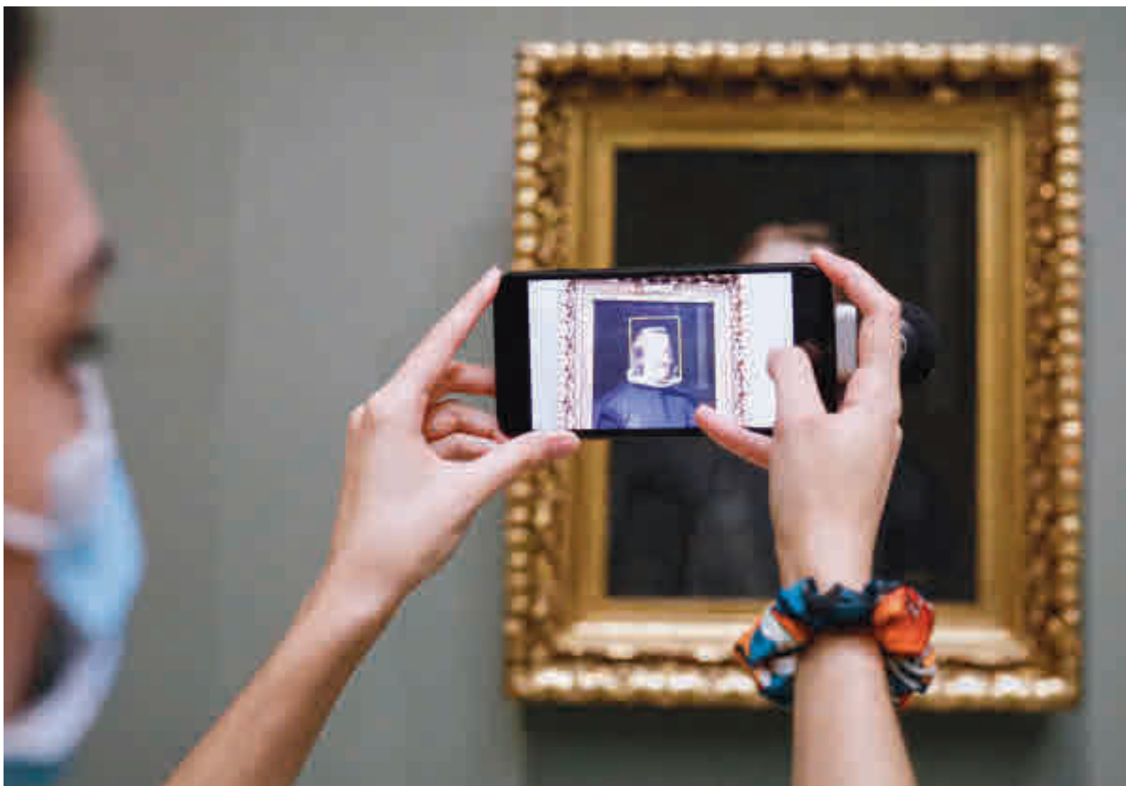
Las visitas a los museos han bajado sensiblemente este verano