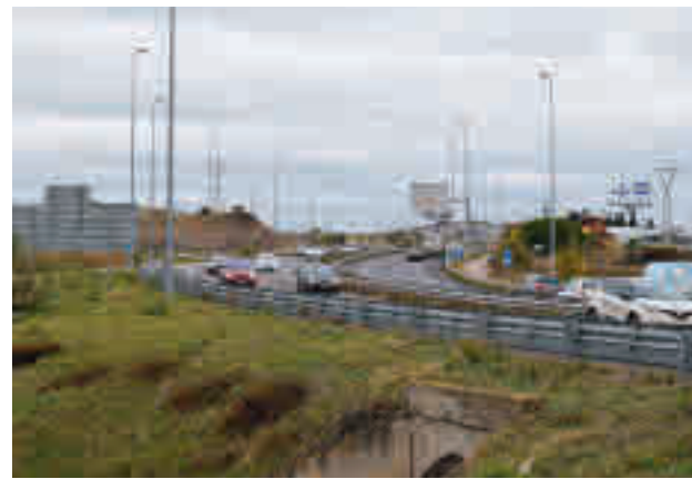
Tramo de la carretera M-607 entre Colmenar y Tres Cantos

Pero la intervención diseñada por la Consejería de Trans-