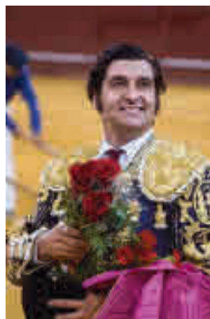
Morante de la Puebla

En concreto, estaba previsto que este viernes 4 a las 22 horas se celebrase un concurso de recortadores, mientras que para el sábado 5 a las 19:30 horas se había anunciado una corrida con los diestros Morante de la Puebla, 'El Juli' y José María Manzanares. Con la cancelación, la de-