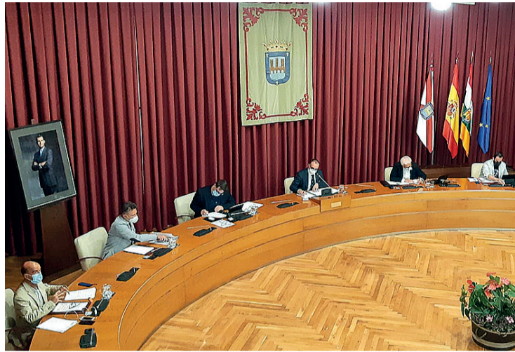
El Pleno se celebró de forma semipresencial con los ediles separados entre sí.

En contra de la propuesta de PP, Cs y regionalistas, votaron socialistas y Unidas Podemos. La repre-