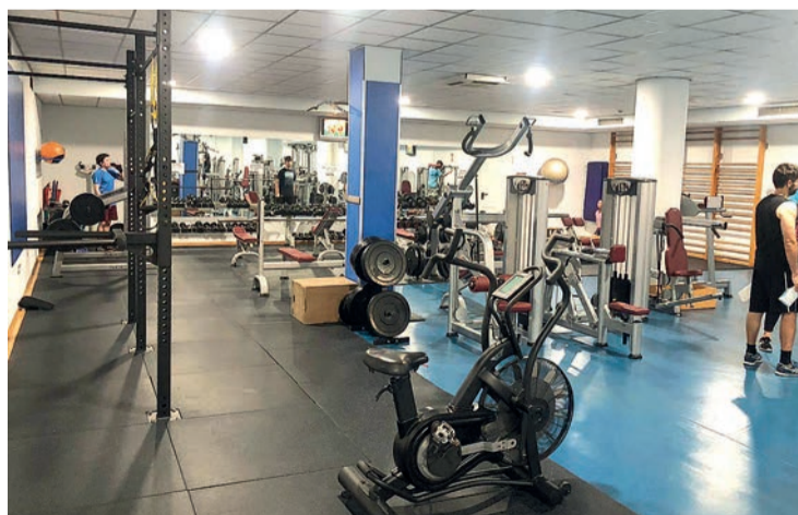
Para poder utilizar las instalaciones de forma individual es necesario pedir cita previa.

El periodo de inscripción para usuarios se iniciará el jueves 10 y ya está disponible para abonados en los teléfonos 010