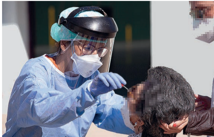
El Ejecutivo podrá realizar campañas de cribado perimetral en poblaciones de riesgo.

tos y eventos con reserva de plaza o asignación de hora y puerta de acceso, será obligatoria la reserva previa nominal (nombre y apellidos, dirección y teléfono) para evitar aglomeraciones y posibilitar el rastreo de contagios.