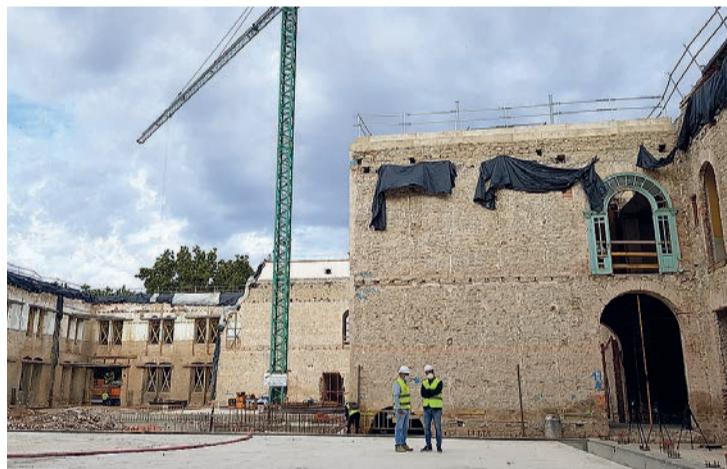
El nuevo instituto podría estar operativo para el curso 2022-2023.

EL ARQUITECTO DE LA REFORMA CONTEMPLA ABRIR DOS PUERTAS EN LA ZONA SUR DEL RECINTO, PARA QUE HAYA MÁS MOVIMIENTO DE GENTE EN ESA ÁREA COMERCIAL