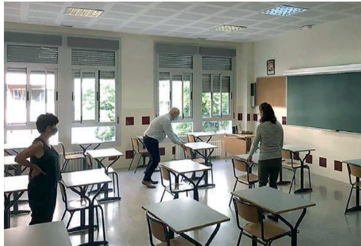
Profesores sitúan las mesas de las aulas respetando la distancia de seguridad.

Precisamente, una de las dudas de cara a este inicio escolar guar-