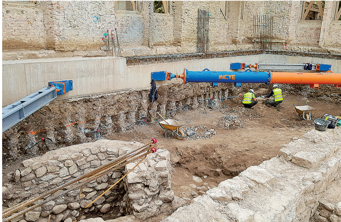
Parte de la muralla de la época napoleónica descubierta recientemente y que obliga a una excavación manual de la zona.

No se puede avanzar al ritmo previsto porque es precisamente en la crujía sur -en esa zona ha