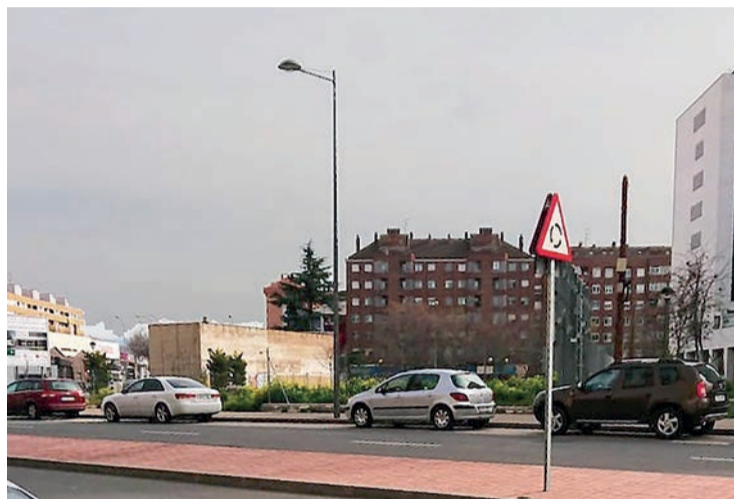
Espacio entre la gasolinera de Cascajos y el supermercado que se va a urbanizar.

También es ambicioso el PERI 'Fueros', ya anunciado por el anterior equipo de Gobierno en mayo de 2019, y que ahora ha sido de nuevo aprobado una vez ha culminado con éxito el proceso de exposición pública tras el que se han