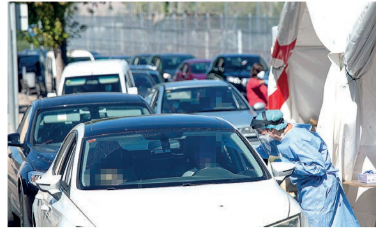
Dispositivo instalado en las inmediaciones de La Molineta para realizar las PCR.

A las personas con resultado negativo se les informa por SMS y los positivos son contactados por la Unidad COVID para identificar sus contactos estrechos y seguir