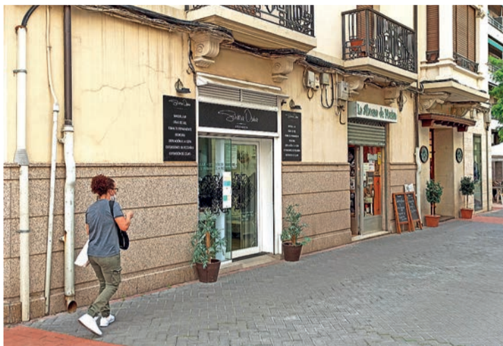
El equipo de Gobierno busca apoyar al pequeño comercio de proximidad.

Estas ayudas al comercio de proximidad se suman a otras iniciativas como el “exitoso” Bono Comercio, el bono turístico o la partida extraordinaria de 650.000 euros puesta en marcha en el mes de abril para “generar liquidez y aliviar la carga y costes económicos actuales con el fin de reducir