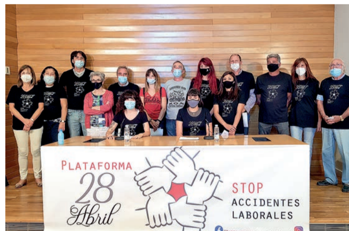
Integrantes de la ‘Plataforma 28 de abril: STOP accidentes laborales’, el miércoles 2.

García señaló que “durante los últimos años estamos asistiendo a un notable crecimiento de los ac-