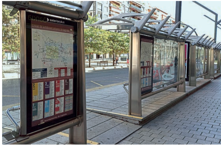
Los autobuses de la línea 2 pasan cada 10 minutos, de la 1 cada 12 y de las 3, 4, 5 y 10 cada 15.

Así, desde el martes 1 y en días laborables hay un autobús de la línea 2 cada 10 minutos; de la 1, cada 12 minutos; y de las líneas 3, 4, 5 y 10,